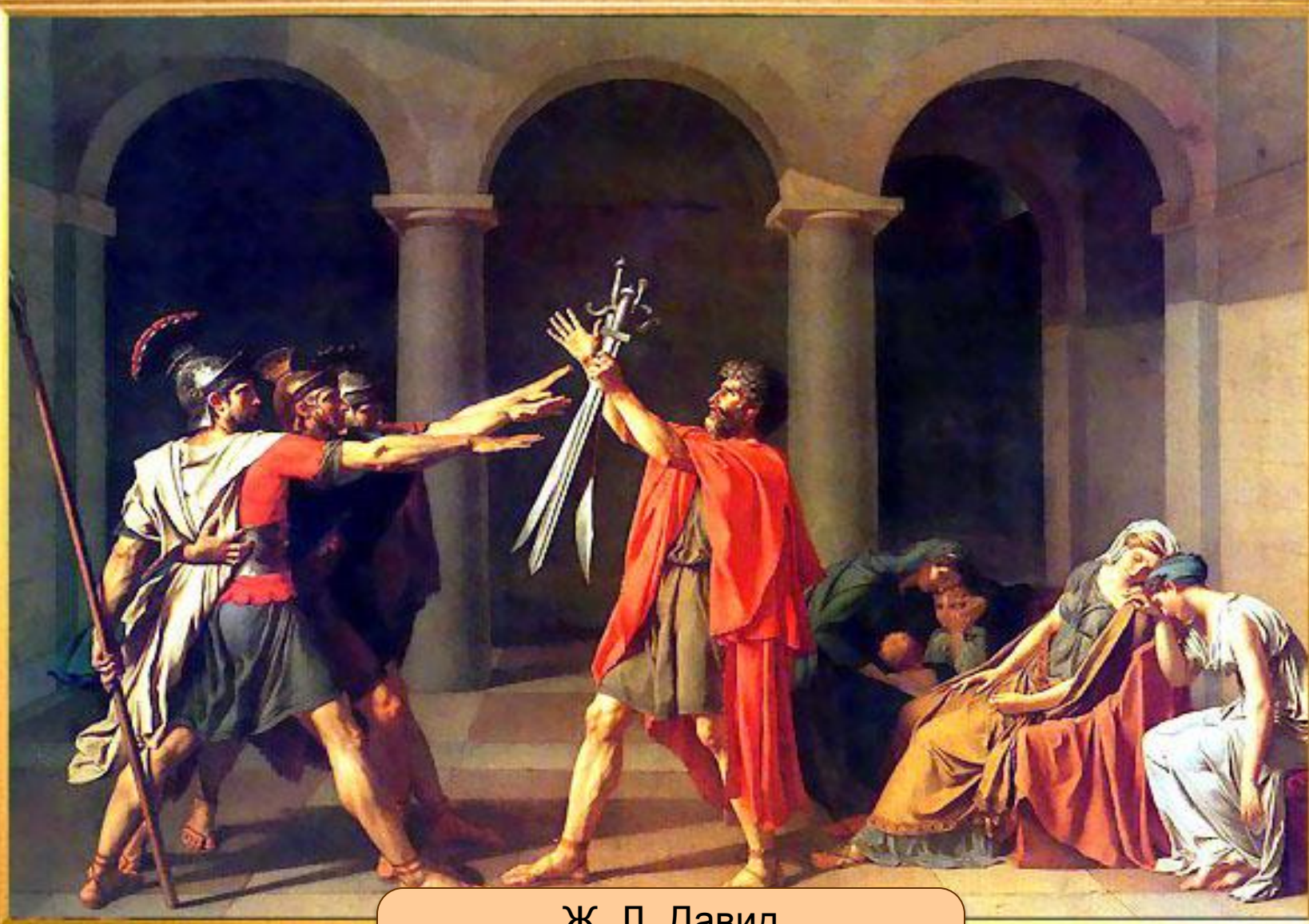
Ж. Л. Давид «Клятва горацев» 1784г.