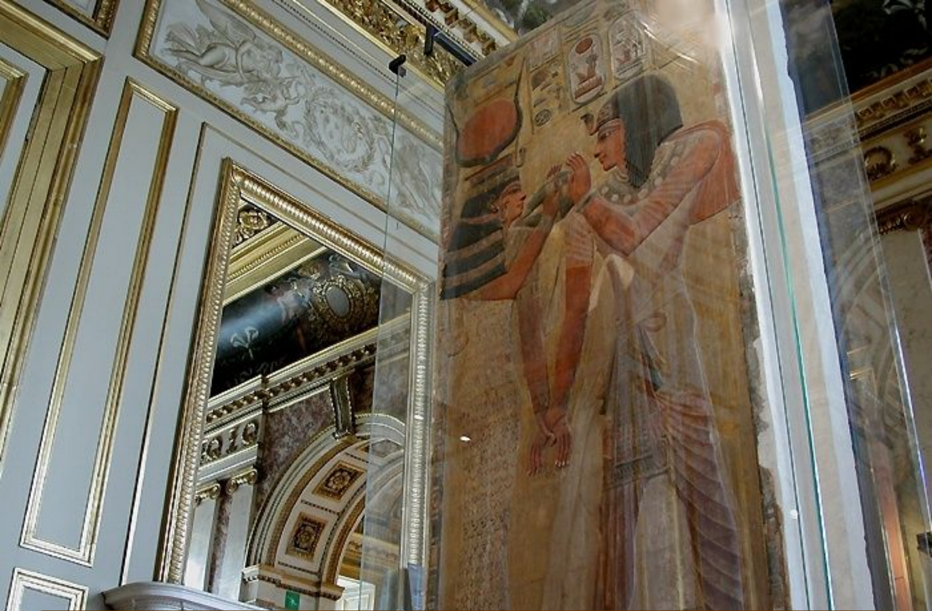
Рельеф из гробницы Сети I с изображением царя перед богиней Хатхор. XIX династия