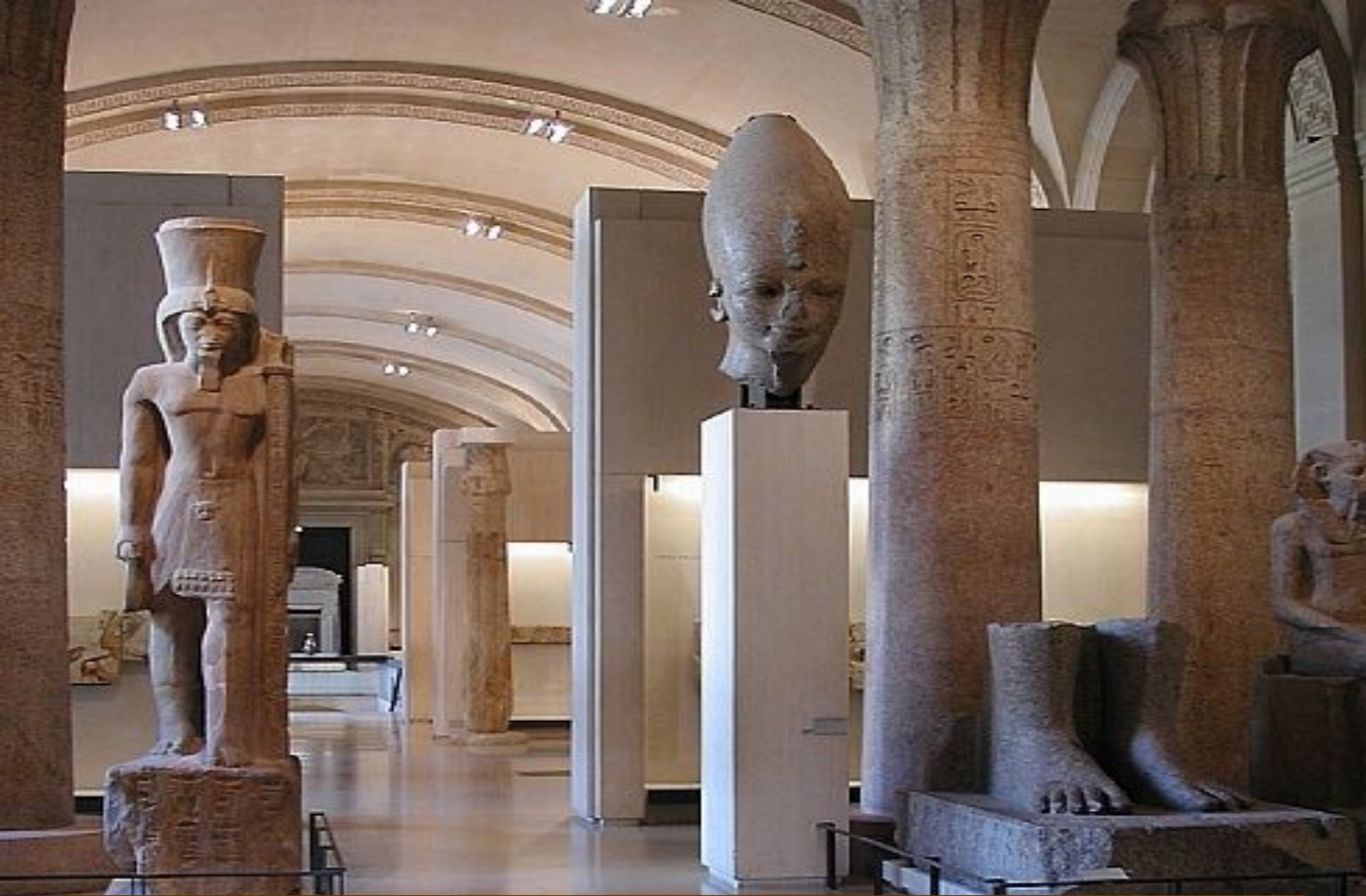
Зал, посвященный убранству храма. Колосс Сети II из Карнака, голова колосса Аменхотепа III из Ком эль-Хеттан