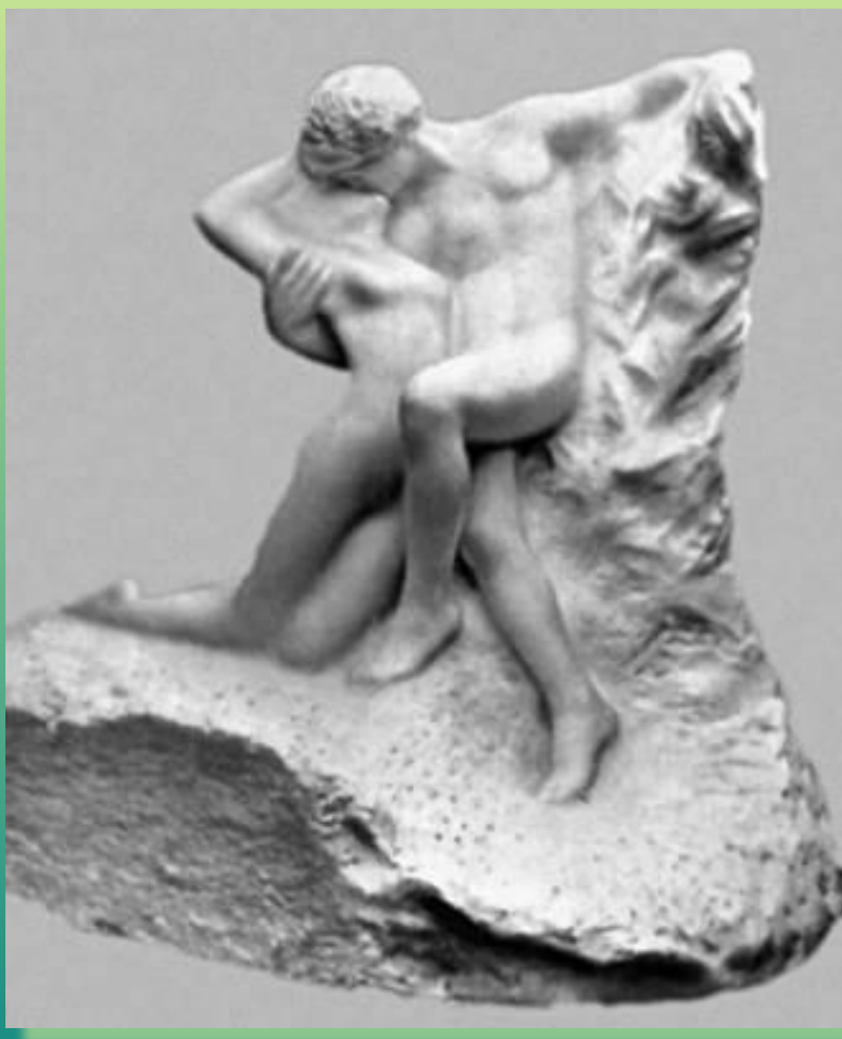
О. Роден. «Вечная весна». 1897. Мрамор