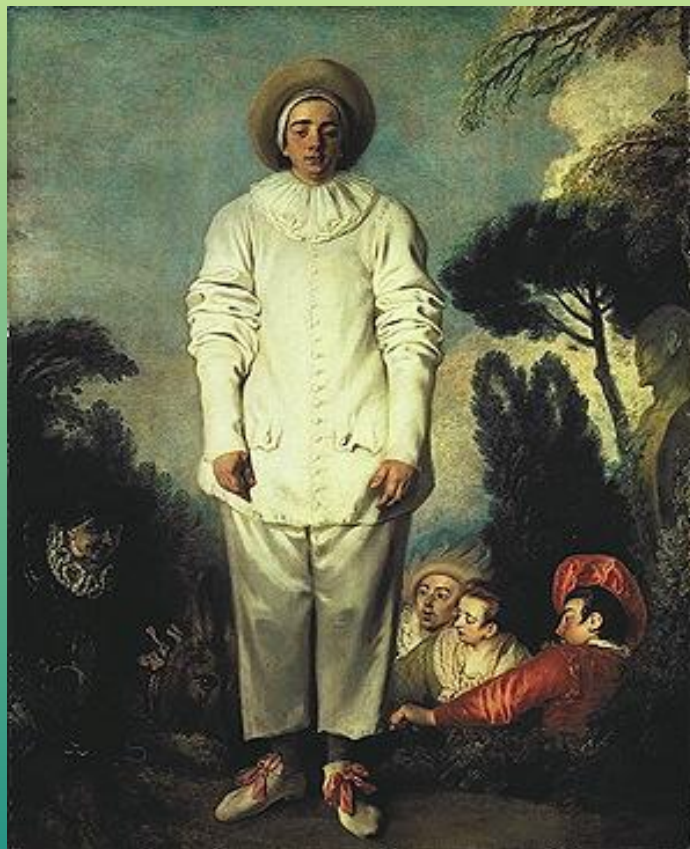
Жан-Антуан Ватто Пьерро (также известно под названием Жиль ) Прибл. 1718-1719