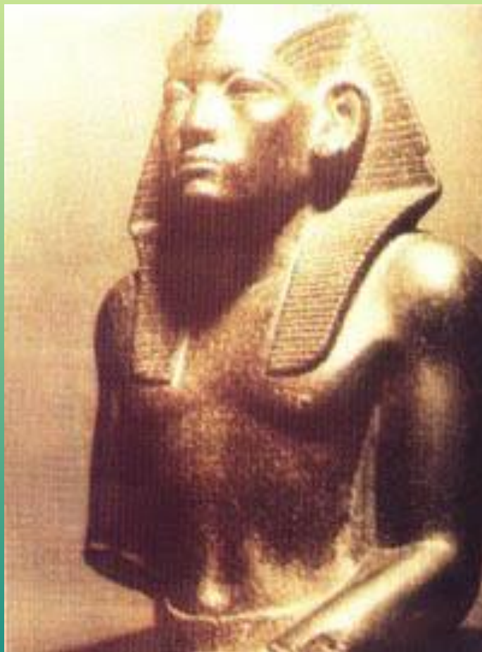
Аменхотеп III. XIX в. до н.э.