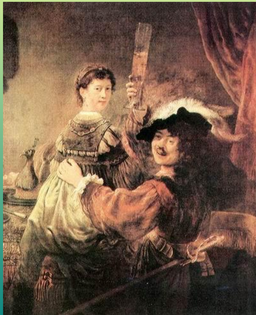
Рембрандт ван Рейн «Автопортрет с Саскией»