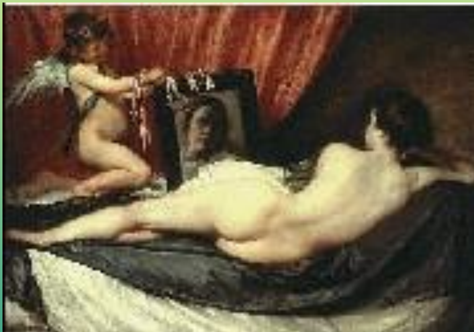
Д.Веласкес. Венера перед зеркалом