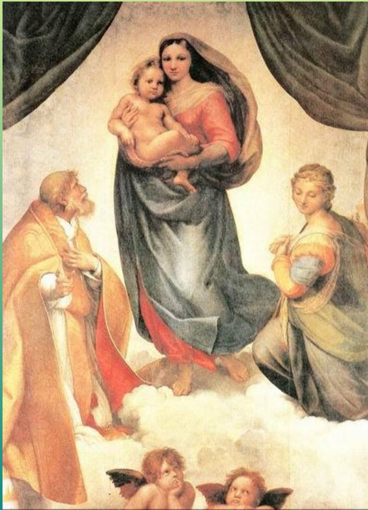
Рафаэль Санти «Сикстинская мадонна»