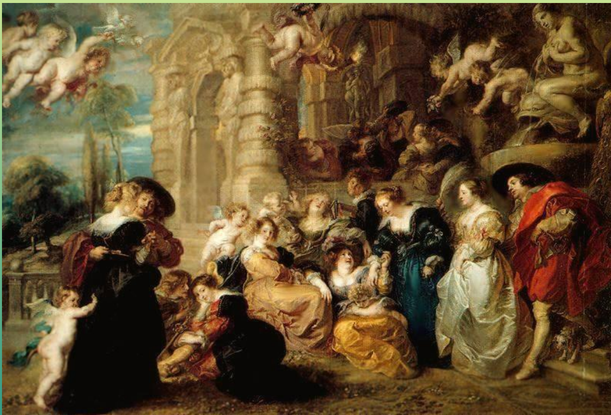
Питер Пауль Рубенс. «Сад любви»