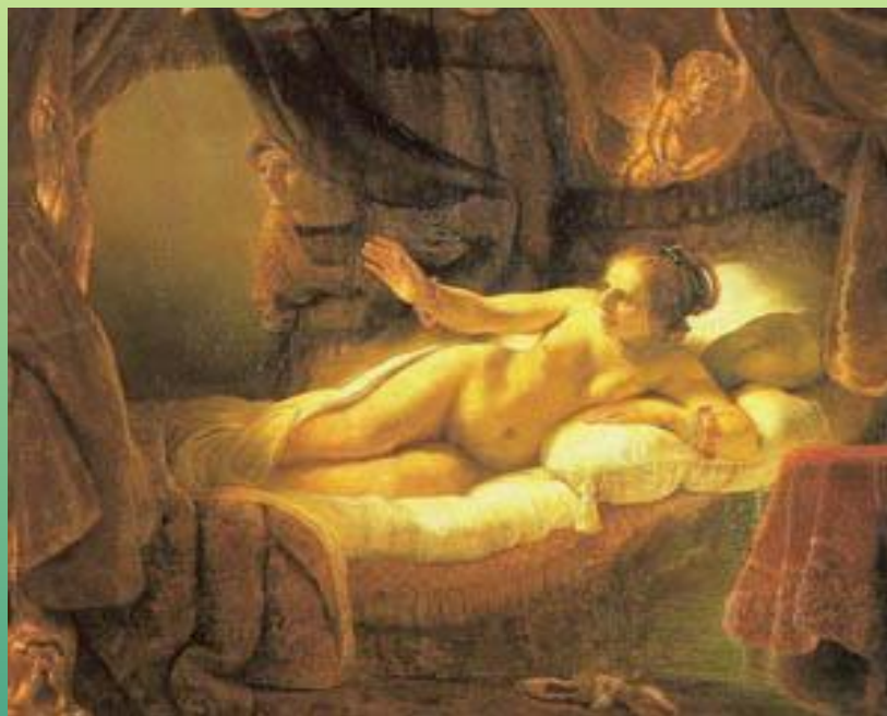
Даная. 1636 г.

Рембрандт ван Рейн (1606—1669). В Эрмитаже хранится двадцать шесть картин великого голландца