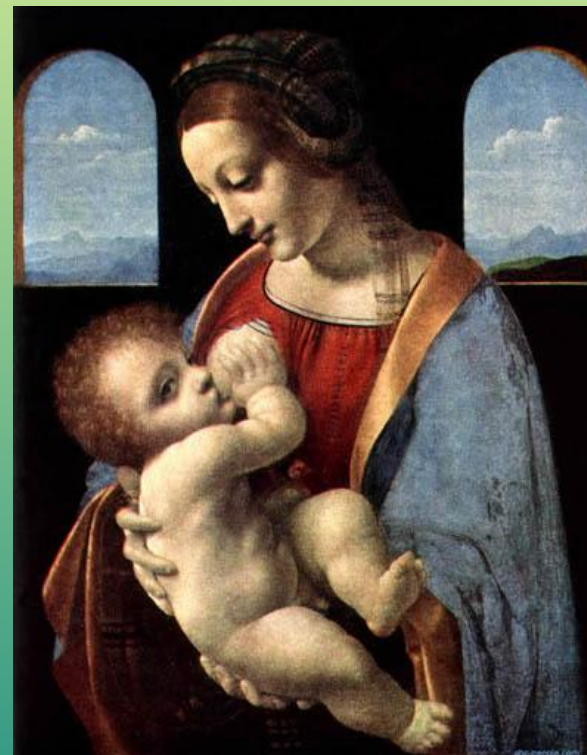
Леонардо да Винчи. Мадонна Литта. 1478-1482.