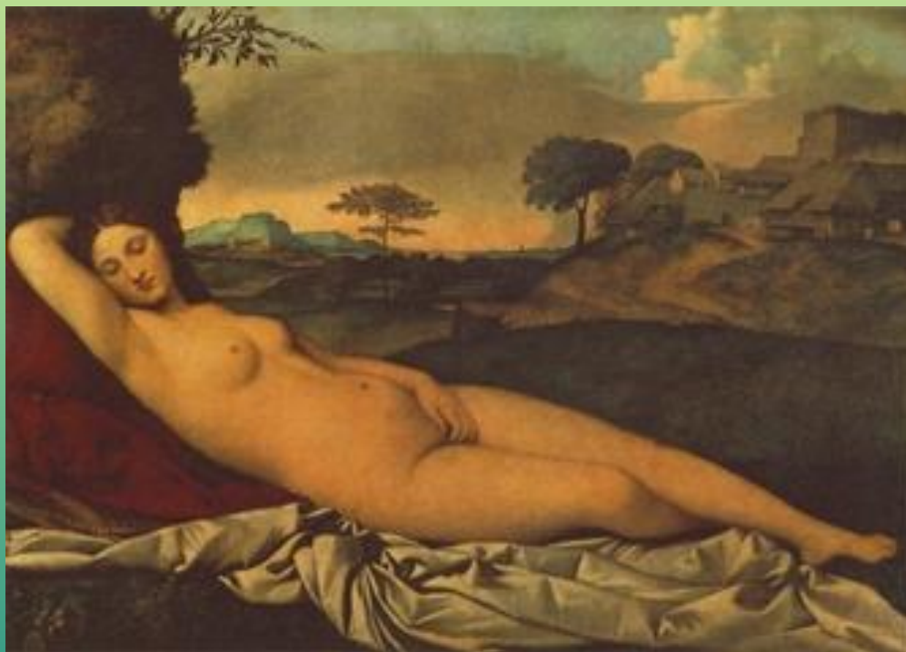
Джорджоне «Спящая Венера»