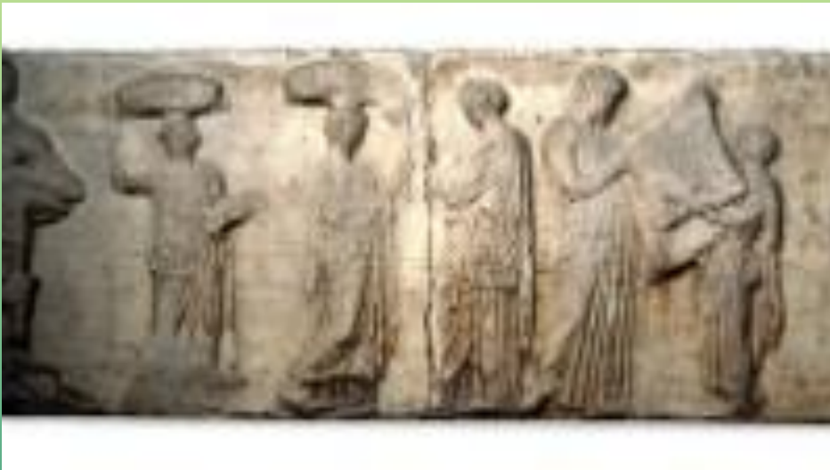
Центральный барельеф восточного фриза Парфенона. Афины, Греция (438-432 гг. до н.э.)