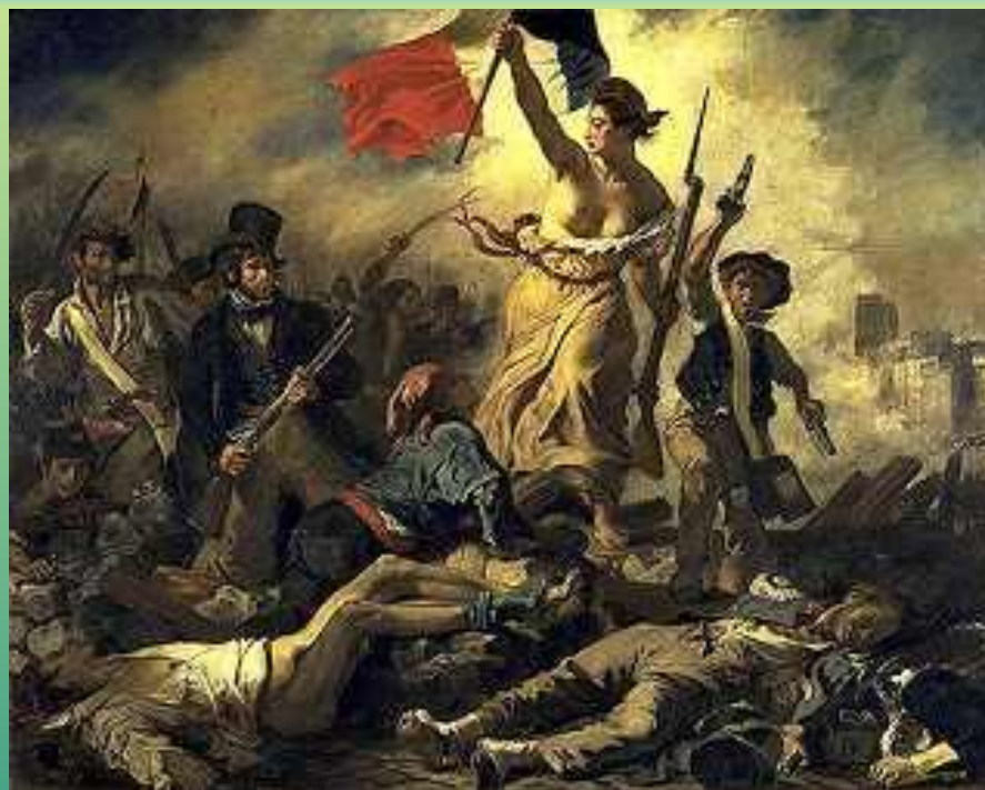
Эжен Делакруа Свобода, ведущая народ (28 июля 1830 года) 1830