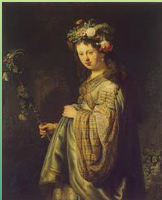
Флора. 1634 г.