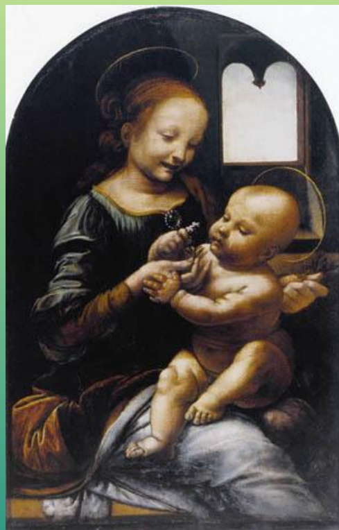
Леонардо да Винчи. Мадонна Бенуа. 1478 г.