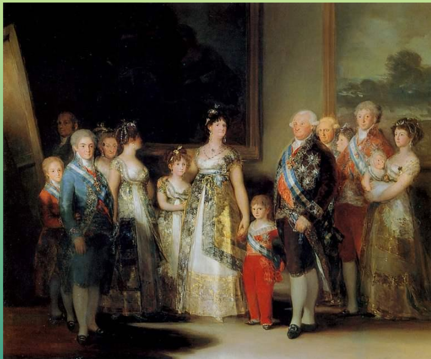
Ф.Гойя. «Портрет семьи Карла IV»