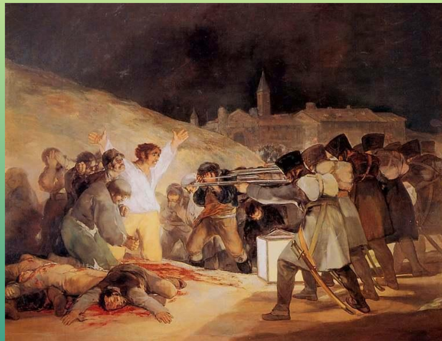
Ф. Гойя. «Расстрел 3 мая 1808года»