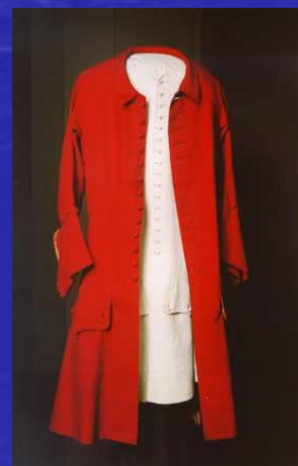
Костюм Петра I