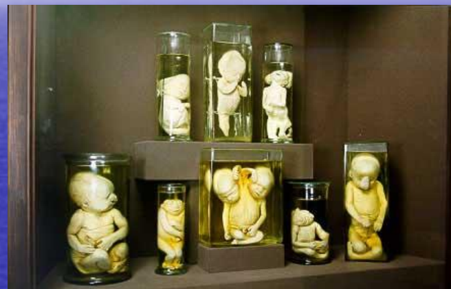
Анатомическая коллекция Рюйша

Этнографический и Анатомический кабинеты в 1879 г. были объединены в Музей антропологии и этнографии им. Петра Великого Российской Академии наук, унаследовавший и само здание Кунсткамеры.