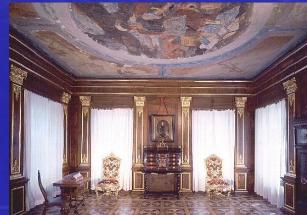
Парадный кабинет А. Меншикова