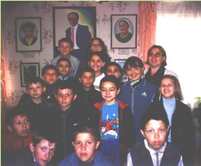
На стене портреты родителей поэта

Дом поэта, где он проводит лето, построен на месте родного дома, который не сохранился