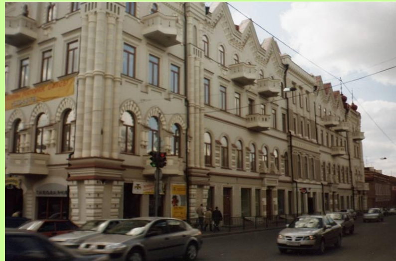
Дом купца Кекина начала XX века