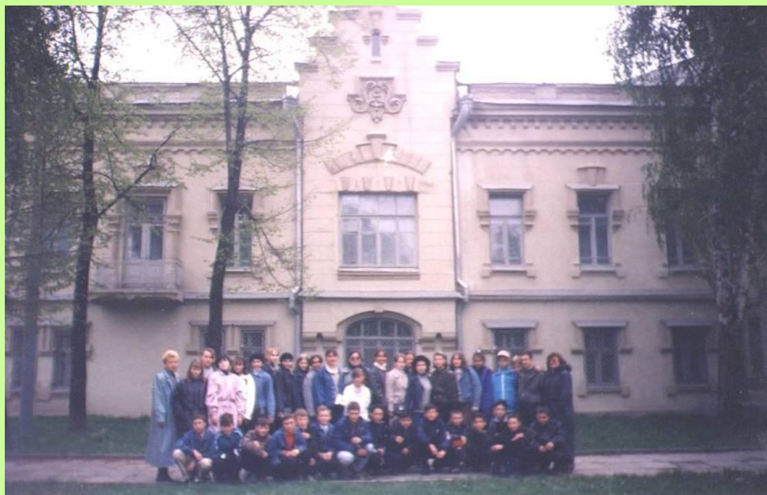
Дом купца Апанаева