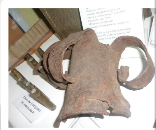
Голова (часть) от шлема