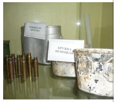
КРЫШКА ОТ КОТЕЛКА КРУЖКА НЕМЕЦКАЯ

Корпус артиллерийской машины (прототип) изготовлен в Германии. Впервые использован в боях в 1941 году. Металлический корпус машины изготовлен из листового металла толщиной 10 мм. В корпусе предусмотрены отверстия для крепления деталей машины. Корпус машины имеет форму цилиндра с коническим концом. Диаметр корпуса 100 мм. Длина корпуса 150 мм. Вес корпуса 10 кг. Корпус машины изготовлен в Германии. Впервые использован в боях в 1941 году.