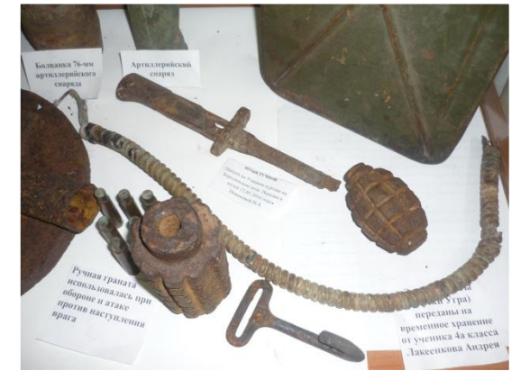
Ручная граната использована для обороны и атаки против наступления врага Артиллерийский снаряд Голова (часть) от шлема