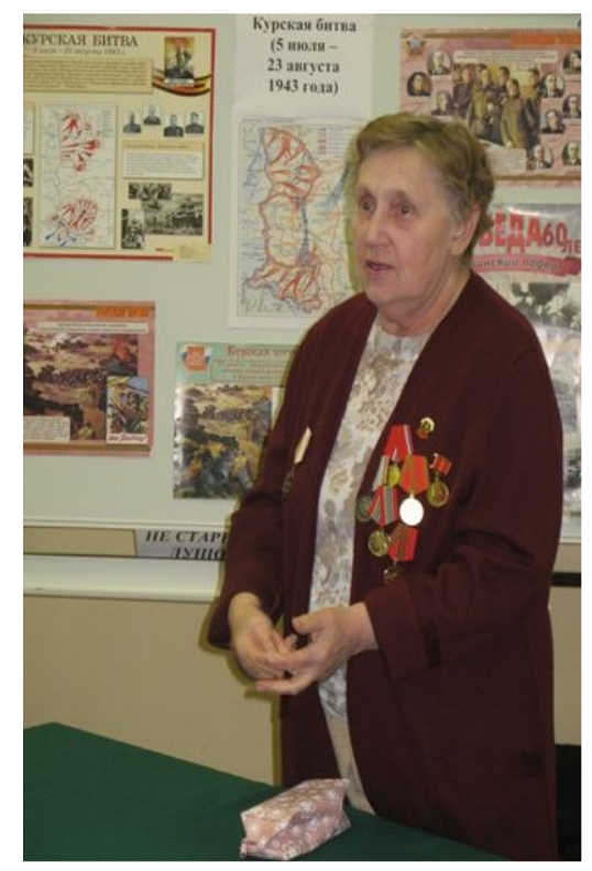
Уроки Мужества помогают брать пример с людей старшего поколения