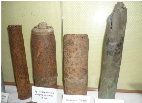
Артиллерийский снаряд калибра 76 мм Болюшка 76-мм