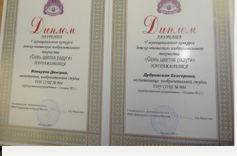
Наши награды. О нас пишут в газетах, журналах