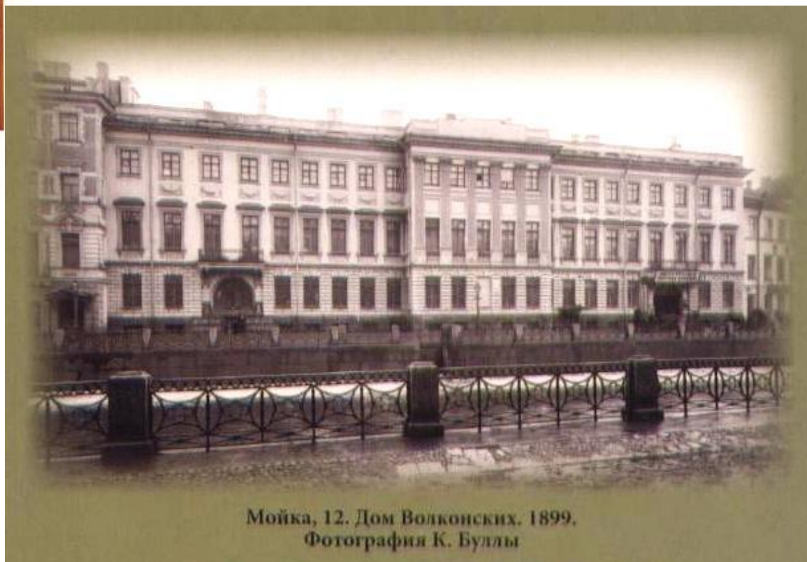
Мойка, 12. Дом Волконских. 1899.