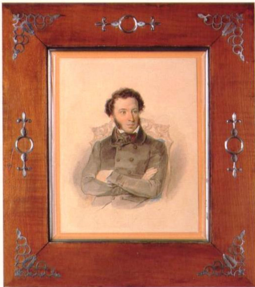
Худ. Соколов П. Ф. 1836