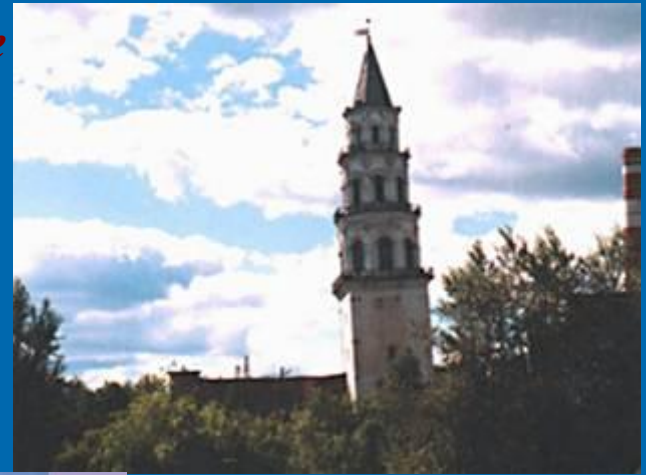
Невнянская наклонная башня

Казанский кремль представляет собой пример синтеза русской и татарской архитектуры. Территория кремля, имеющая форму неправильного многоугольника, окружена крепостными стенами, высота которых 8-12м., и башнями. Нынешние стены и башни построены русскими в XVIв., реконструированы в XVIIIв.