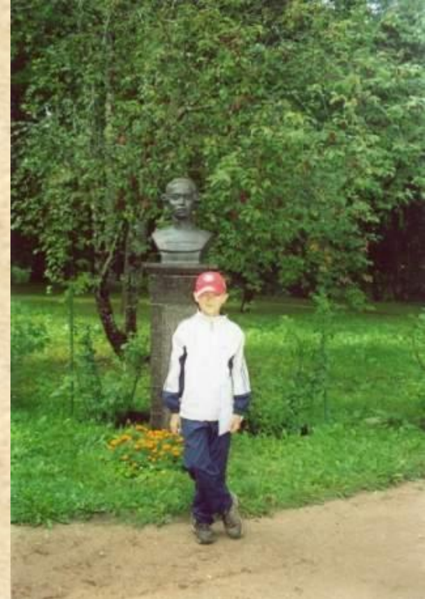
Бюст Абраму Ганнибалу в Петровском

В деревне, где Петра питомец Царей, цариц любимый раб И их забытый однодомец, Скрывался прадед мой аран,