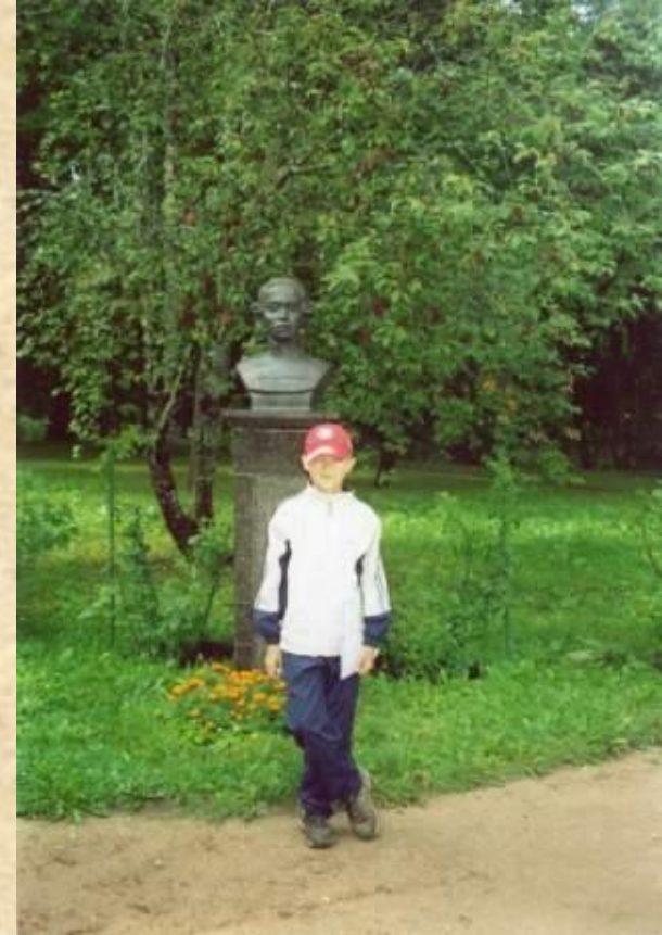
Бюст Абраму Ганнибалу в Петровском

В деревне, где Петра питомец Царей, цариц любимый раб И их забытый однодомец, Скрывался прадед мой аран,