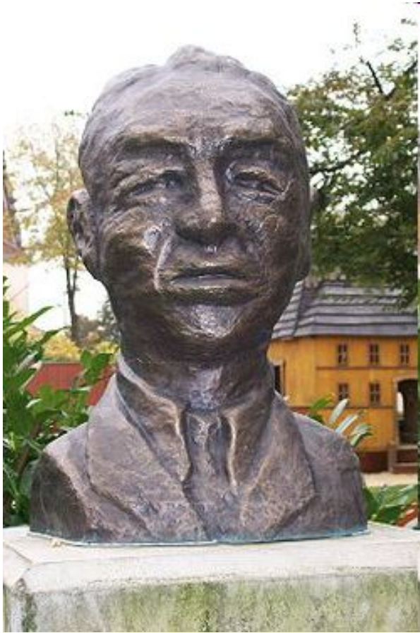
Бюст Адольфа Рейхвейна, Оснабрюк, Германия