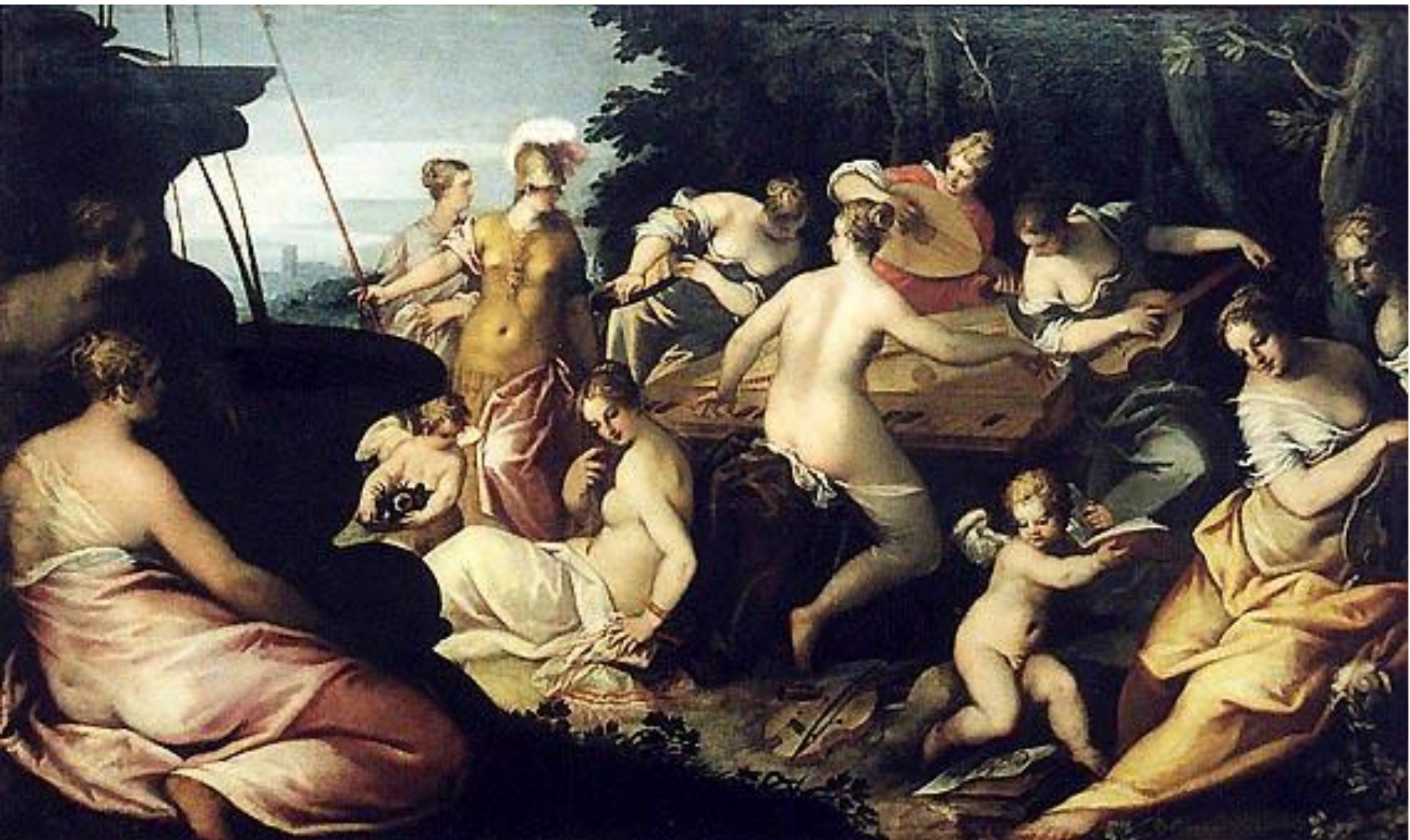
Музы и Афина Ханс Роттенхаммер