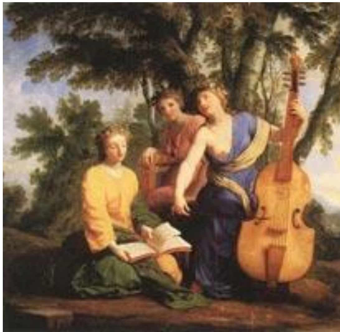
Музы: Мельпомена, Эрато и Полигимния Эсташ Лесюэр