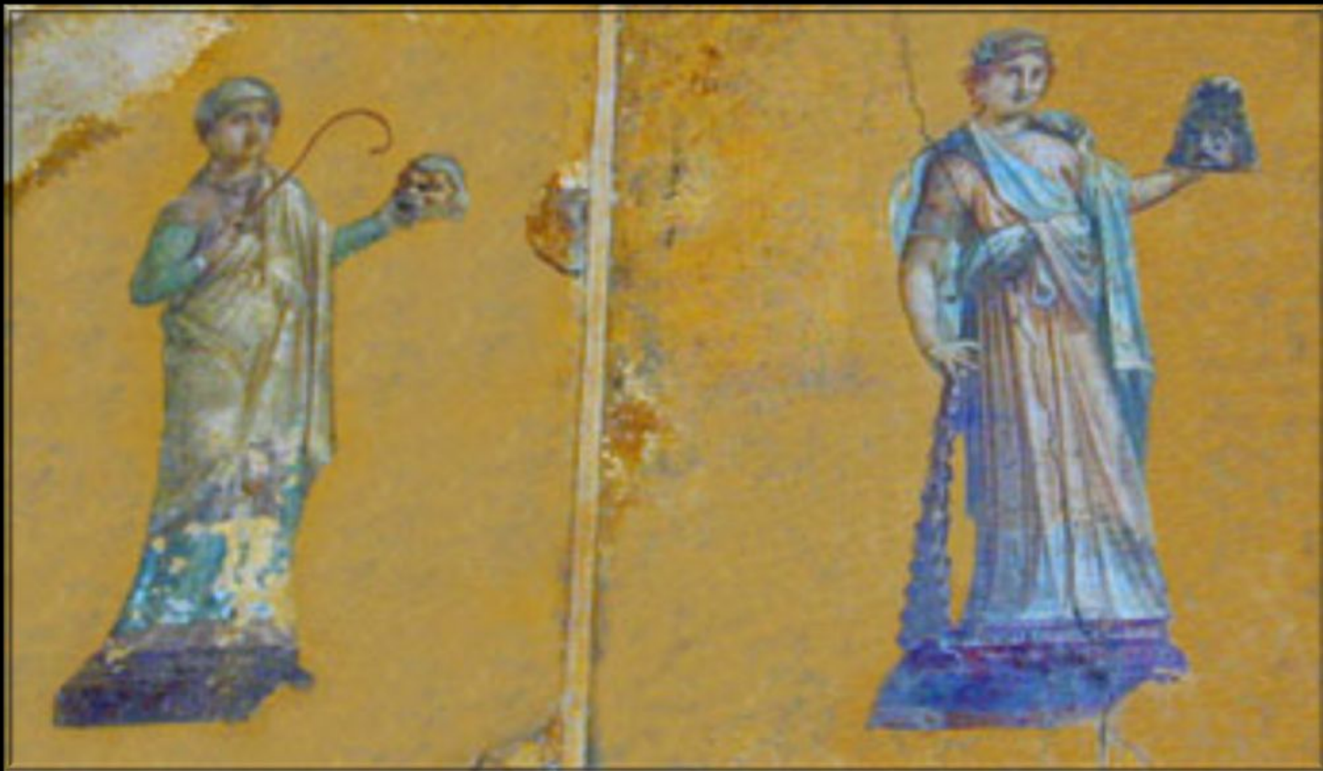
фреска из Помпей, I в. н.э

Муза комедии и муза трагедии. Мельпомена и Талия олицетворяют театр жизни, жизненный ОПЫТ.