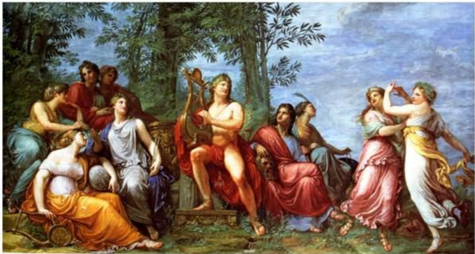
Парнас. В хороводе муз