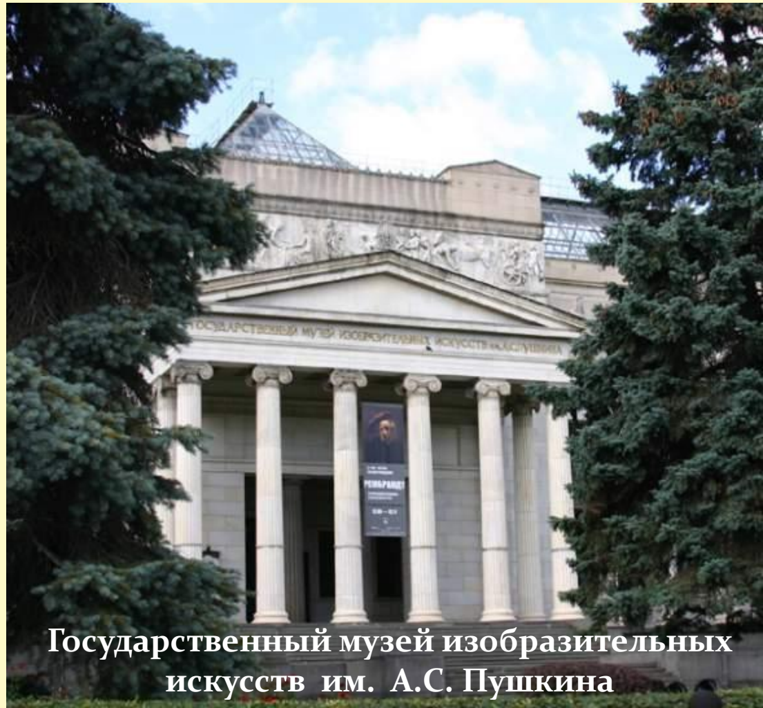
Государственный музей изобразительных искусств им. А.С. Пушкина