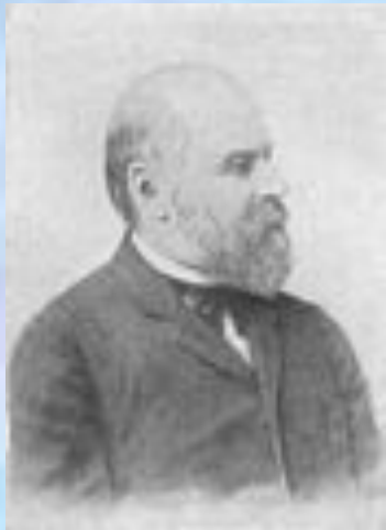
М. А. Балакирев

К середине 1870-х годов «Могучая кучка» как сплочённая группа перестала существовать. Деятельность «Могучей кучки» стала эпохой в развитии русского и мирового музыкального искусства.