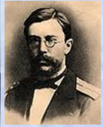
Н. А. Римский-Корсаков