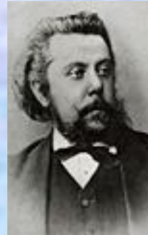
М. П. Мусоргский