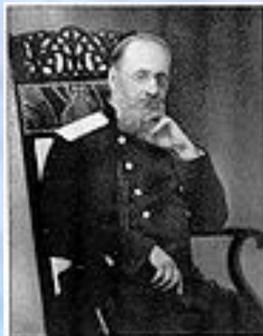
Ц. А. Кюи