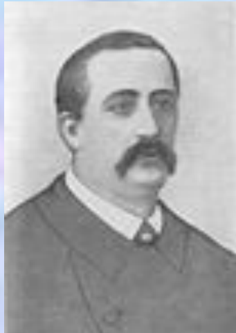
А. П. Бородин