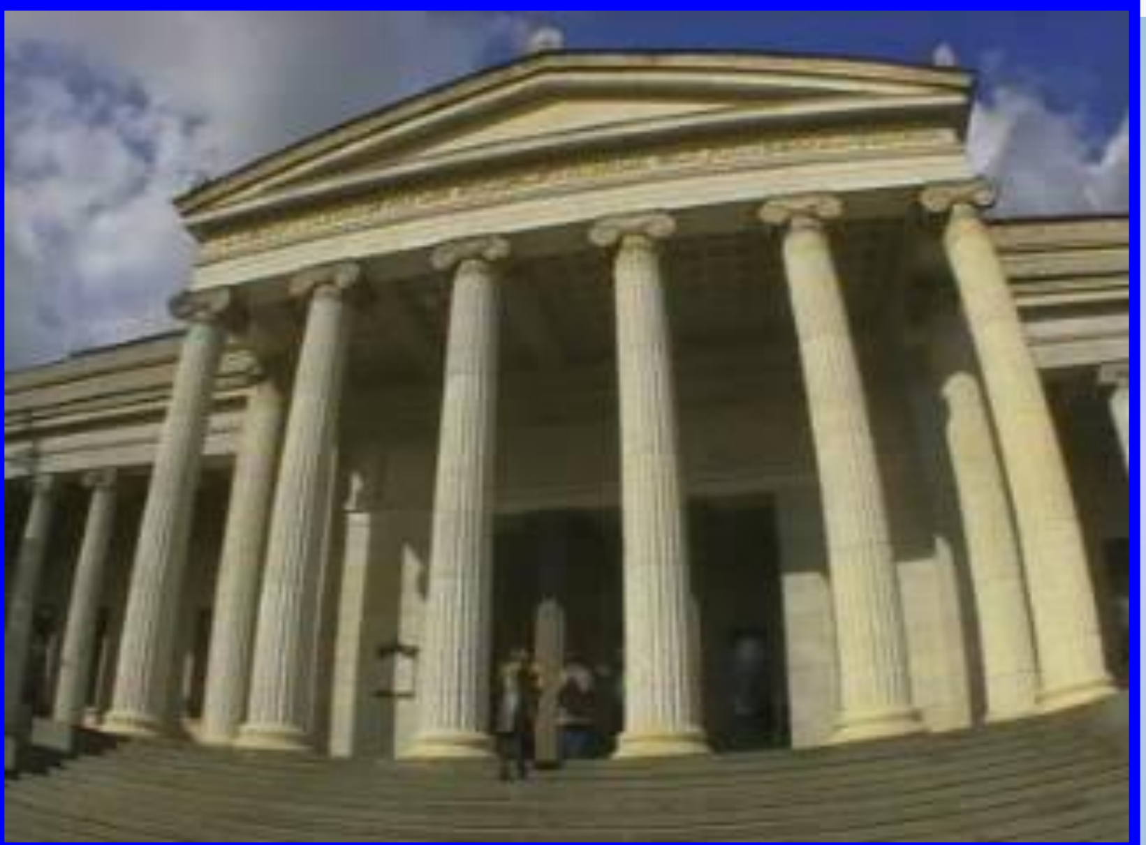
Музей изобразительных искусств имени Пушкина.