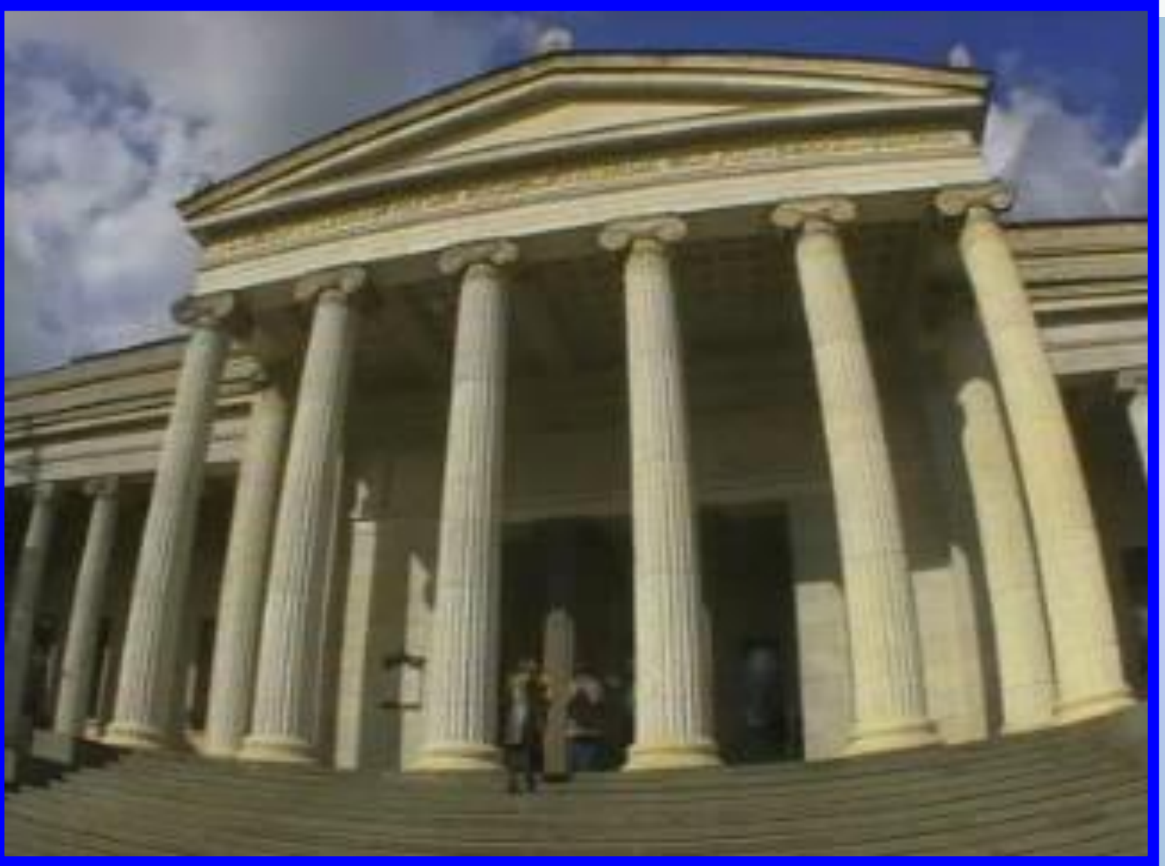
Музей изобразительных искусств имени Пушкина.