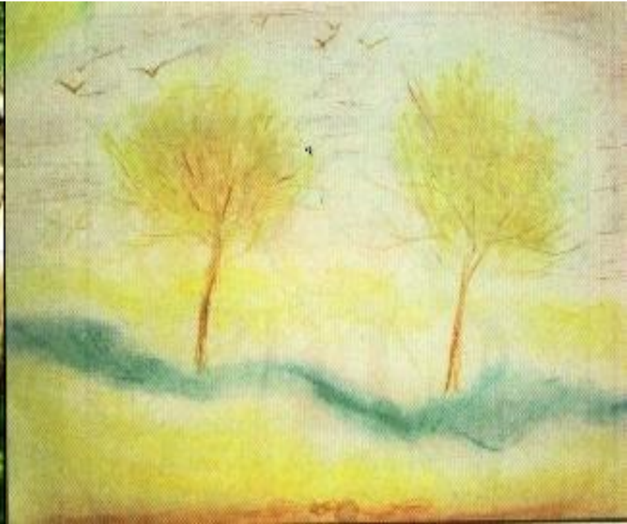
И.Левитан "Берёзовая роща"