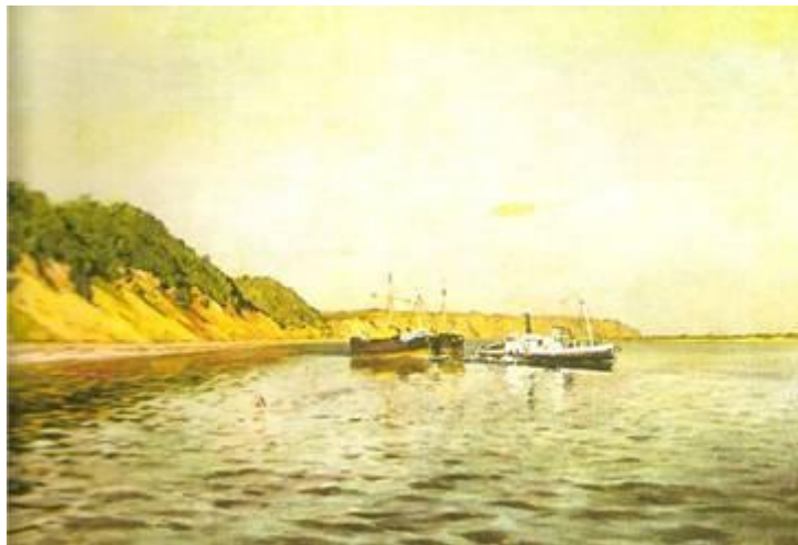
«Серый день. Лес над рекой», этюд 1888 «В Плесе», этюд, фрагмент