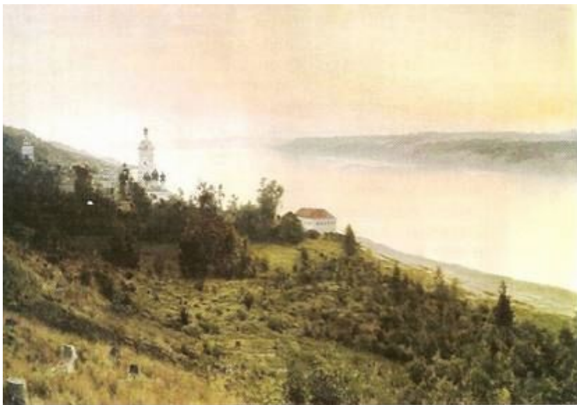
«Вечер. Золотой Плес». 1889 г. Государственная Третьяковская галерея.