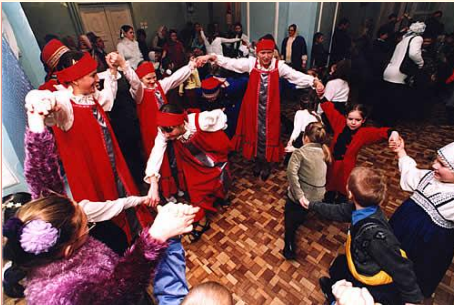
Игровой хоровод с «заплетением плетня»