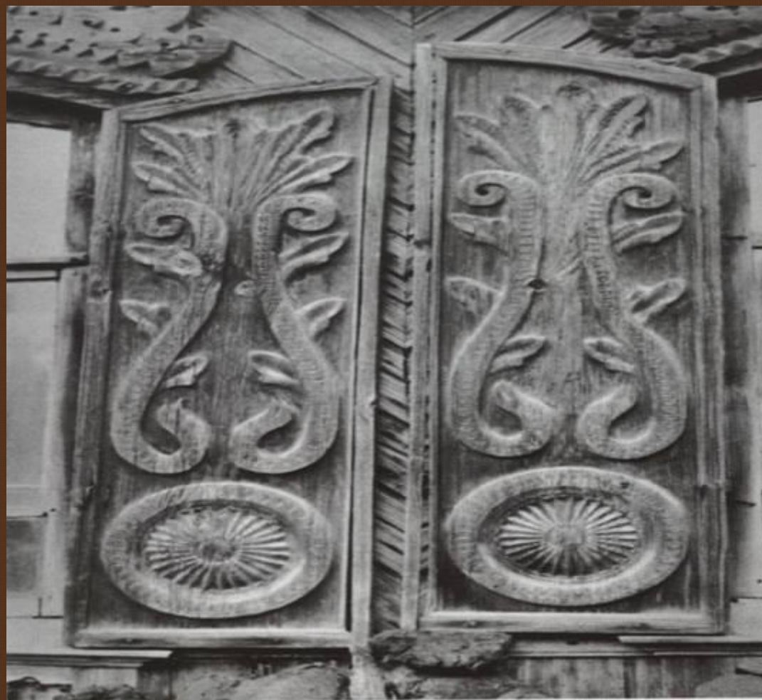
Ставни. Вторая половина XIX века. Дубенский район.