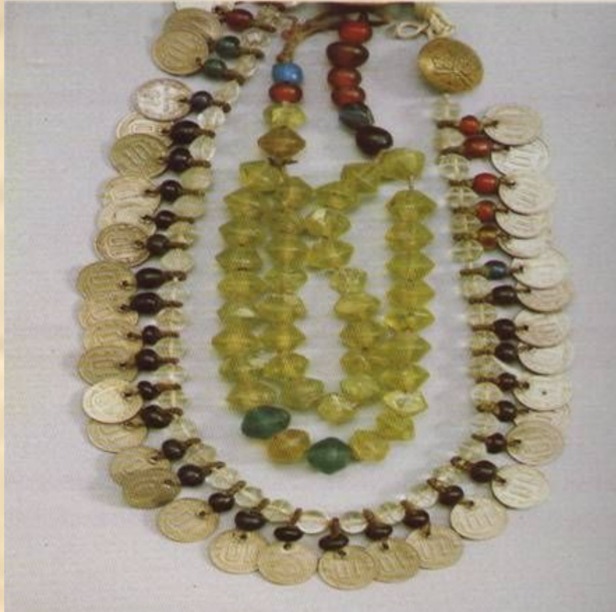
Женские нагрудные украшения. XX век. Мордва- Мокша. Старошайговский район.