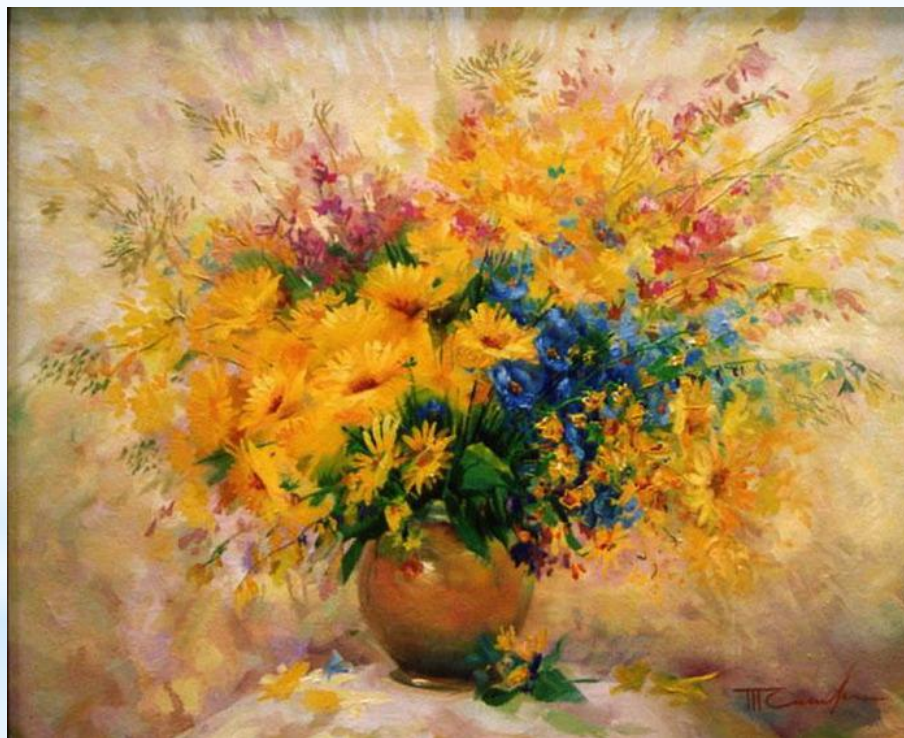
Пример российского натюрморта

XVIII век - популярность «мертвой природы» приходит в Россию. Ранние творения изображали предметы, окружающие ежедневно, природные дары. Ведущим жанром не стал, его вытеснили портрет и пейзаж. Натюрморт не считался серьезной живописью - на этом жанре учили молодых живописцев.