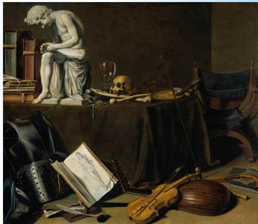
Пример «ученого» натюрморта

Наиболее необычным считается жанр «ученого» натюрморта. Впервые появился в Лейдене. Для него характерны зрительные иллюзии, доминирование религиозной, порой - мистической, символики. Стиль развивали Питер Стенвейк, Давид Байли.