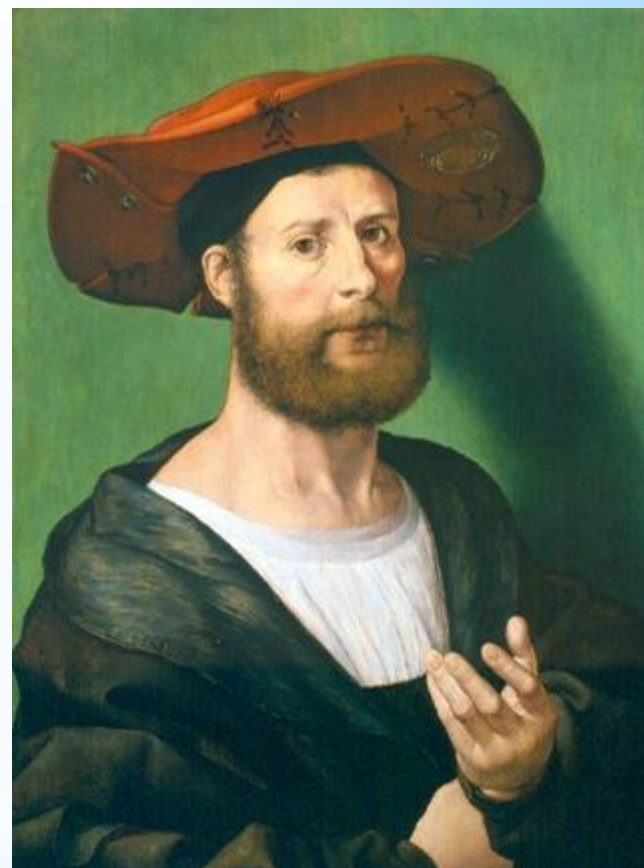
Автопортрет Яна Госсарта