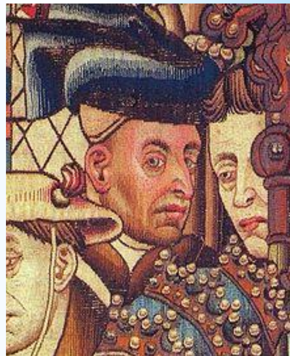
Наиболее вероятный автопортрет Рогир ван дер Вейдена

Зарождение жанра произошло в эпоху Возрождения, Раннего Нового времени. Натюрморт был частью исторической и религиозной тематики. На ранних картинах этого жанра можно увидеть изображения Богоматери, Христа, а цветы лишь обрамляли главную тематическую линию. Яркий представитель - Рогир ван дер Вейден.