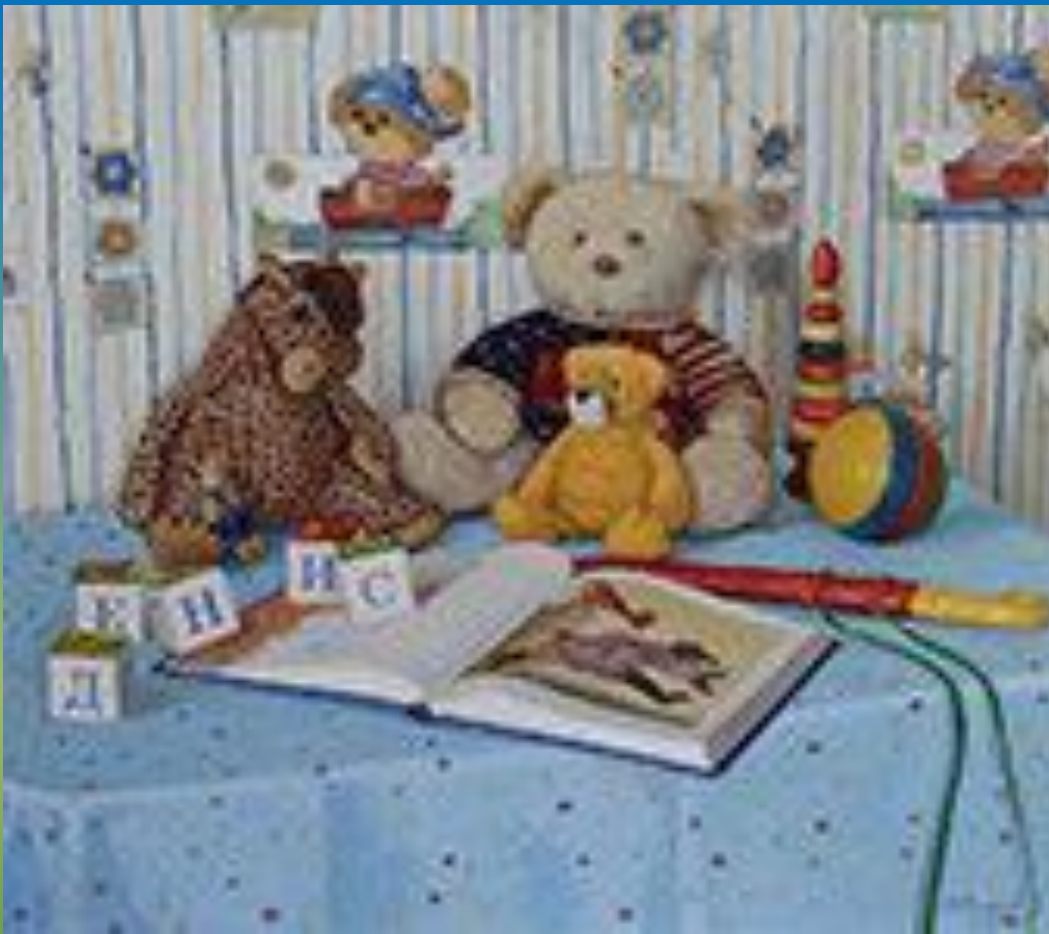
Картина. Натюрморт. Детский мир.