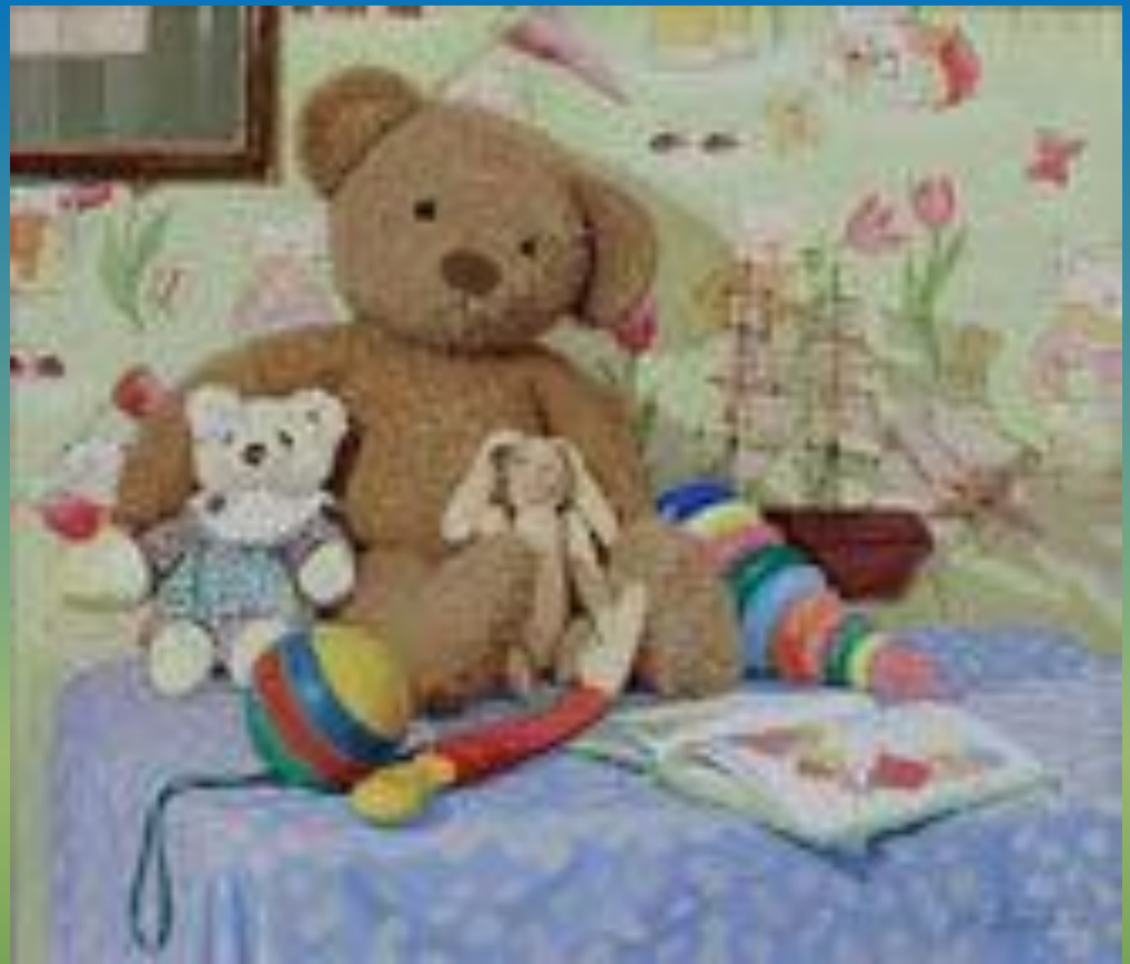
Картина. Натюрморт живопись.