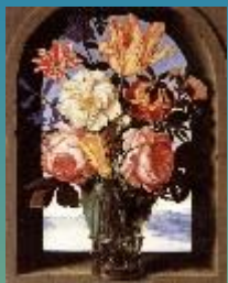
Цветы в стеклянной вазе