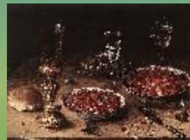
Натюрморт с вишнями и земляникой в китайских блюдах. 1608