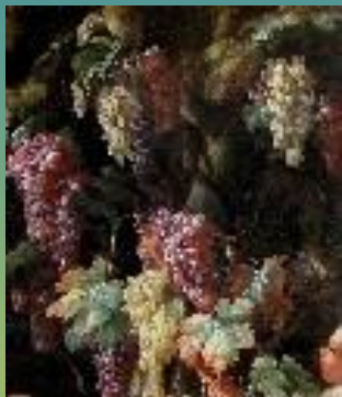
Натюрморт с виноградной лозой