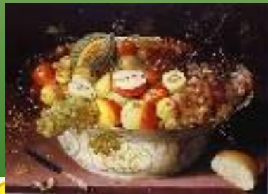
Натюрморт с фруктами в китайской вазе. 1604