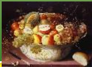
Натюрморт с фруктами в китайской вазе. 1604