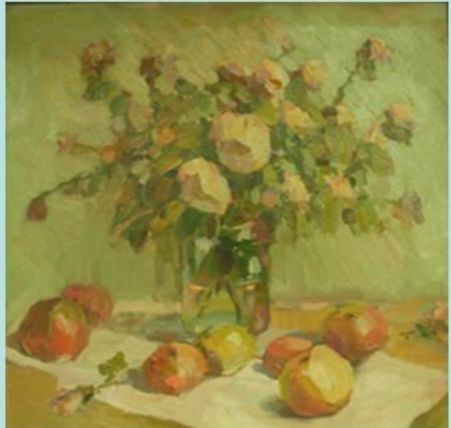
О.Д. Картавцева «Цветы и плоды»