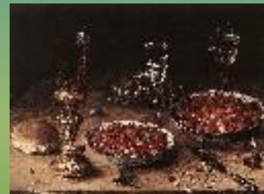
Натюрморт с вишнями и земляникой в китайских блюдах. 1608