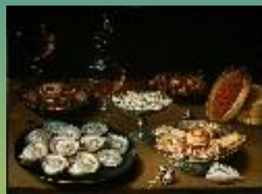
Натюрморт с вишнями и земляникой в китайских блюдах. 1608