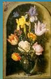
Цветы в стеклянной вазе, 1621