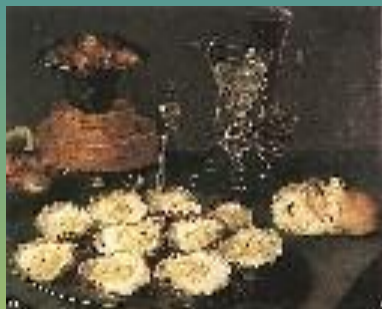
Натюрморт с устрицами и фужерами. 1608