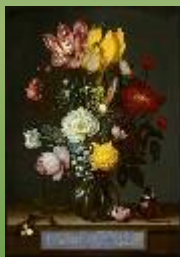
Цветы в стеклянной вазе, 1619