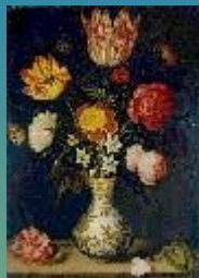
Цветы в китайской вазе, 1619