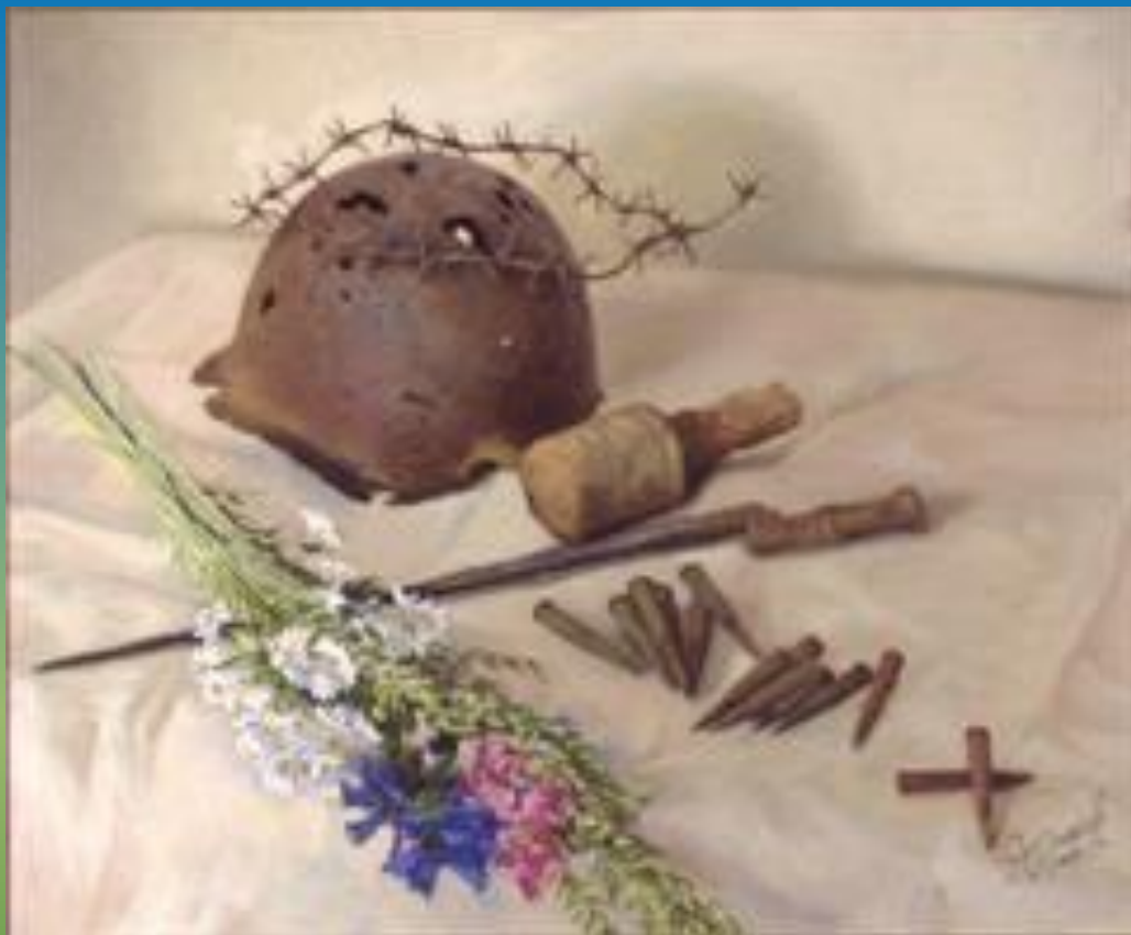
Картина. Натюрморт. Памяти солдата.