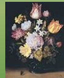
Цветы в вазе, 1614