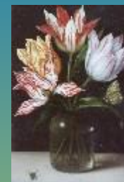
Тюльпаны в банке, 1615