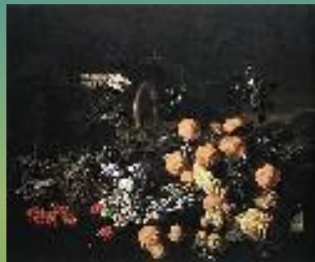
Натюрморт в ландшафте