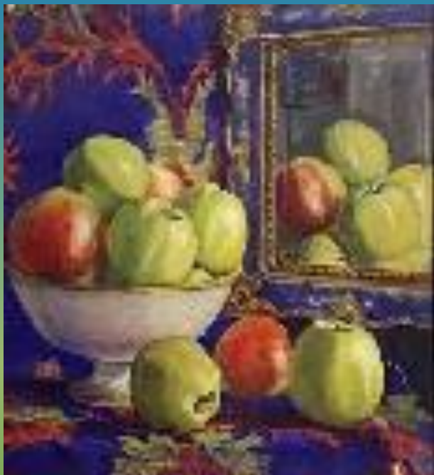
Н. Шереметевская. Натюрморт с яблоками. 1903