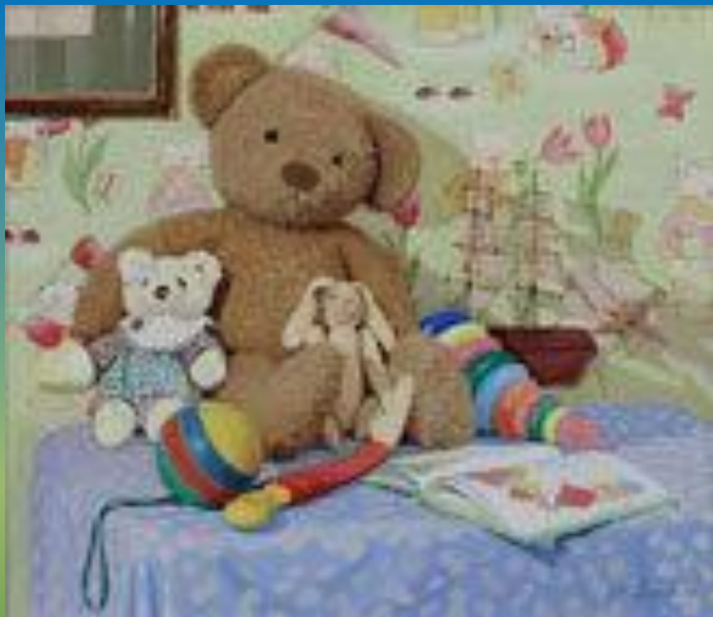
Картина. Натюрморт живопись.