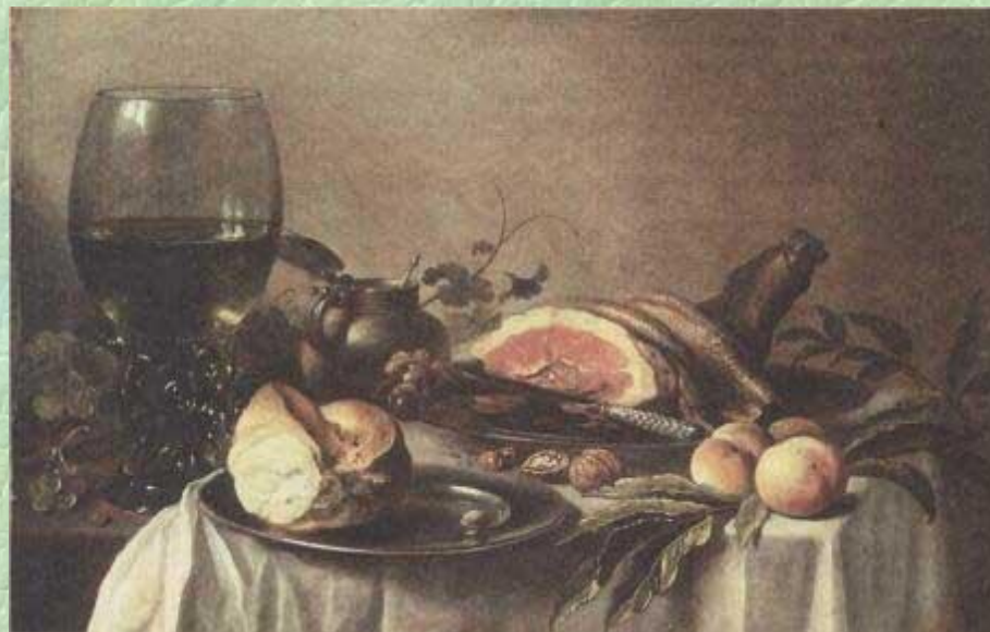
Питер Клас. Завтрак с ветчиной.

Голландский натюрморт XVII в. поражает богатством тем. В каждом художественном центре страны живописцы предпочитали свои композиции: в Утрехте — из цветов и плодов, в Гааге — из рыбы. В Харлеме писали скромные завтраки, в Амстердаме — роскошные десерты, а в университетском Лейдене — книги и другие предметы для занятий науками или традиционные символы мирской суеты — череп, свечу, песочные часы.