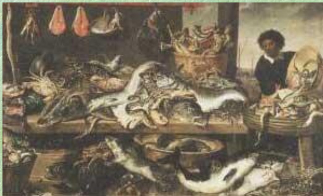
Франс Снейдерс. Фламандская школа. Рыбная лавка.

Его расцвет начался в Голландии, где Реформация, запретив художникам писать картины на религиозные темы, вынудила их искать новые направления.