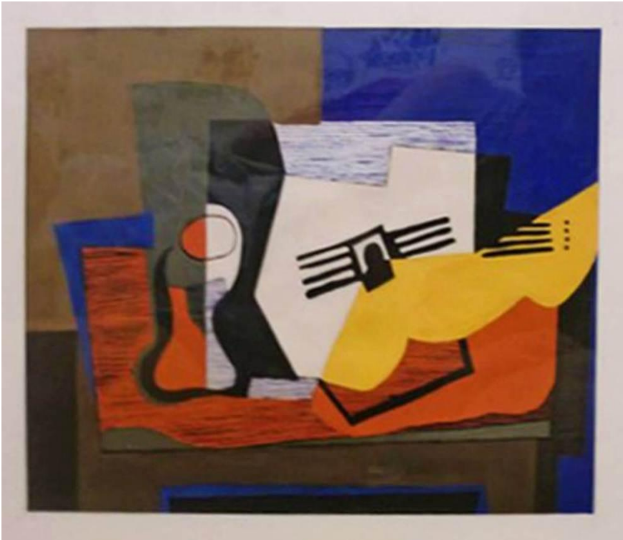
«Натюрморт с гитарой»