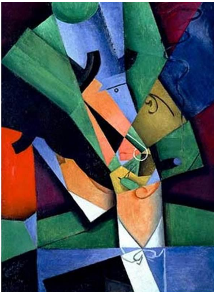
ХУАН ГРИС. КУРИЛЬЩИК . 1913. Музей Тиссен- Борнемиса, Мадрид.