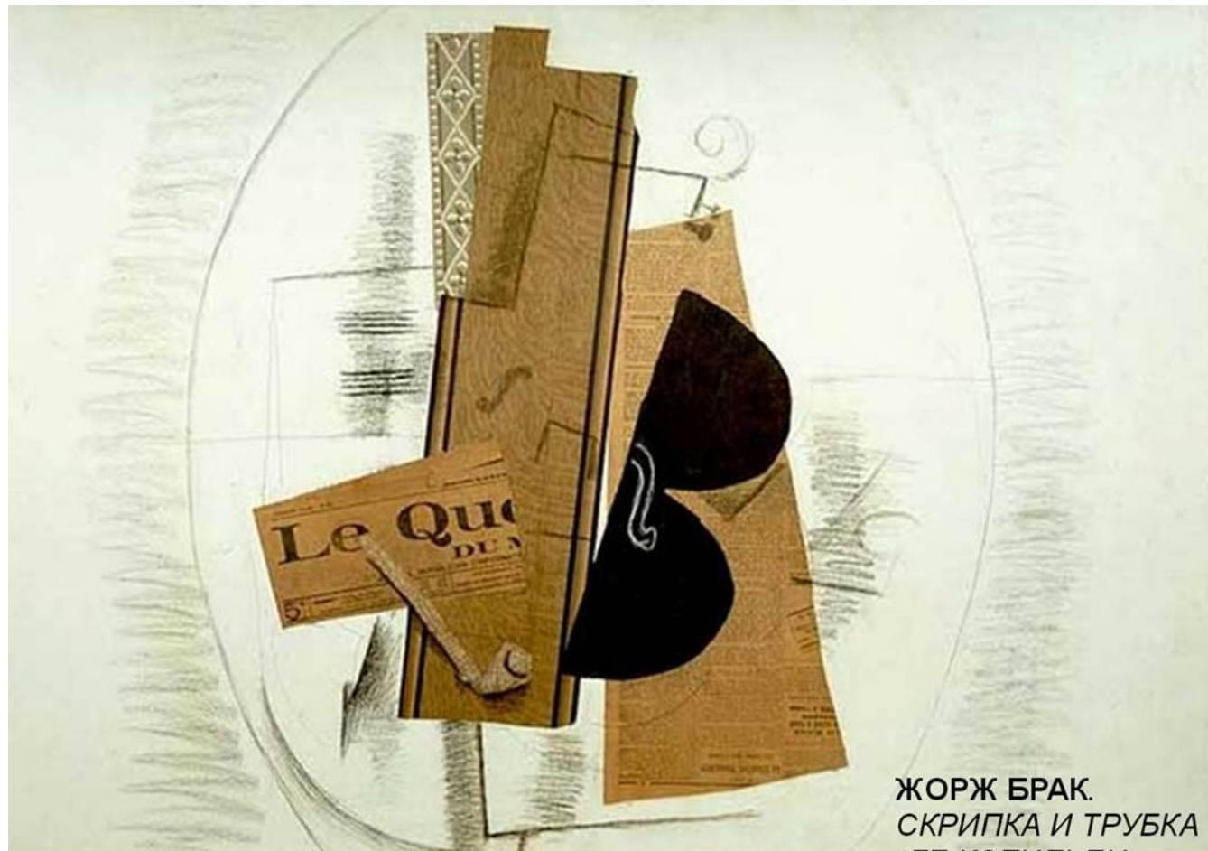
ЖОРЖ БРАК. СКРИПКА И ТРУБКА (ЛЕ КОТИДЬЕН)