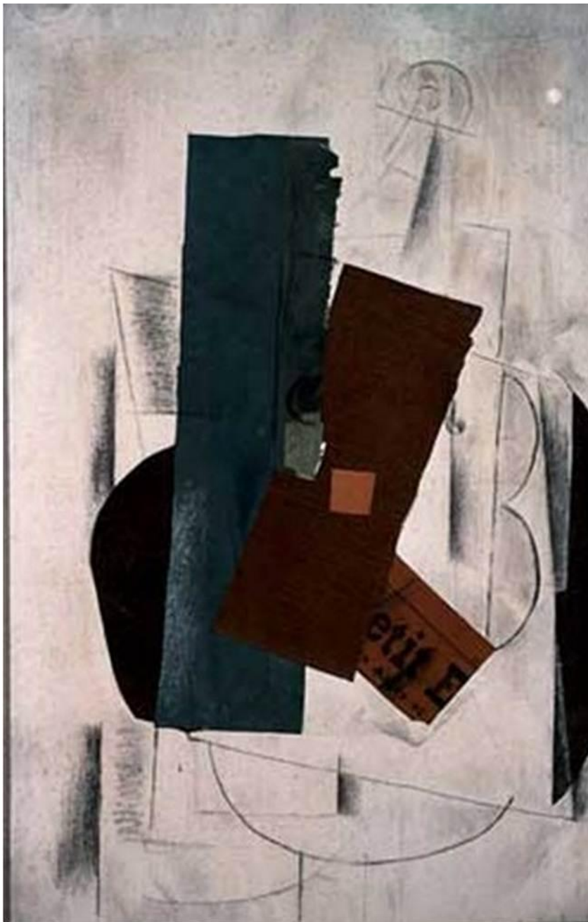
ЖОРЖ БРАК СКРИПКА И ГАЗЕТА