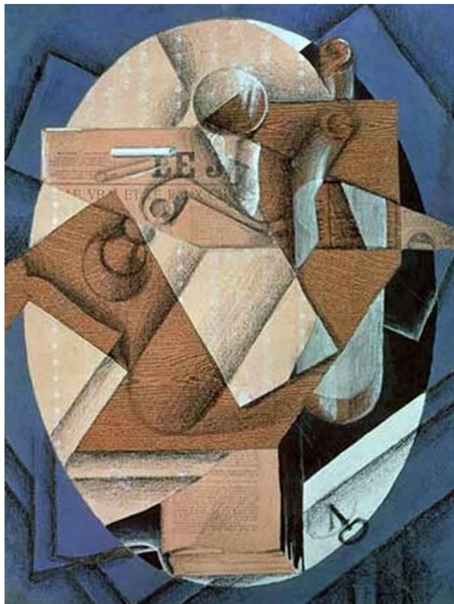
ХУАН ГРИС. НАТЮРМОРТ . Коллаж. Музей искусства, Филадельфия.