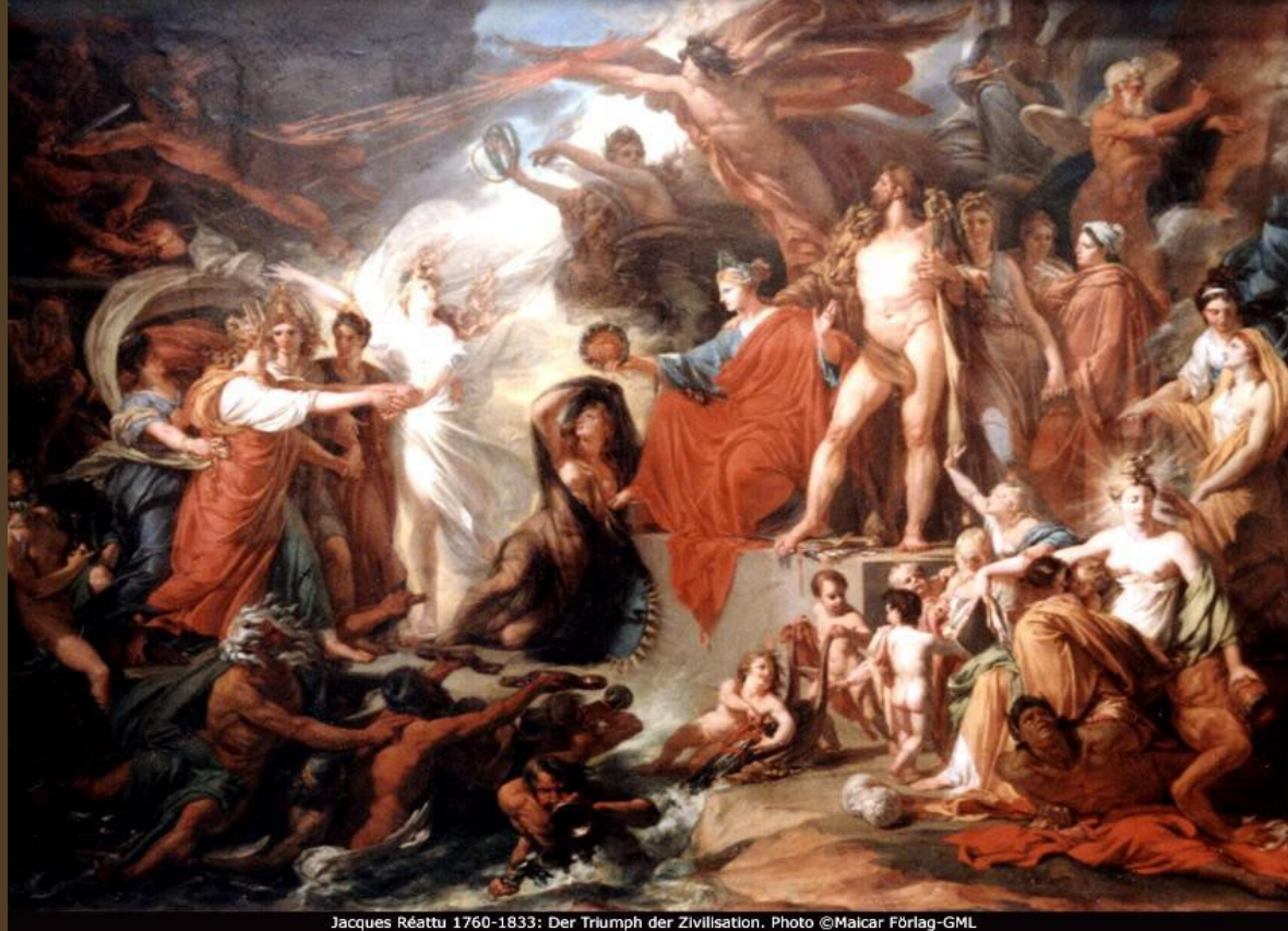
Jacques Réattu 1760-1833: Der Triumph der Zivilisation.

Северное Возрождение – эпоха развития культуры середины шестнадцатого столетия в Германии, Франции, Швейцарии, Северной Фландрии и Нидерландах. Главной особенностью этого периода является генетическое наследование искусству поздней готики.