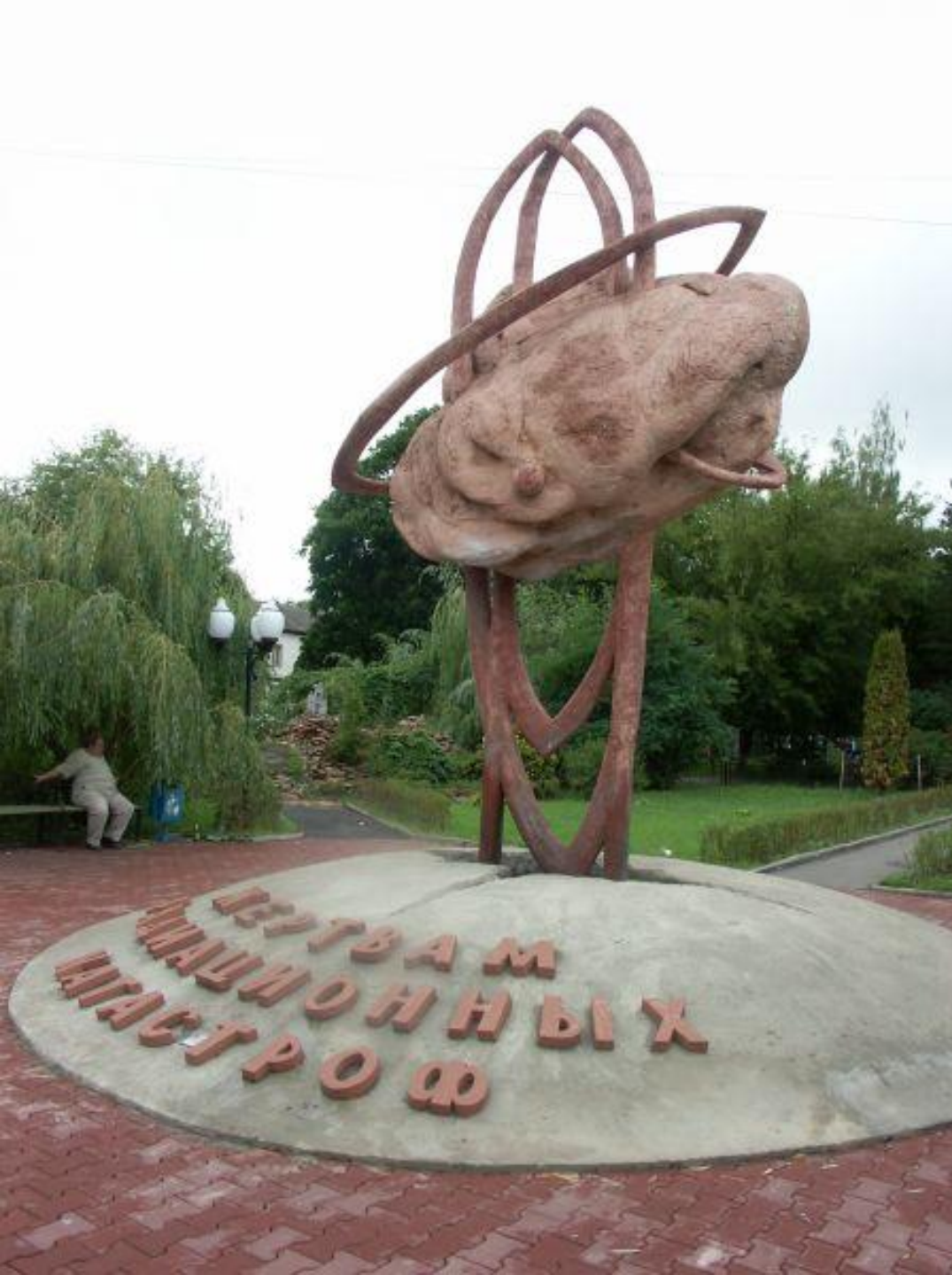
Памятник жертвам радиации в Орле.