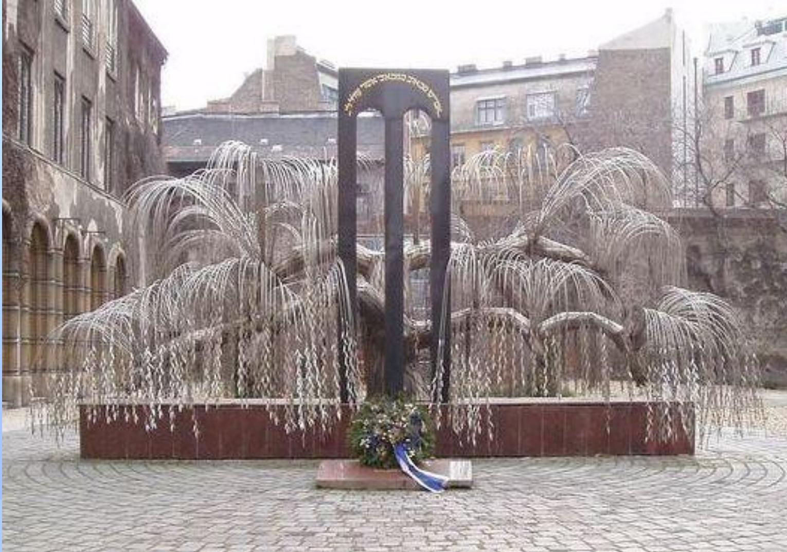
Памятник жертвам холокоста в Будапеште. На каждом листочке написано имя жертвы.