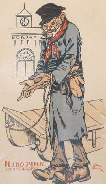
Извозчик (сов лошадак)