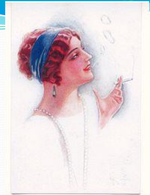
Женская мода времён НЭПа

Новых богачей мало интересовало классическое искусство — для его понимания у них не хватало образования. Они устанавливали свою моду .