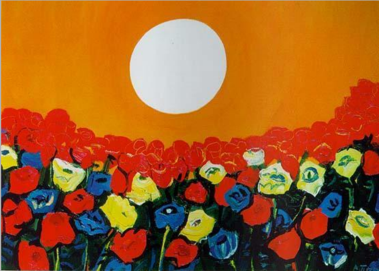
Краски жизни. Цветы и солнце