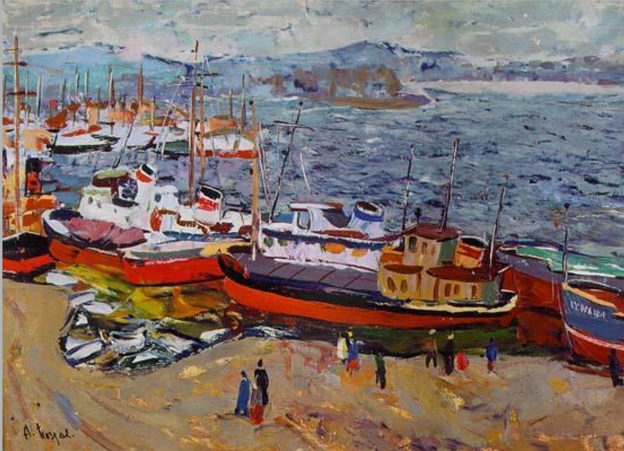
Весна на Енисее.