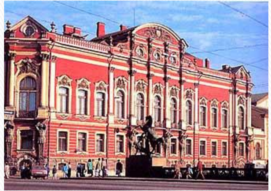
Дворец Белосельских- Белозёрских