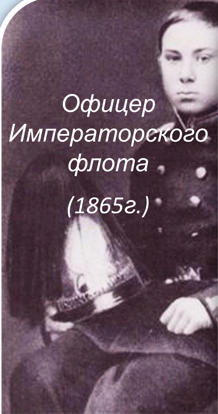
Офицер Императорского флота (1865г.)