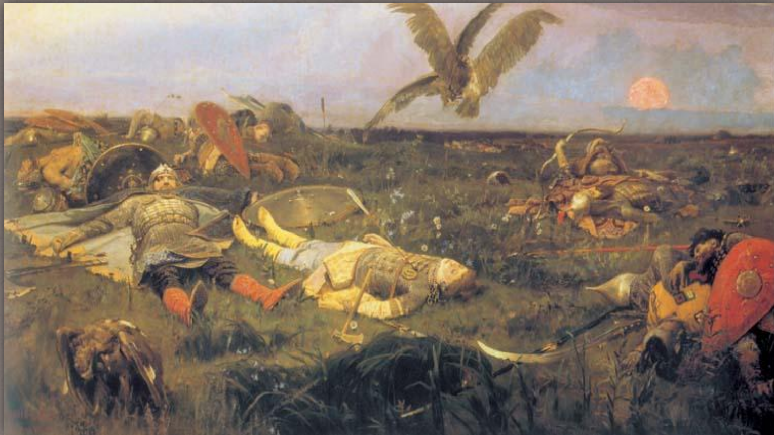
В.Васнецов «После побоища Игоря Святославовича с половцами». 1880