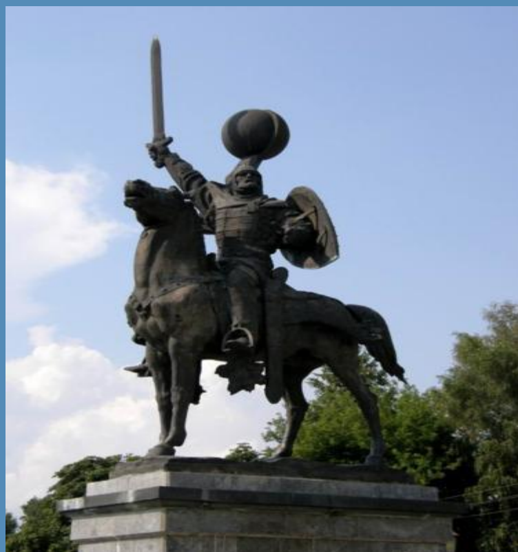
Новгород-Северский. Памятник Князю Игорю