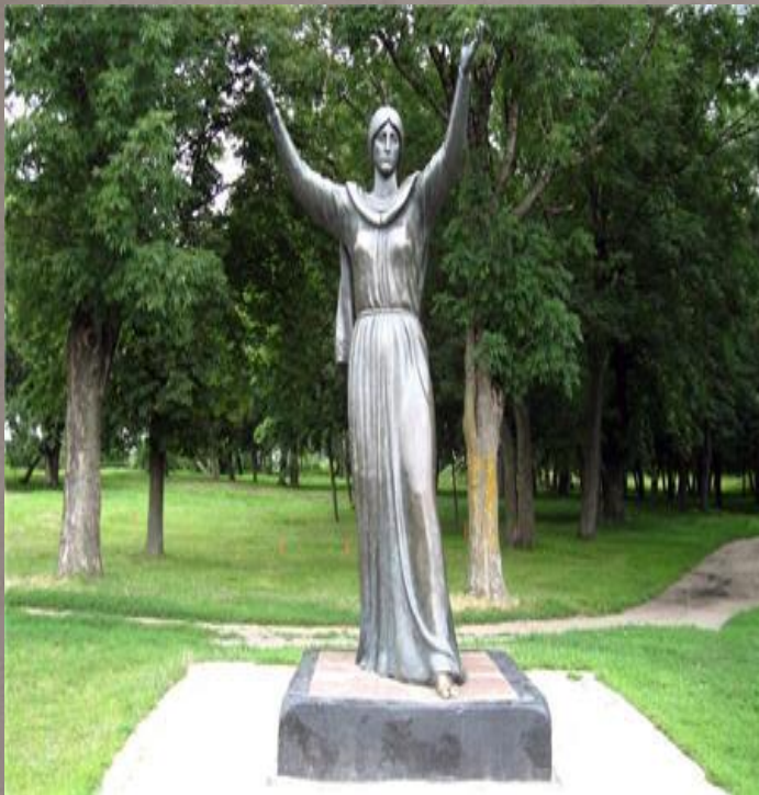
Путивль. Памятник Ярославне