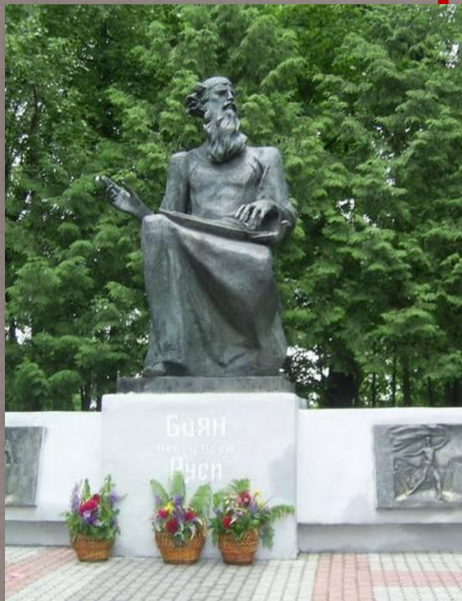
Памятник Бояну — ключевая фигура композиции в честь 1000-летия города Трубчевска