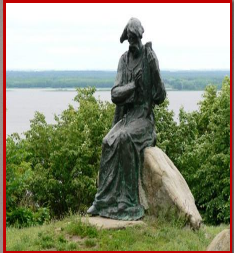
Киевская область, с. Балыко- Щучинка. Памятник Бояну.