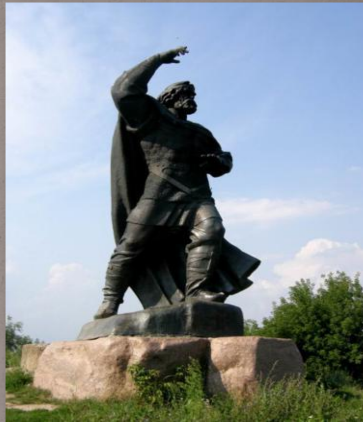
Новгород-Северский. Памятник Бояну