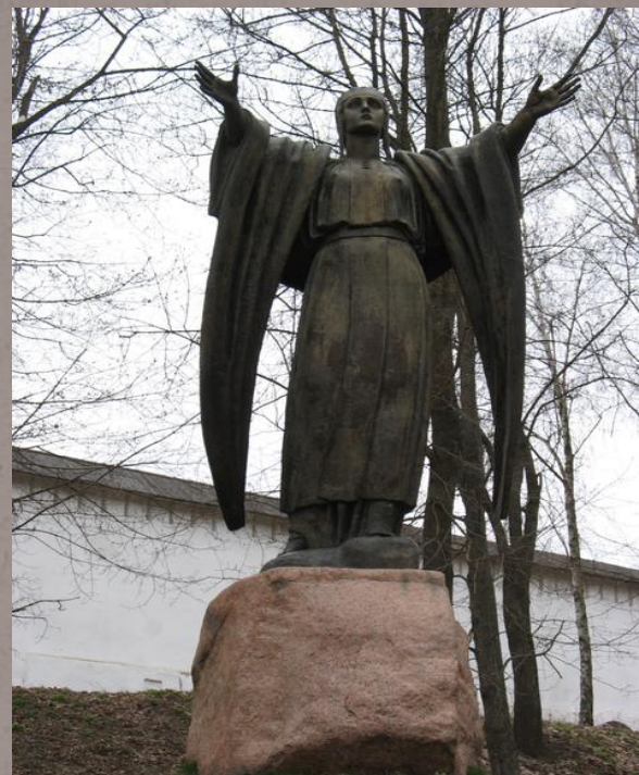
Новгород-Северский. Памятник Ярославне