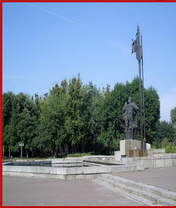
Черкассы. Памятник Бояну.