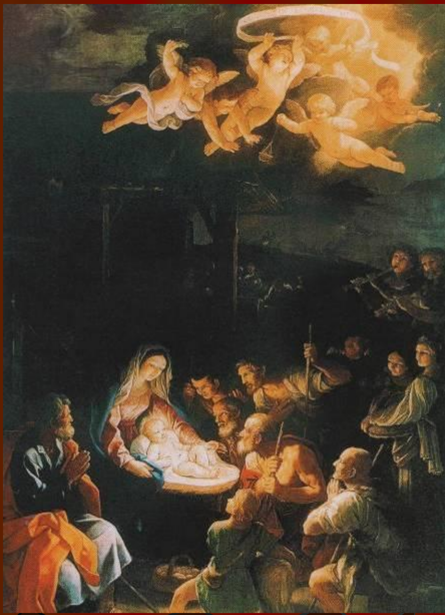
Гвидо Рени. Поклонение пастухов. Около 1640