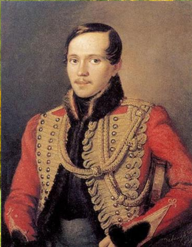
П. Е. Заболотский. Портрет М. Ю. Лермонтова

Как Лермонтов связан с образом Демона? Почему появляется в творчестве поэта этот образ?