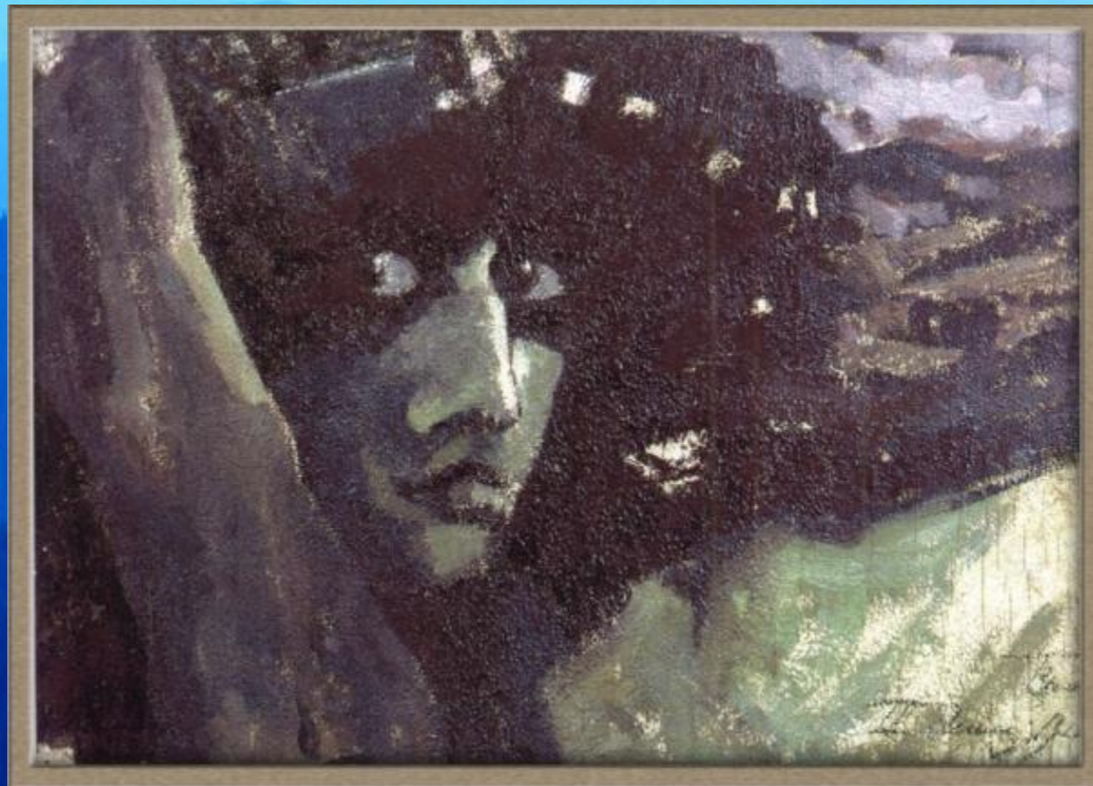
М. Врубель. Голова Демона на фоне гор.