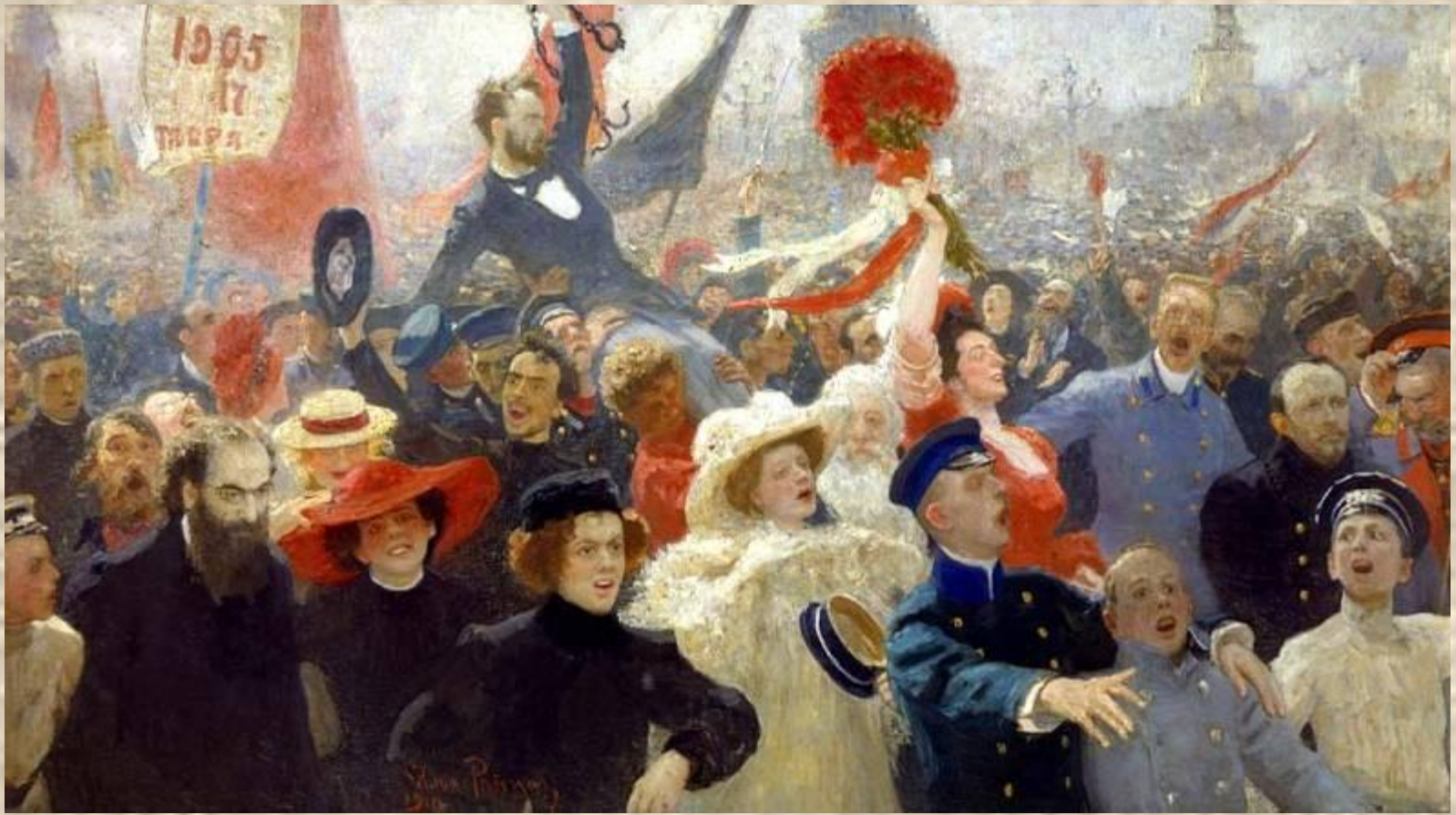
И.Репин. «17 октября 1905 года»