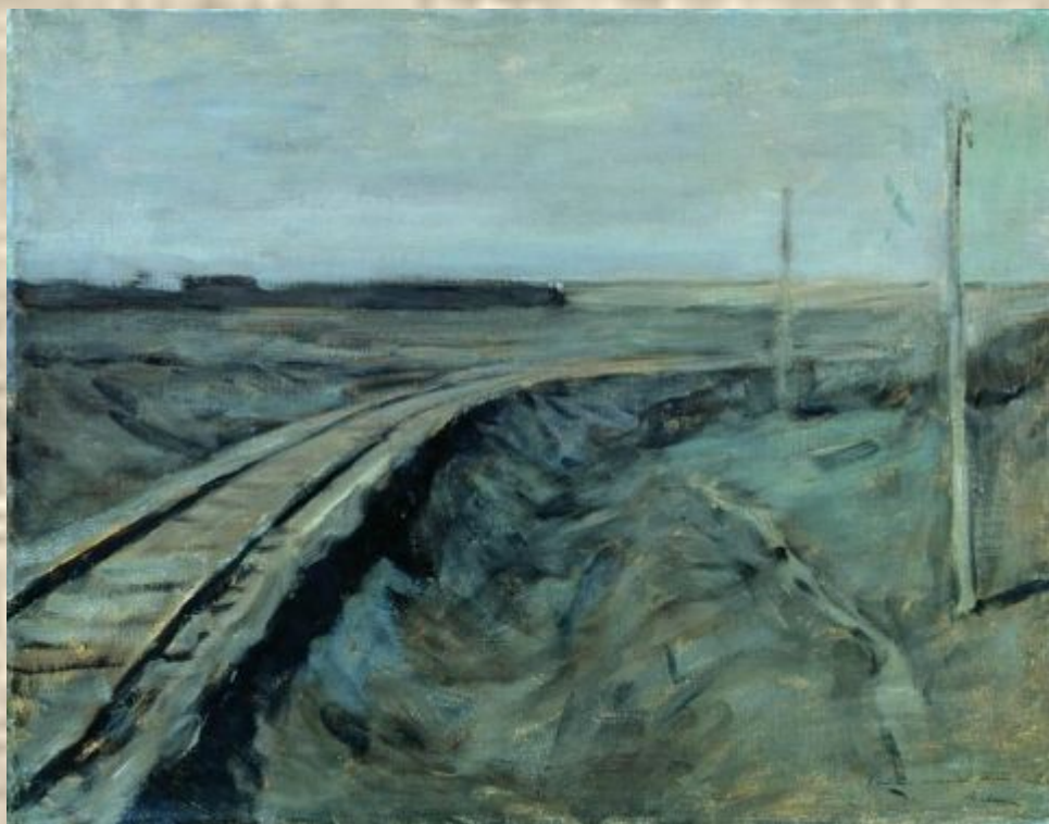
И. Левитан. Полотно железной дороги. 1898-1899,