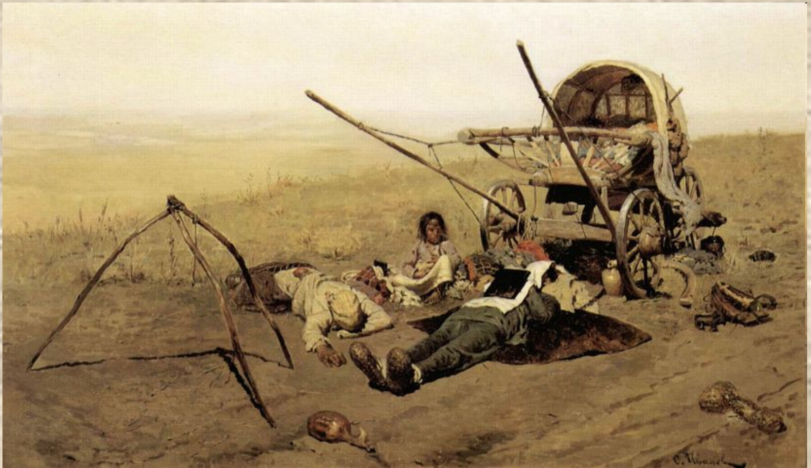
С.Иванов. Смерть переселенца.