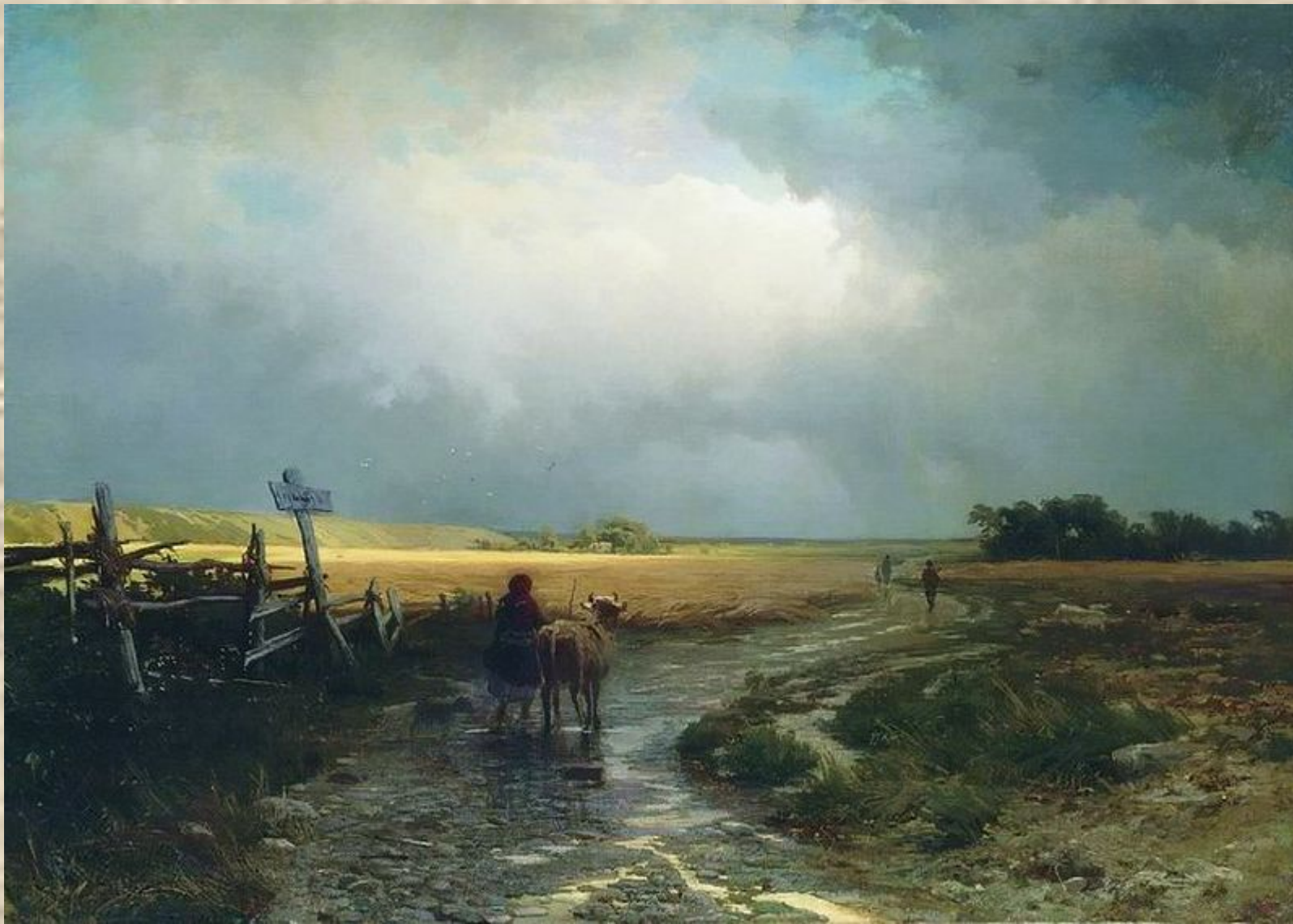
Васильев. После дождя. Просёлок. 1867-1869