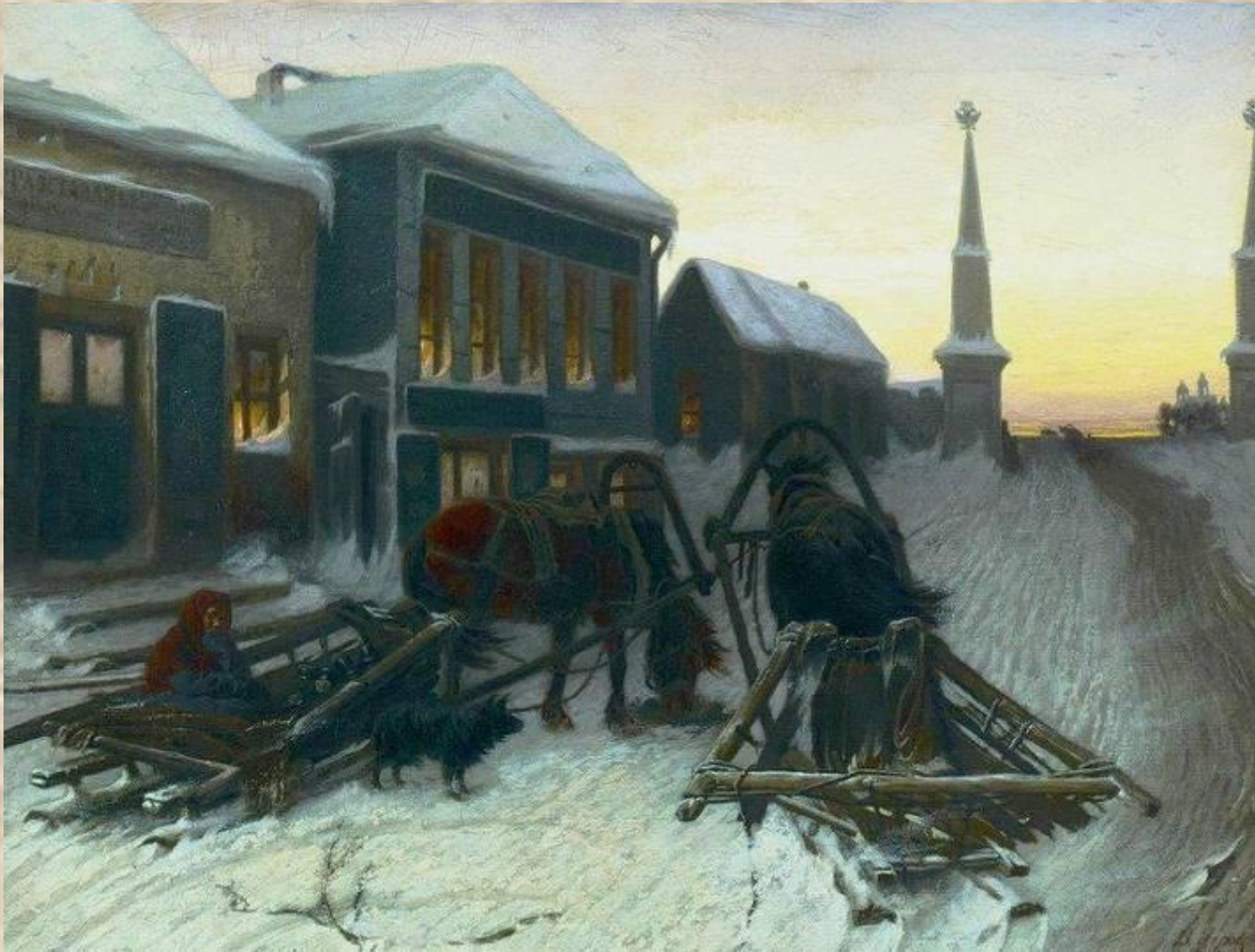
В. Перов. Последний кабак у заставы.