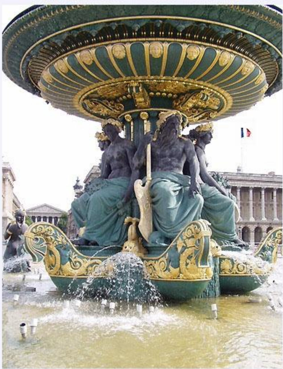
Архитектор Гитторф. Фонтан французских рек