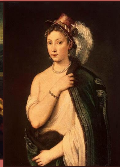
Тициан. Портрет молодой женщины