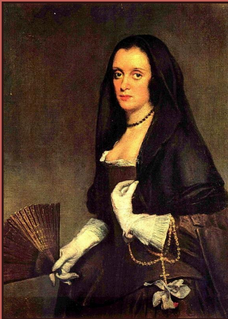
Веласкес. Портрет дамы с веером.

Вот откуда бесконечная вереница Мадонн, постепенно превращающихся просто в портреты молодых женщин эпохи, чья красота приобретает самодовлеющее значение.