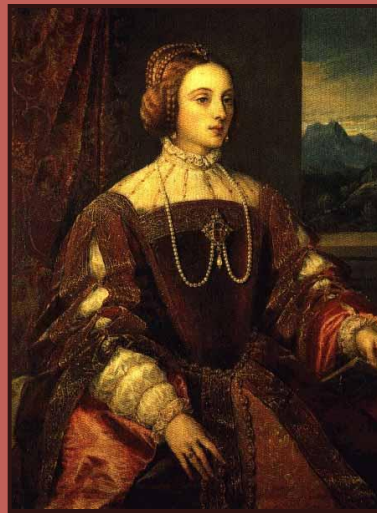
Тициан. Портрет Изабеллой Португальской