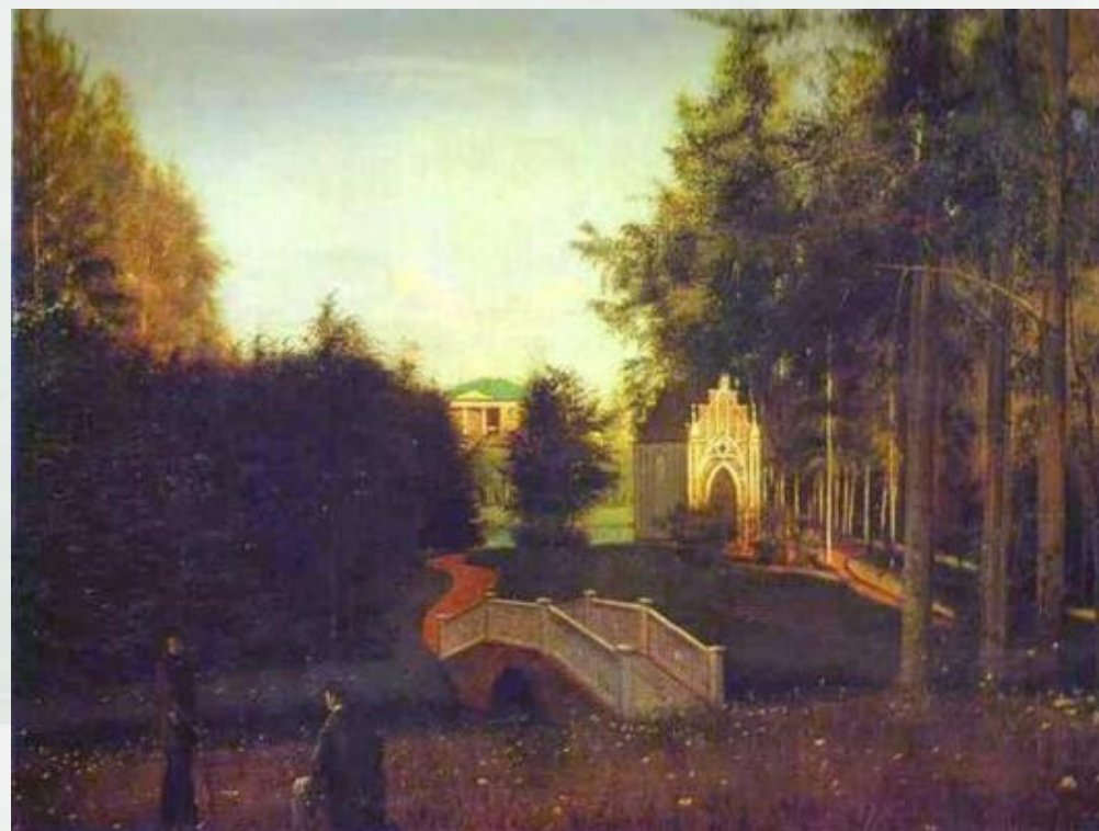
Часовня в парке ~1850г

В 1850-1860-х годах Сорока жил в родной деревне, писал образа для деревенских церквей, пытался следовать примеру Венецианова и учить живописи своих земляков.