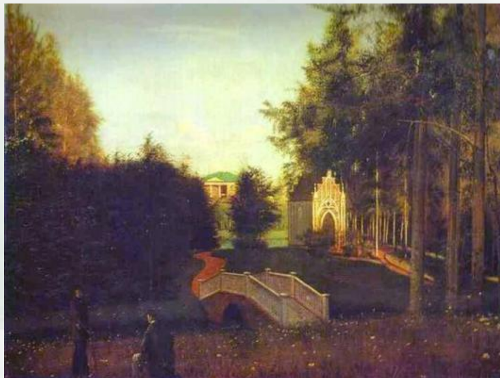
Часовня в парке ~1850г

В 1850-1860-х годах Сорока жил в родной деревне, писал образа для деревенских церквей, пытался следовать примеру Венецианова и учить живописи своих земляков.