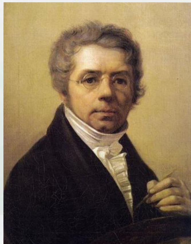
А.Г. Венецианов. Автопортрет