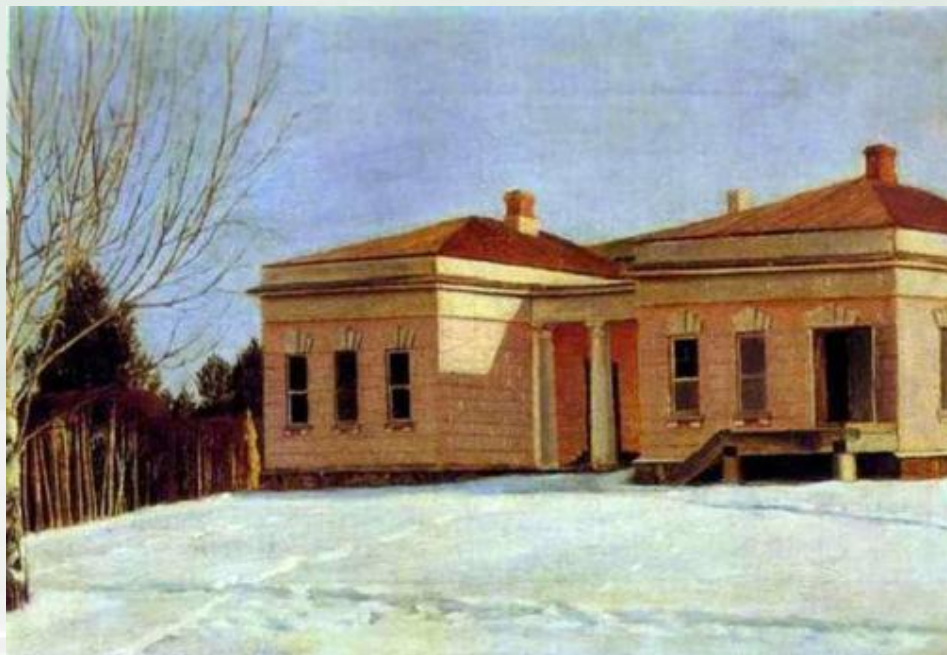
Дом в Островках ~1844г

Творческий путь Сороки продолжался не более десяти лет, и нам достоверно известно лишь около 20 его работ, а датировка их очень приблизительна. Они не равноценны. Наибольших успехов Сорока добился в пейзажной живописи. "Флигель в "Островках"..." (первая половина 1840-х) прямо перекликается с более поздними пейзажами русских художников конца XIX - начала XX в