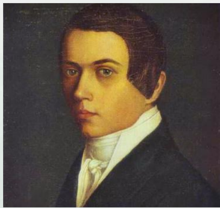
Сорока Григорий Васильевич. Автопортрет 1840г

В 1976 году на открытии выставки, посвященной творчеству Сороки, правнуки художника передали его в дар Русскому музею.