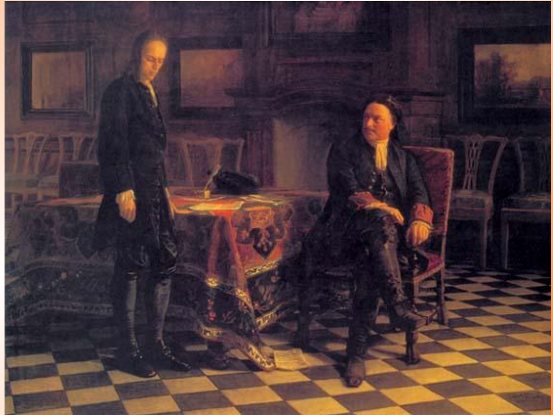
Н.Н.Ге «Петр I допрашивает царевича Алексея в Петергофе»