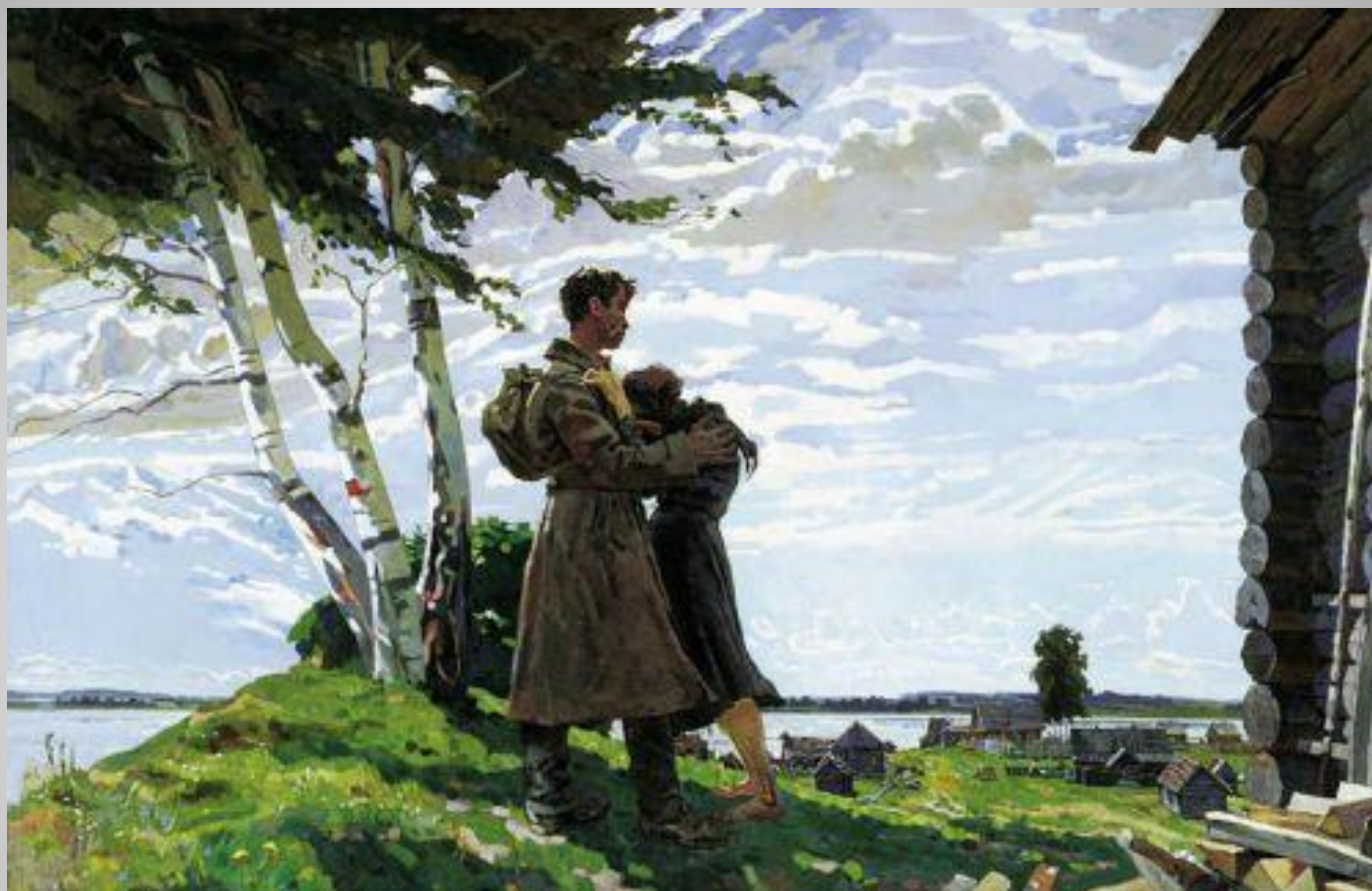
А. Горский «Без вести пропавший»