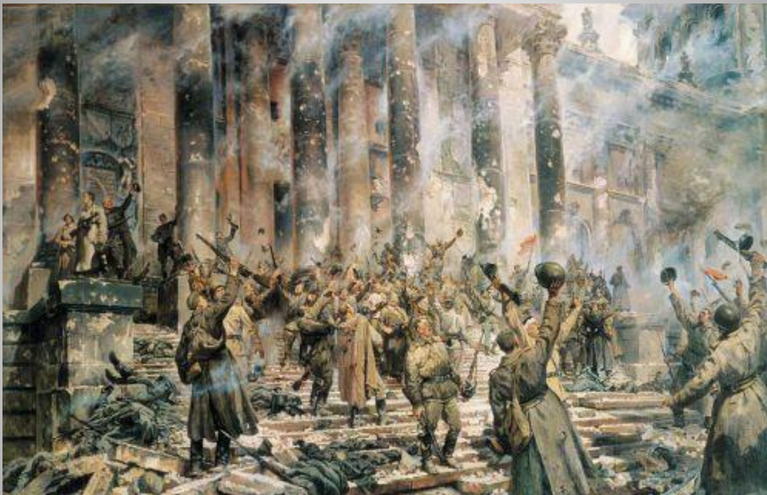
П. Кривоногов «Победа»