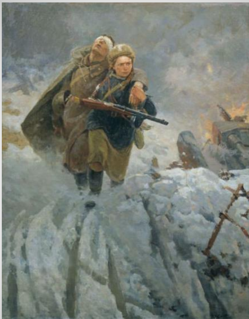
Самеонов М. «Сестрица»»