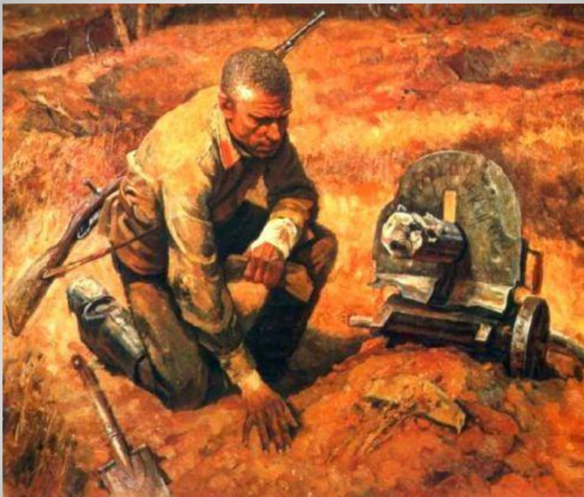
Б. Тарелкин «Товарищи»