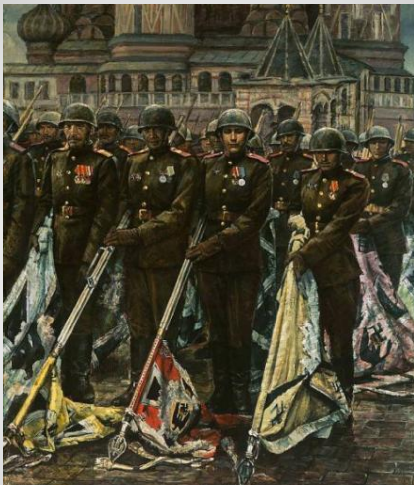
К. Антонов «Победители»