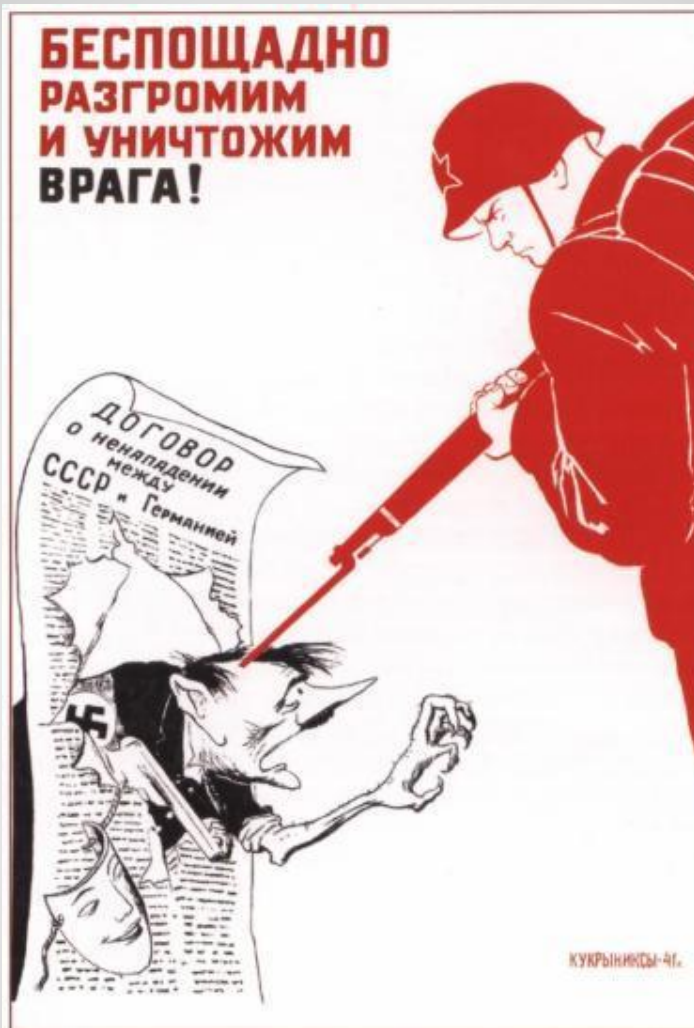
274. Кукрыниксы Беспощадно разгромим и уничтожим врага! 1941