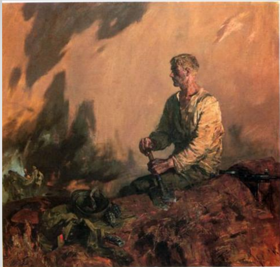
Е. Фетисов «Тишина»