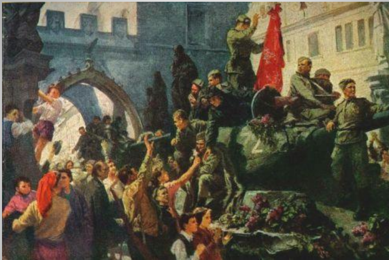
«В освобожденной Праге» Е. Козанов, А. Орловский