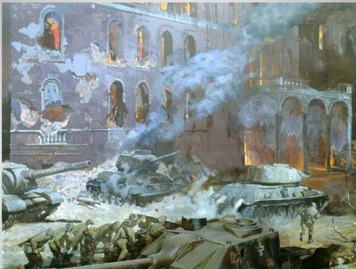
Кривоногов П. «Штурм Берлина»