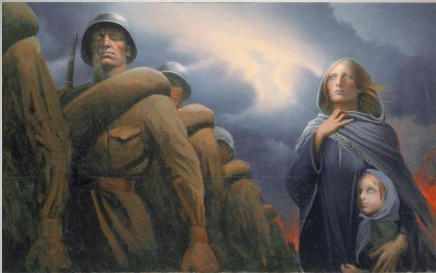
К. Васильев «Прощание славянки»