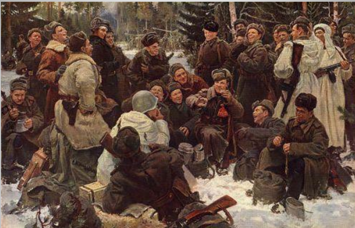
Ю. Непринцев «Отдых после боя»