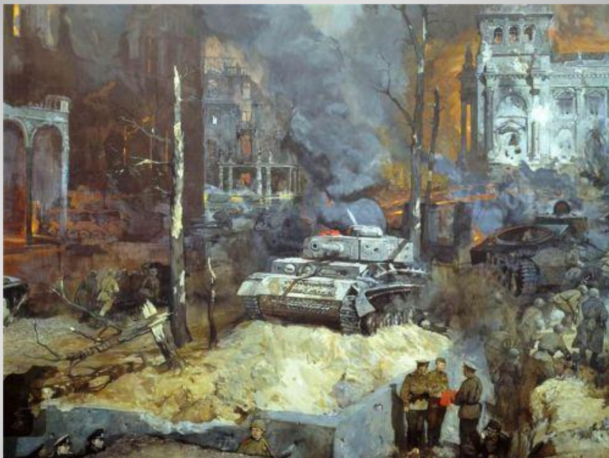
П.А.Кривоногов «Штурм Берлина»