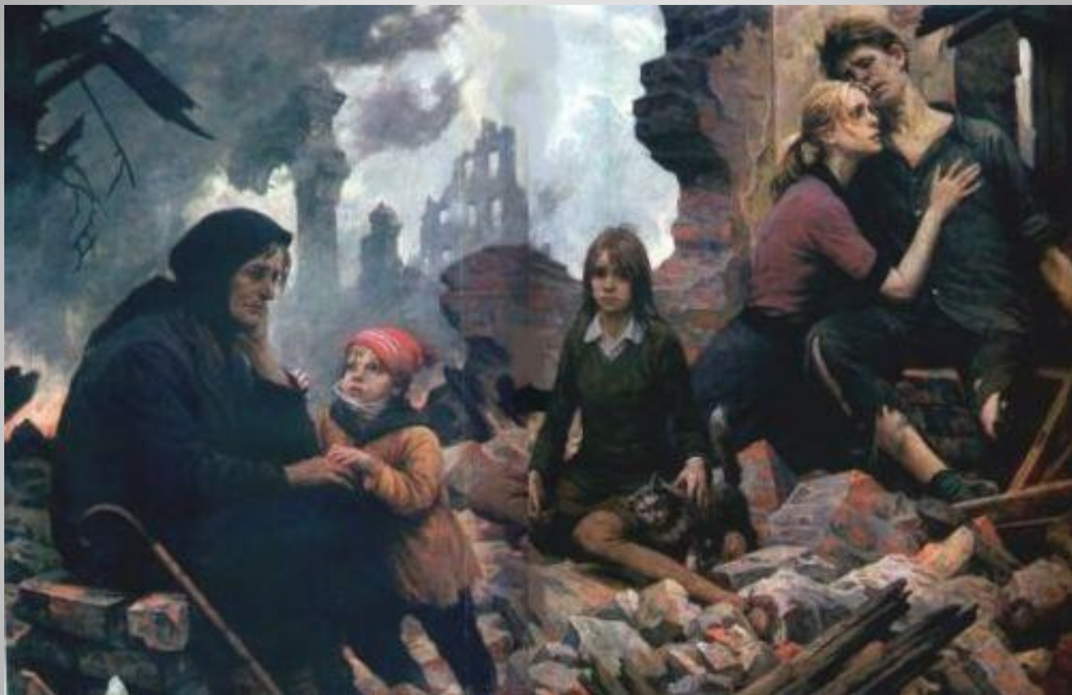
В. Щербаков «Зло мира»