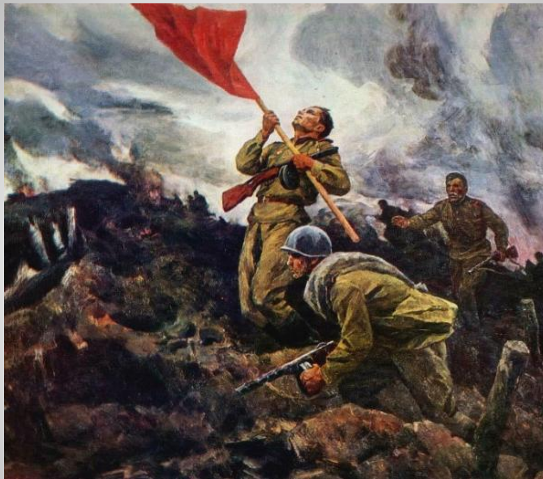
А. Широков «За Родину»