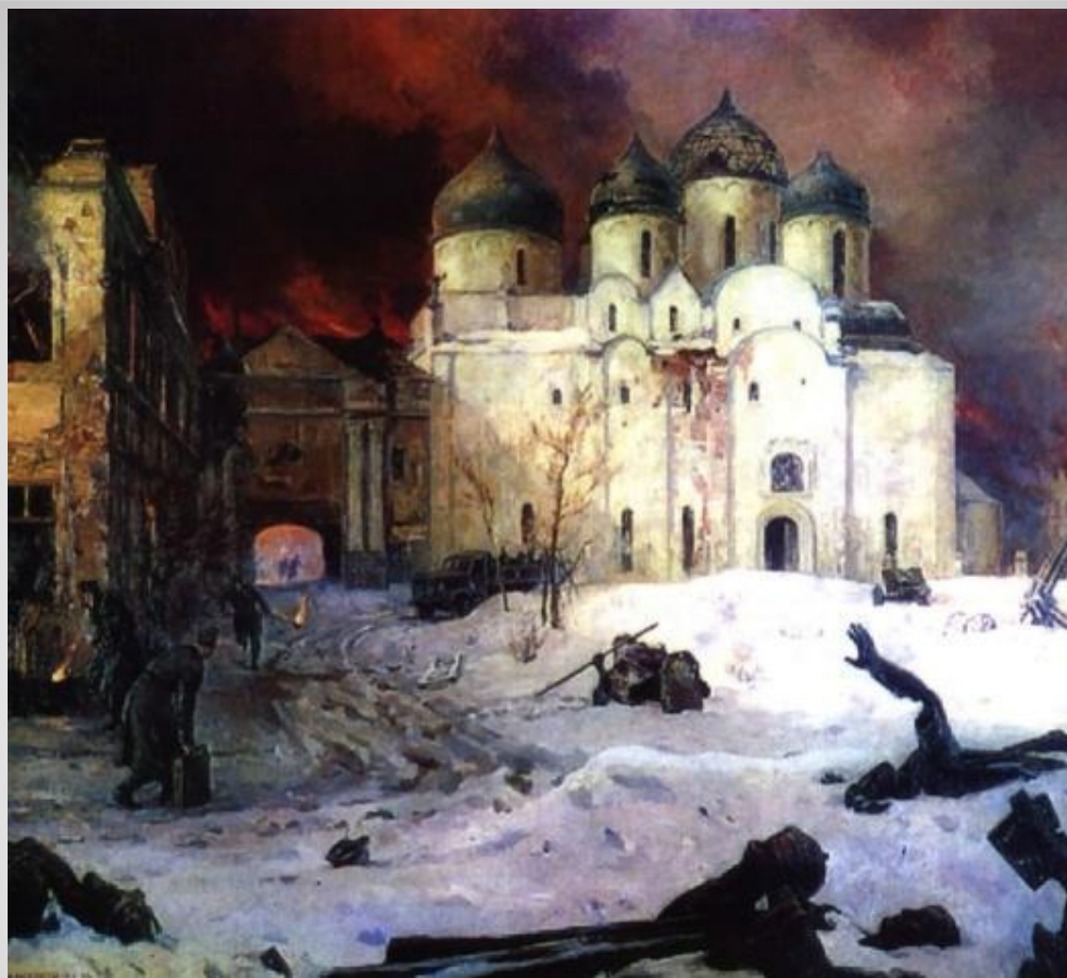
Максим Ксута «Бегство фашистов из Новгорода»