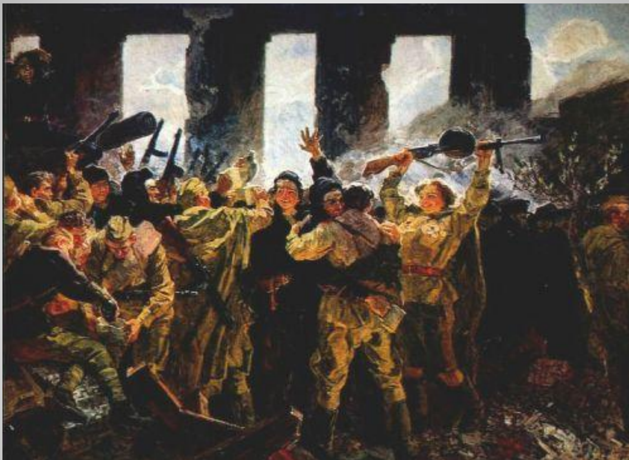
М. Лопухов «Победа»