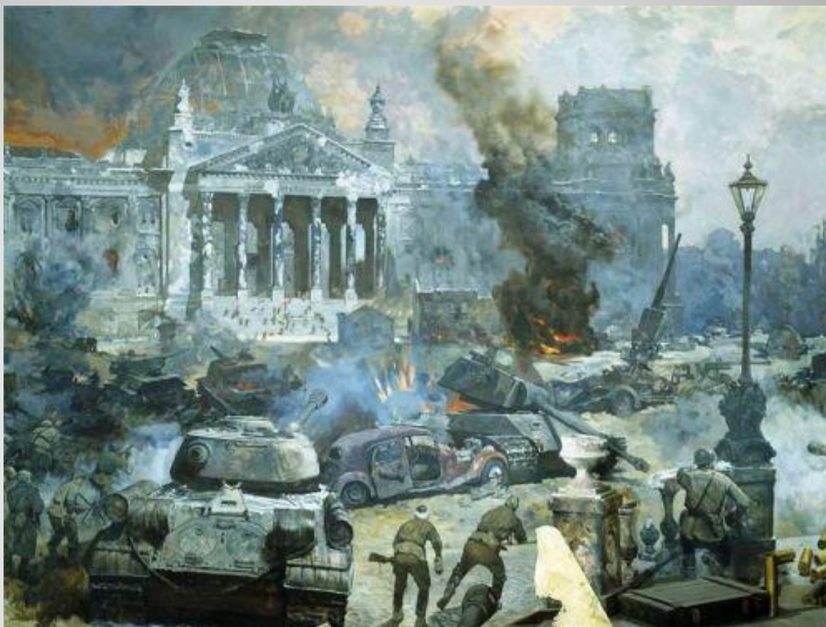
П. Кривоногов «Рейхстаг взят»