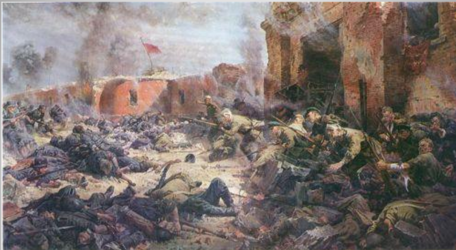
П.А. Кривоногов «Защитники Брестской крепости»