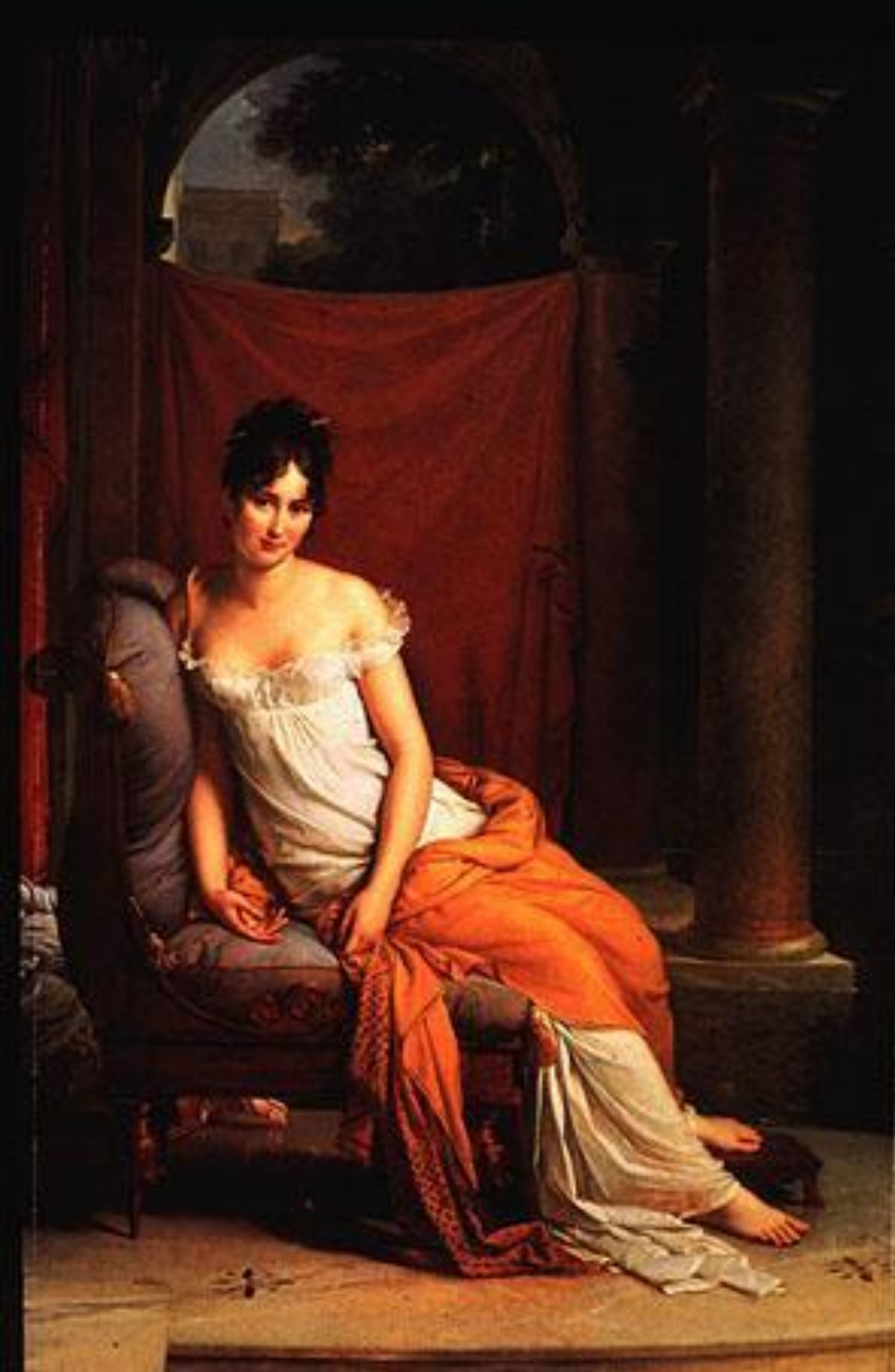
ФРАНСУА ЖЕРАР «МАДАМ РЕКАЛЬЕ»