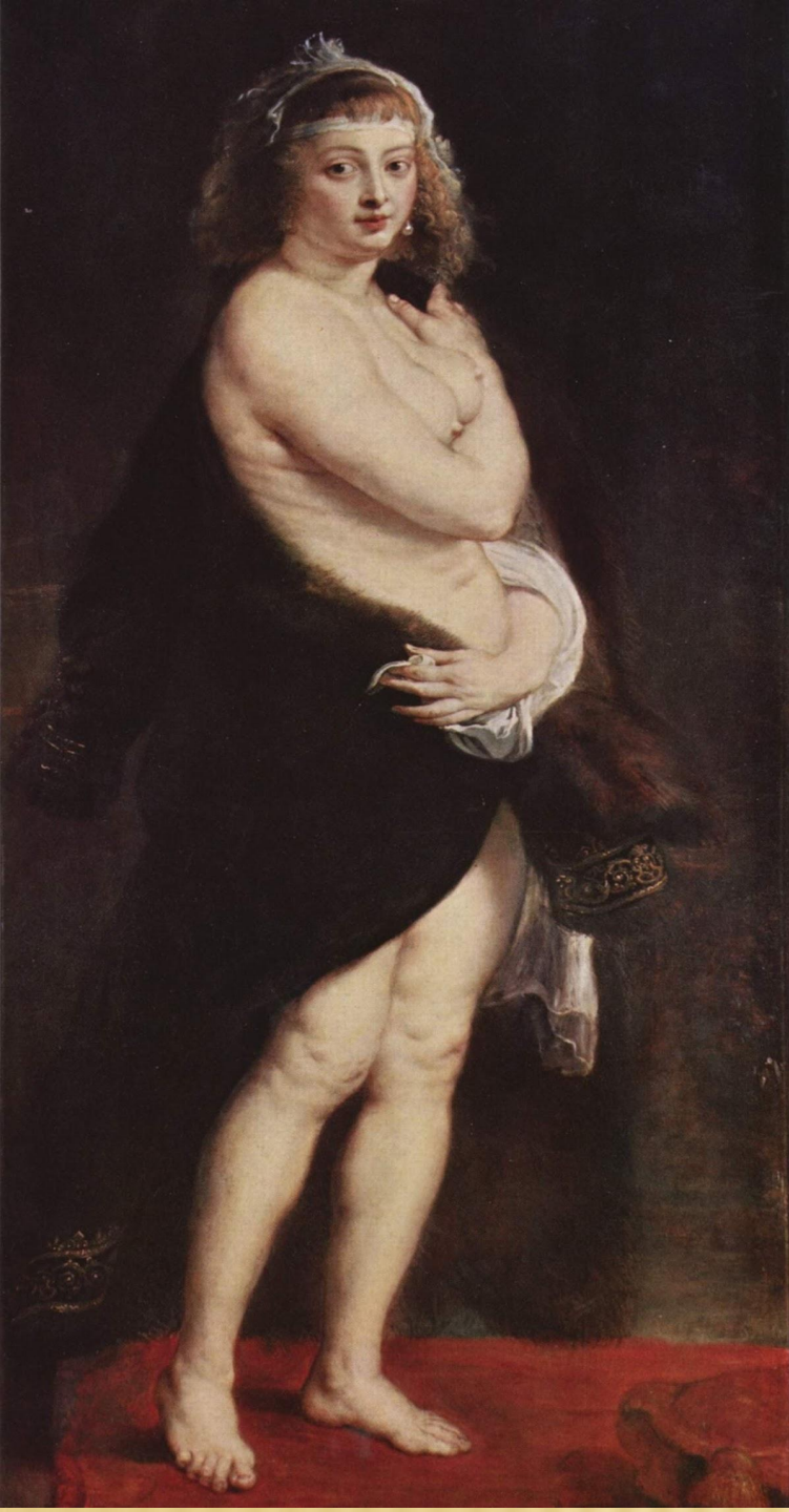
«ШУБКА», 1636 г., П. РУБЕНС