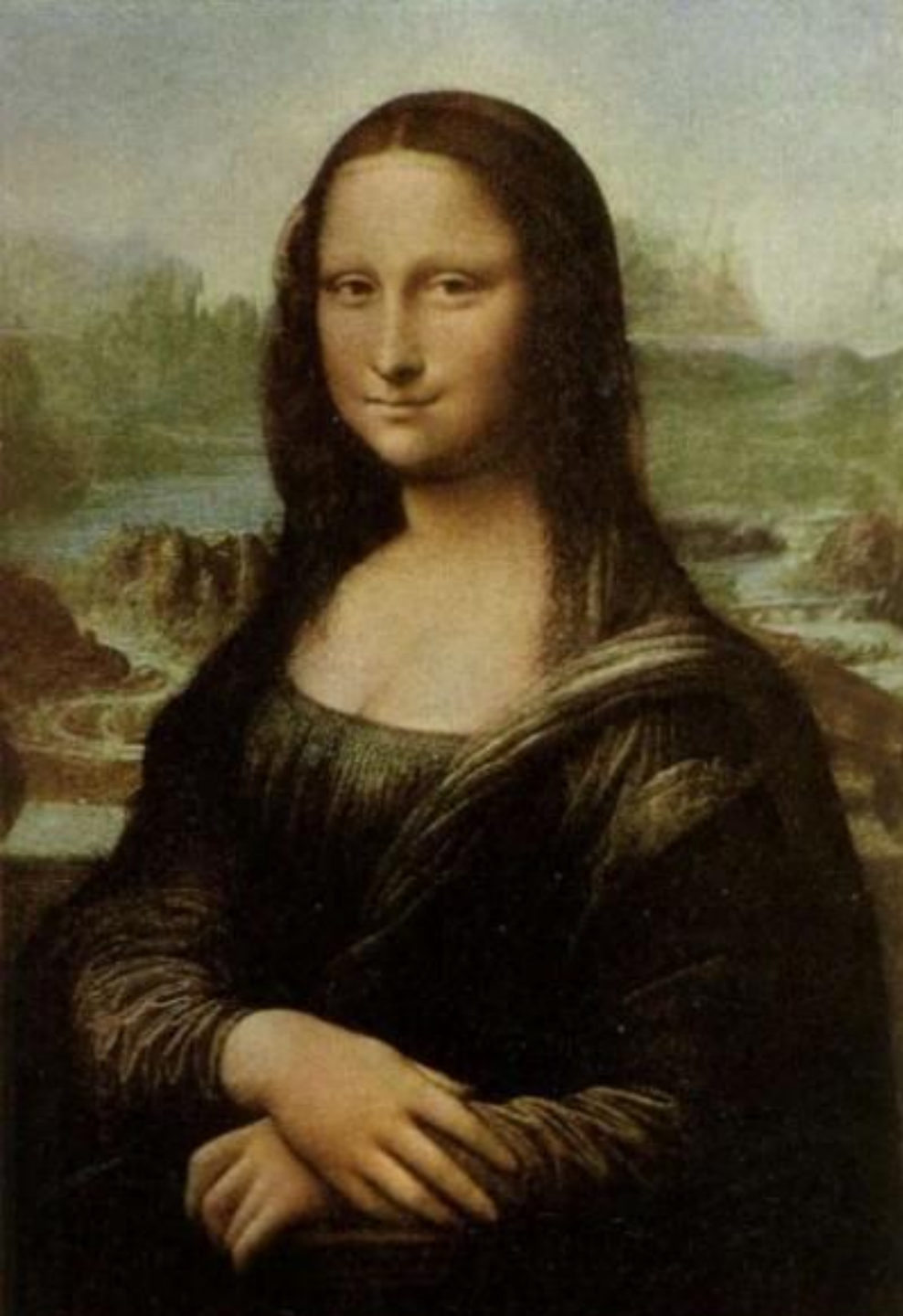
ДЖОКОНДА ЛЕОНАРДО да ВИНЧИ, 1503 г.