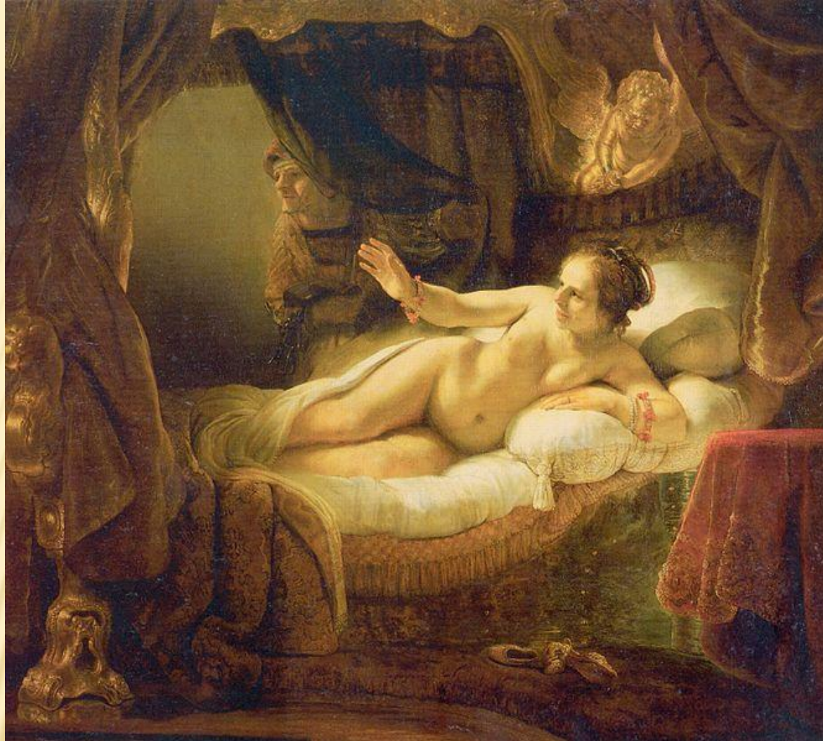
РЕМБРАНДТ «ДАНАЯ», 1636 г.