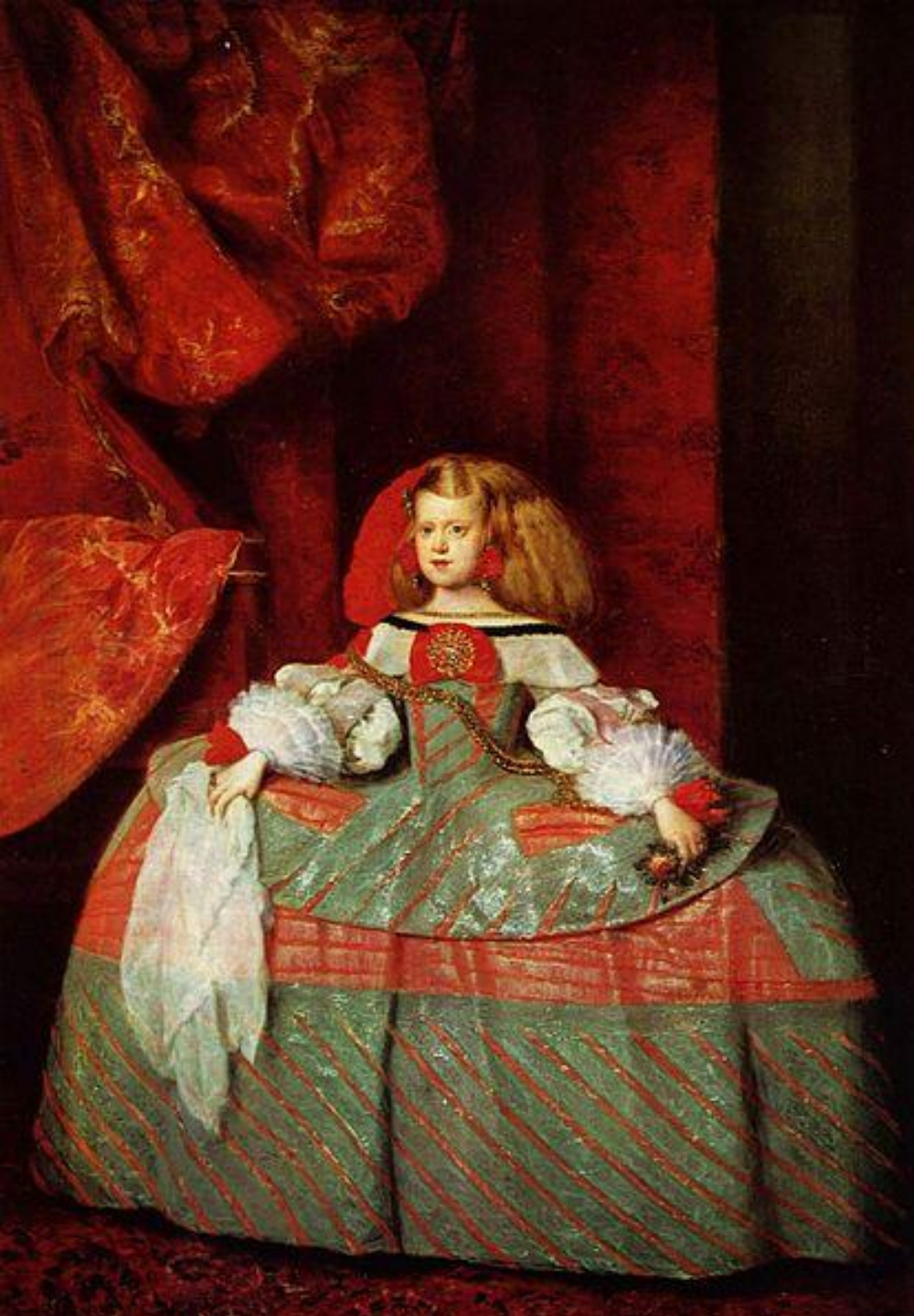
ДИЕГО ВЕЛАСКЕС «ИНФАНТА МАРГАРИТА АВСТРИЙСКАЯ», 1660 г.