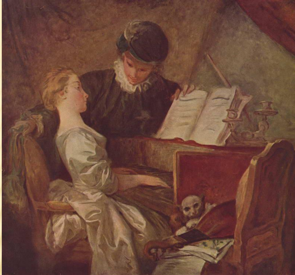
«УРОК МУЗЫКИ», ФРАГОНАР