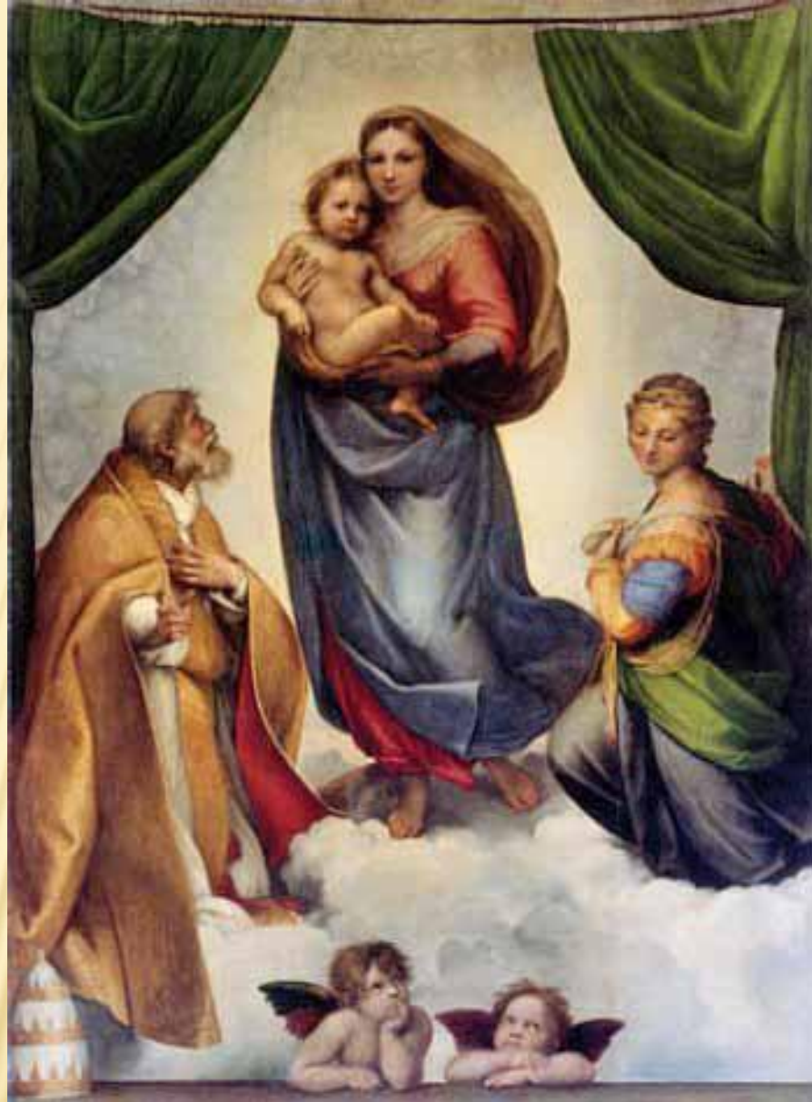
СИКСТИНСКАЯ МАДОННА, РАФАЭЛЬ, 1512 г.