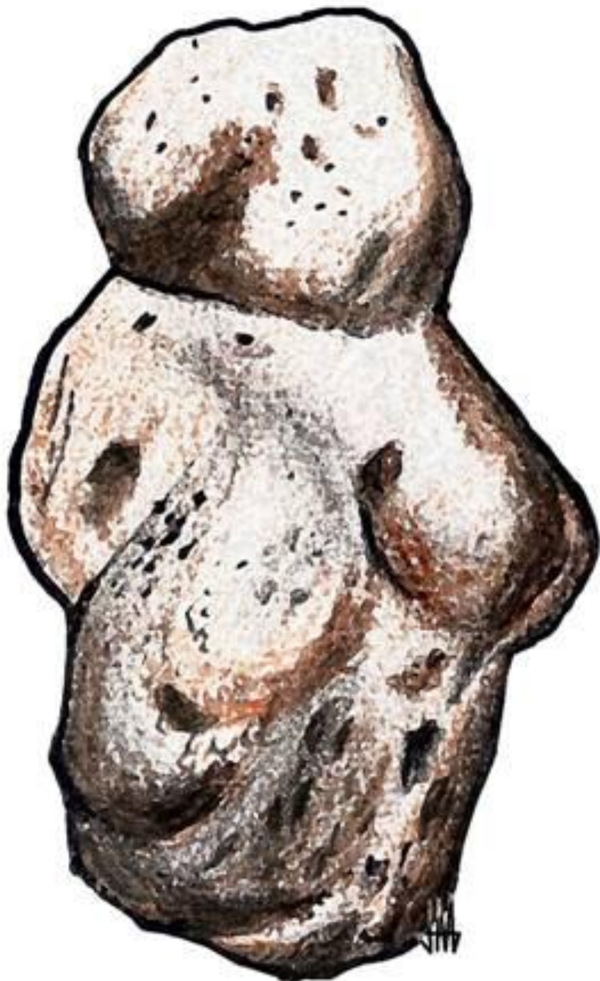
ВЕНЕРА ИЗ БРЕХАТ-РОМА