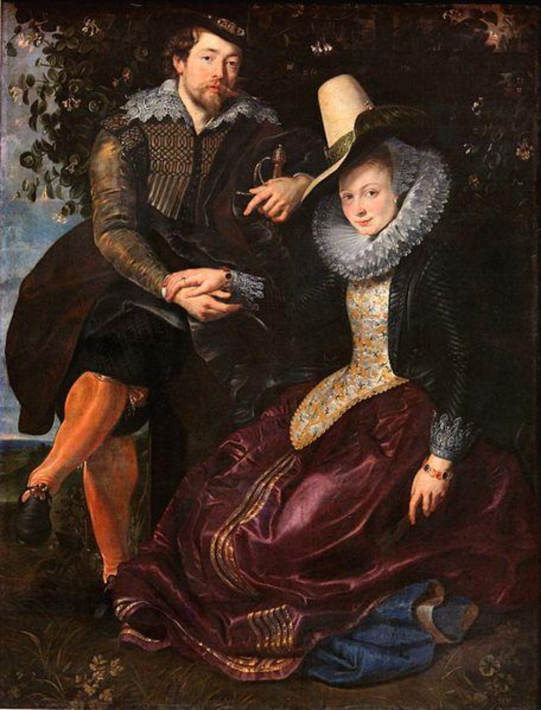
РУБЕНС ПИТЕР ПАУЛЬ «АВТОПОРТРЕТ С ИЗАБЕЛЛОЙ БРАНТ», 1609 г.