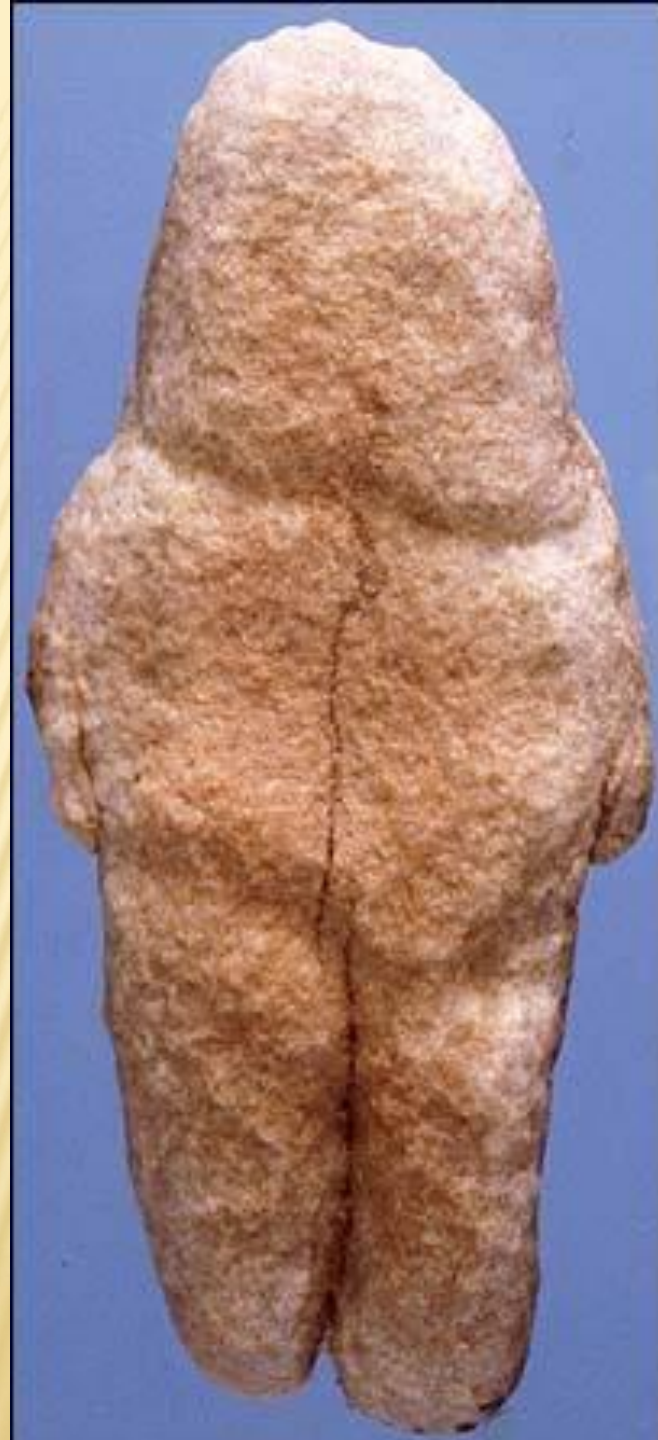
ВЕНЕРА ИЗ ТАН-ТАНА