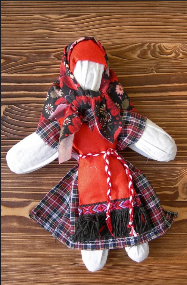
Кукла из еловых шишек