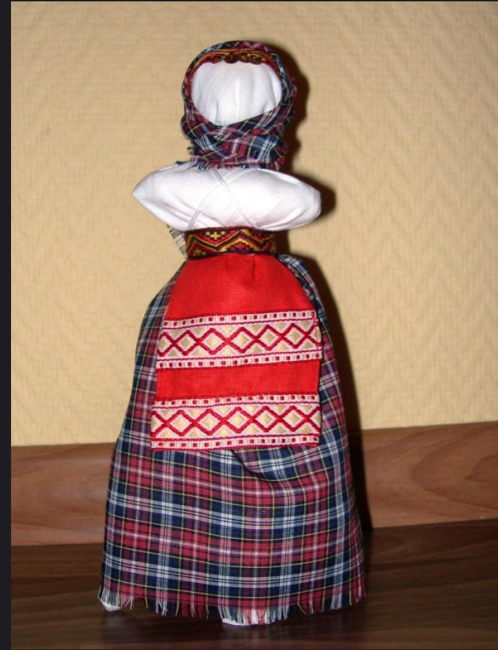
Кукла на еловой ветке