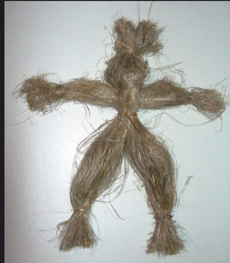
Кукла из льна