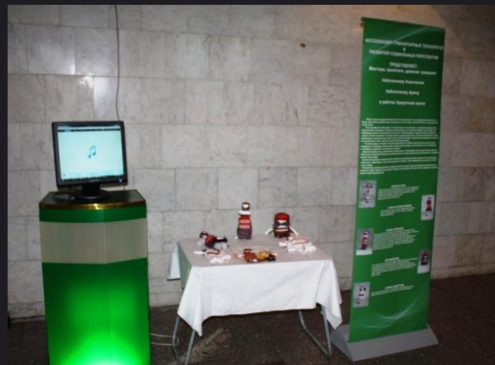
Усть-Илимск, Иркутская область. Выставка «Кукла-любимая игрушка»