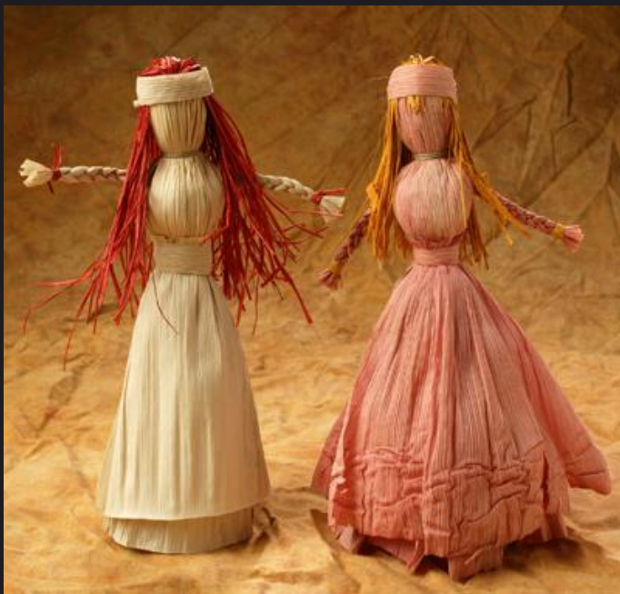
Куклы из кукурузы