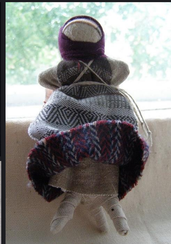
Удмуртская кукла ТРЕНОГА