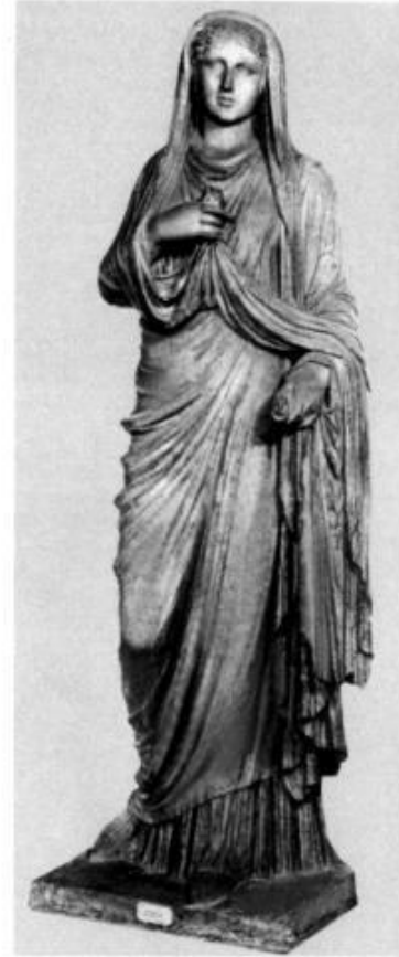
Статуя Эвмахины из Помпей. Неполно.