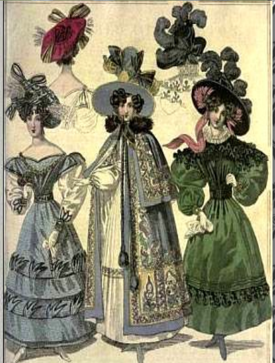
W. & A. G. Co.