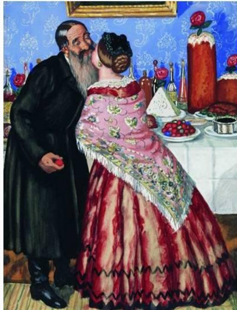
Кустодиев Борис Михайлович Пасхальный обряд (Христосование)