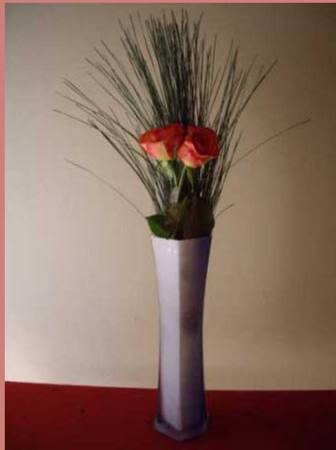
Роза и сосна – символ долголетия