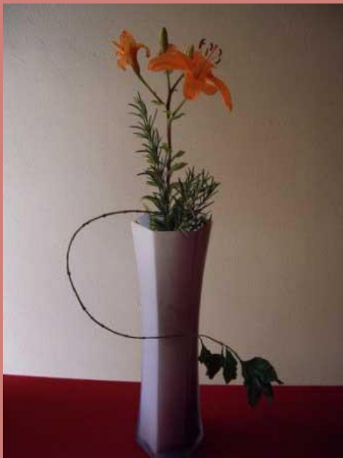
Композиция «Рождение весны»