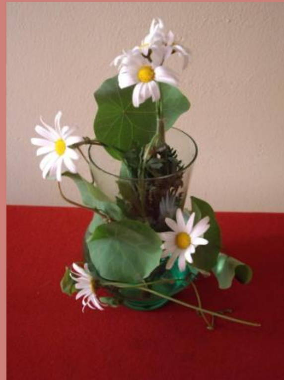
Композиция «Случайное цветение»