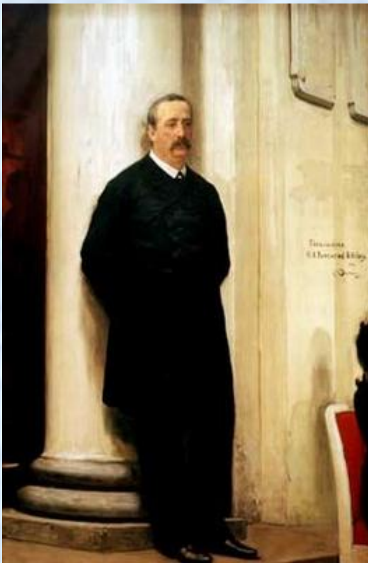
И.Е. Репин. Портрет А.П. Бородина.

Музыка была увлечением всей его жизни Бородина. Он - автор симфоний (среди них "Богатырская", "Русская"), инструментальных, вокальных и других сочинений.