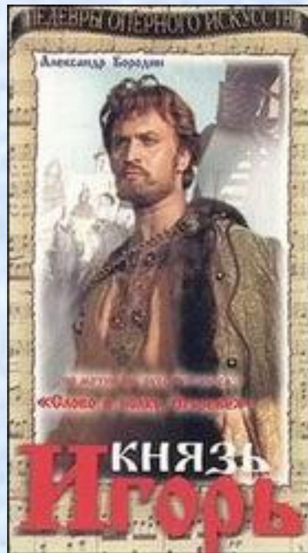
Обложка видеокассеты с фильмом "Князь Игорь".

Невыносимо Игорю в неволе, стыд и позор терзают его душу: "Ни сна, ни отдыха измученной душе, / Мне ночь не шлёт надежды и спасенья, / Всё прошлое я вновь переживаю..." Но музыка говорит нам, что это страдания мужественного человека. Благородными, сдержанными интонациями начинается его большая ария. Все вспоминает Игорь... И музыка вспоминает вместе с ним. Она как хорошая память подсказывает ему картины битвы. Его настроение изменяется трижды: в первой части князь сильно переживает случившееся с ним и его дружиной. Он даже не поет, а скорее, говорит под музыку, тяжело вздыхает. Во второй части князь вспоминает о доме, о жене. Только один человек поймет и простит его поход - жена, Ярославна, Лада, как он ласково ее называет. Мелодия меняется, она становится напевной, лиричной нежной, голос Игоря льется свободно и красиво