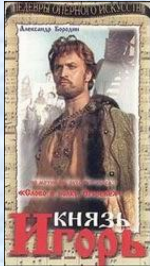
Обложка видеокассеты с фильмом "Князь Игорь".

Невыносимо Игорю в неволе, стыд и позор терзают его душу: "Ни сна, ни отдыха измученной душе, / Мне ночь не шлёт надежды и спасенья, / Всё прошлое я вновь переживаю..." Но музыка говорит нам, что это страдания мужественного человека. Благородными, сдержанными интонациями начинается его большая ария. Все вспоминает Игорь... И музыка вспоминает вместе с ним. Она как хорошая память подсказывает ему картины битвы. Его настроение изменяется трижды: в первой части князь сильно переживает случившееся с ним и его дружиной. Он даже не поет, а скорее, говорит под музыку, тяжело вздыхает. Во второй части князь вспоминает о доме, о жене. Только один человек поймет и простит его поход - жена, Ярославна, Лада, как он ласково ее называет. Мелодия меняется, она становится напевной, лиричной нежной, голос Игоря льется свободно и красиво