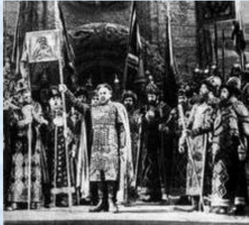
Сцена из оперы "Князь Игорь". Государственный Большой академический театр.