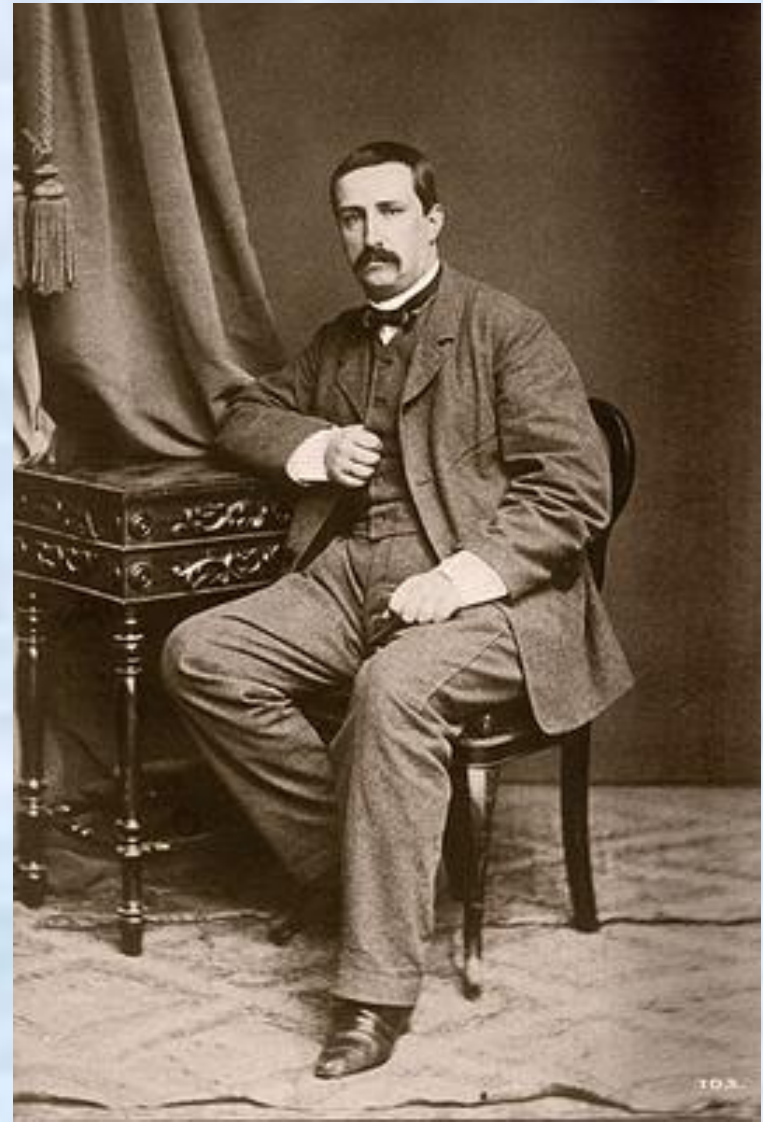
А.П. Бородин. Фотография.

В 23 года, окончив с отличием академию, он получил назначение в госпиталь в качестве врача-ординатора, где проработал четыре года. В дальнейшем стал профессором, академиком химии и медицины, опубликовал более 40 серьезных научных работ!