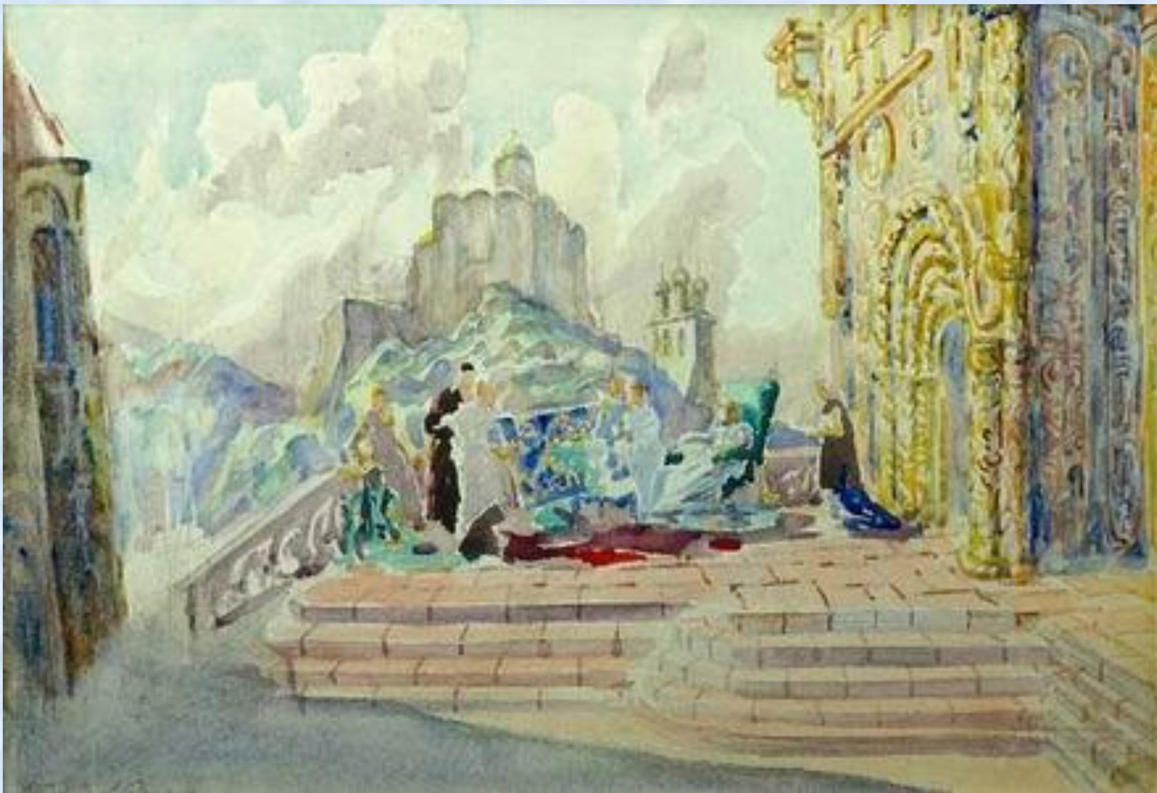
П.П. Соколов-Скаля. Эскиз декораций к опере "Князь Игорь»