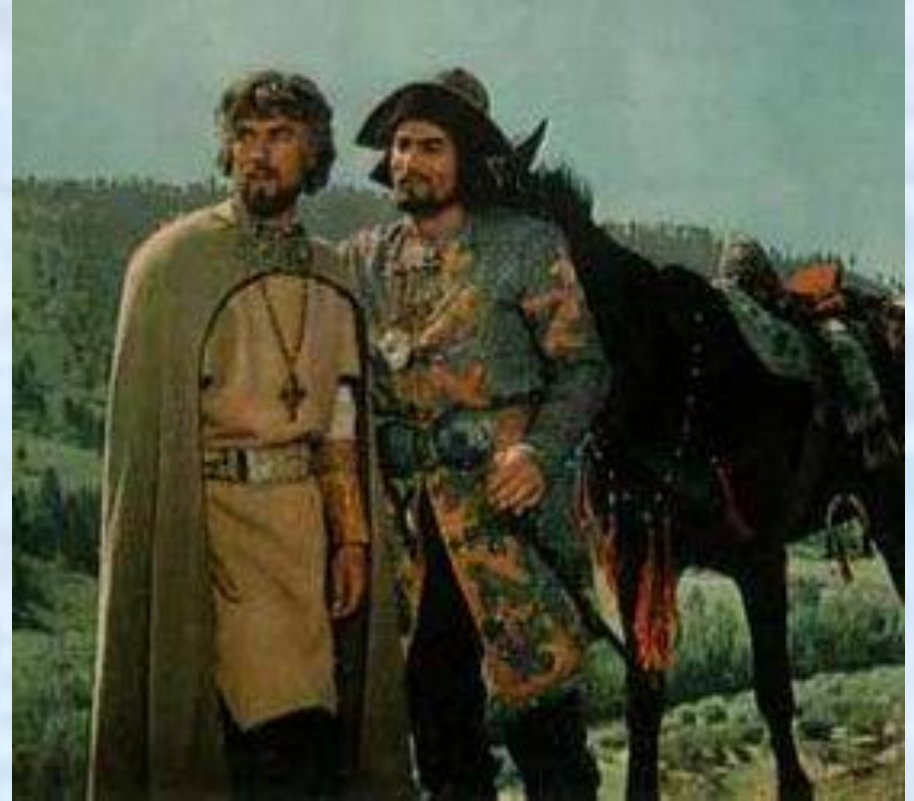
Кадр из фильма "Князь Игорь»

«Князь Игорь» — народно-эпическая опера. Сам композитор указывал на ее близость к глинкинскому «Руслану». Эпический склад «Игоря» проявляется в богатырских музыкальных образах, в масштабности форм, в неторопливом, как в былинах, течении действия.