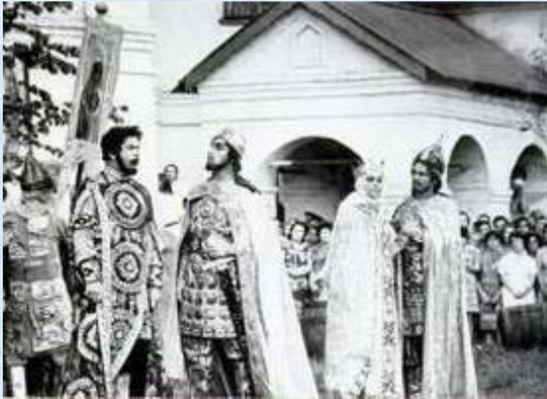
Сцена из оперы "Князь Игорь". Самарский театр в декорациях Ярославского кремля.

Опера начинается с музыкального вступления - увертюры . Она подготавливает слушателя к предстоящему действию, концентрирует его внимание, кратко передает идейный замысел и важнейшие образы произведения.