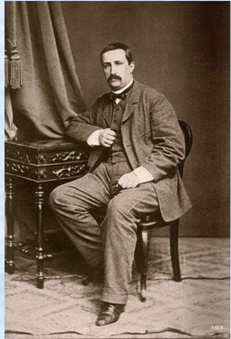
А.П. Бородин. Фотография.

В 23 года, окончив с отличием академию, он получил назначение в госпиталь в качестве врача-ординатора, где проработал четыре года. В дальнейшем стал профессором, академиком химии и медицины, опубликовал более 40 серьезных научных работ!