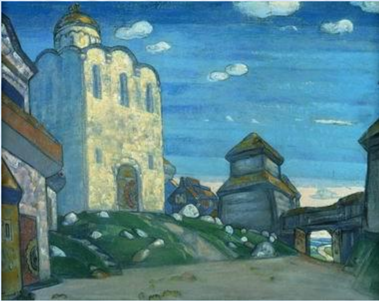
Н. Рерих. Эскиз к декорации «Князь Игорь».