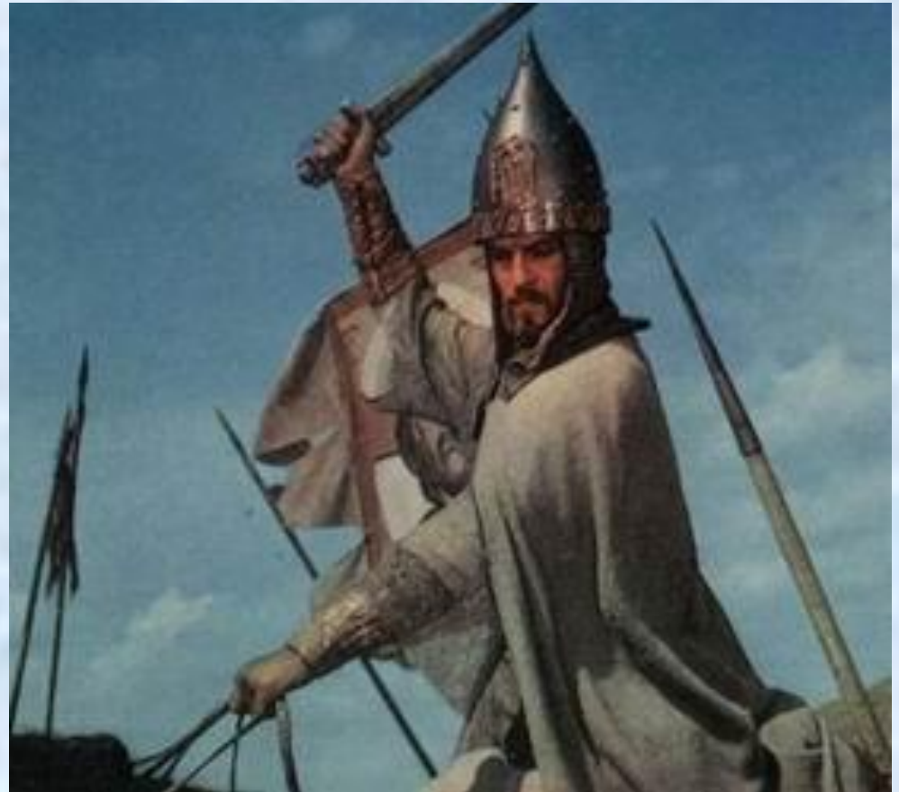
Кадр из фильма "Князь Игорь".

Тем большим отчаянием в третьей части звучит горестный возглас: "О дайте, дайте мне свободу! Я свой позор сумею искупить!" Даже в этом взрыве горя и отчаяния музыкальный образ Игоря сохраняет благородство и силу. Но от правды, неумолимой и жестокой, никуда не уйдешь. "Ужели день за днем влачить в плену бесплодно / И знать, что враг терзает Русь? / Стонет Русь в когтях могучих / И в том винит она меня" - поет князь. Еще раз пронесся над степью горестный возглас, мольба о свободе, и Игорь забывается в тяжёлых думах.