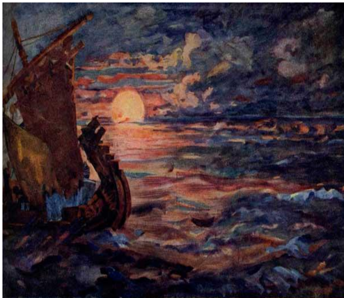
САДКО. Эскиз декорации третьего действия, первая картина

Какой основной приём использовал композитор?