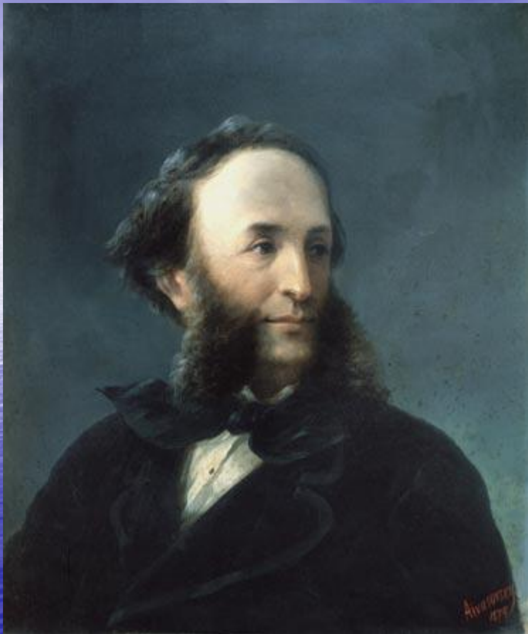
Иван Константинович Айвазовский 1817 - 1900