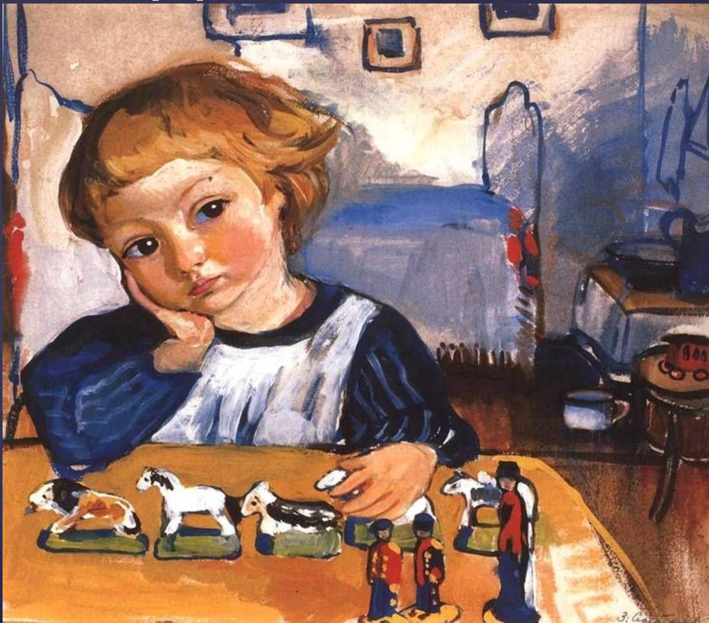
Портрет Жени Серебрякова (1909)