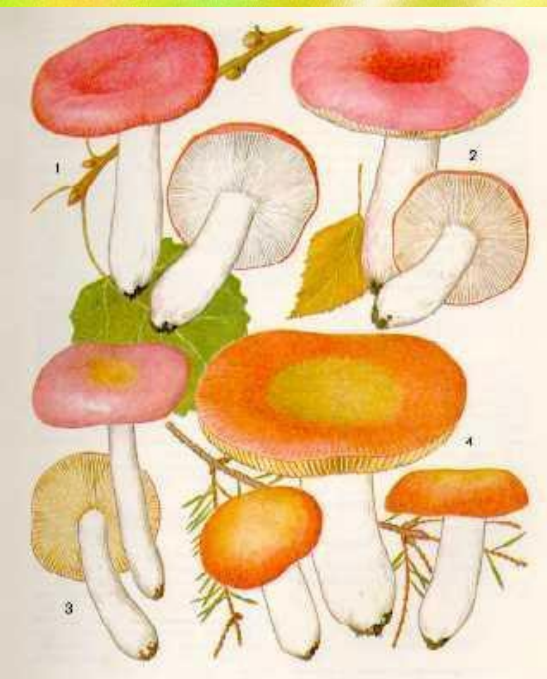
1. LEPISTA SAEVA 2. LEPISTA GYPSARIA 3. LEPISTA NUDA 4. LEPISTA TASCHIROAE