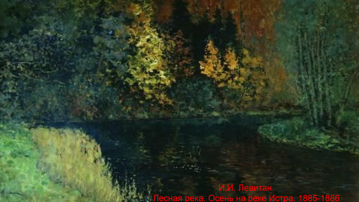
И.И. Левитан. Лесная река. Осень на реке Истра. 1885-1886