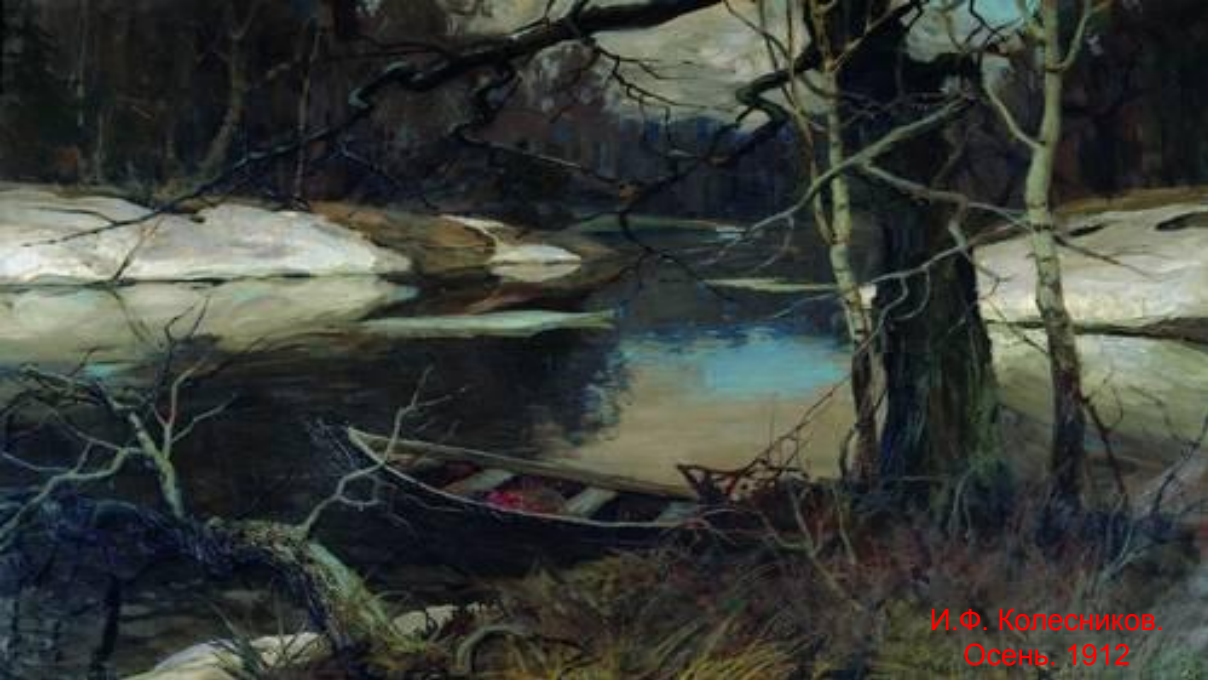
И. Ф. Колесников. Осень. 1912