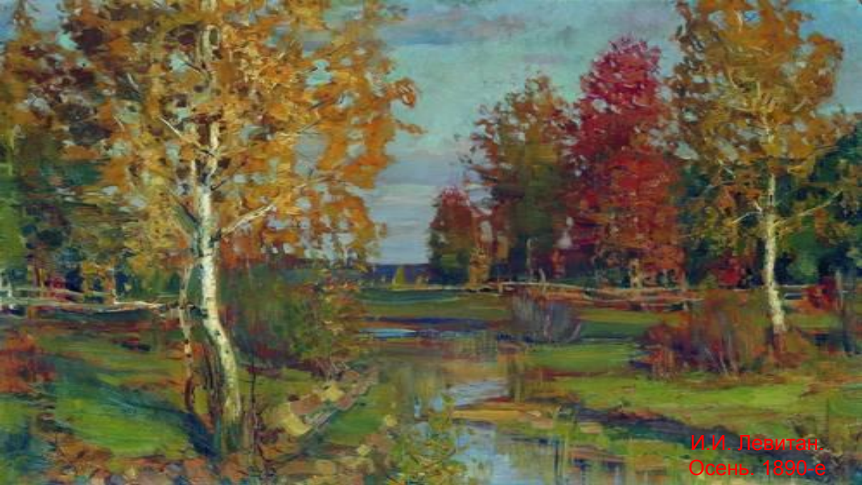
И.И. Левитан. Осень. 1890-е