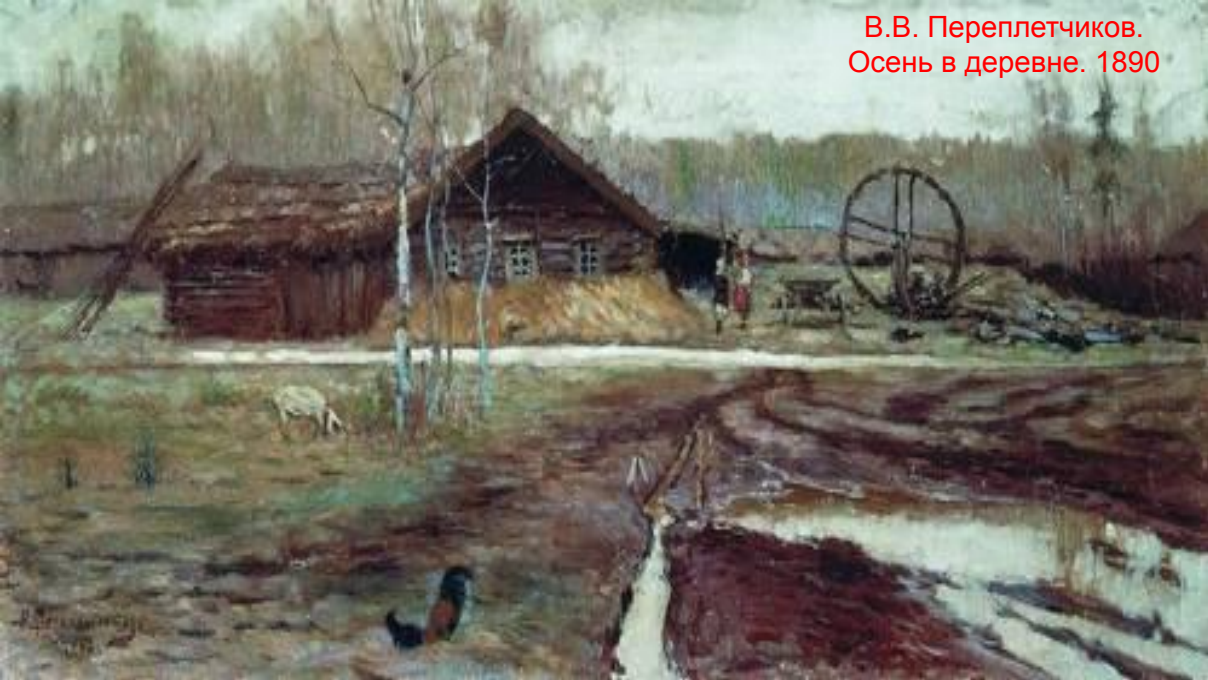
В.В. Переплетчиков. Осень в деревне. 1890