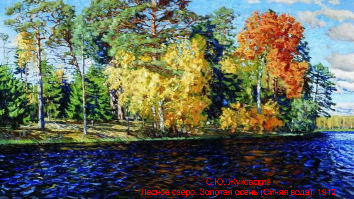
С.Ю. Жуковский Лесное озеро. Золотая осень (Синяя вода). 1912