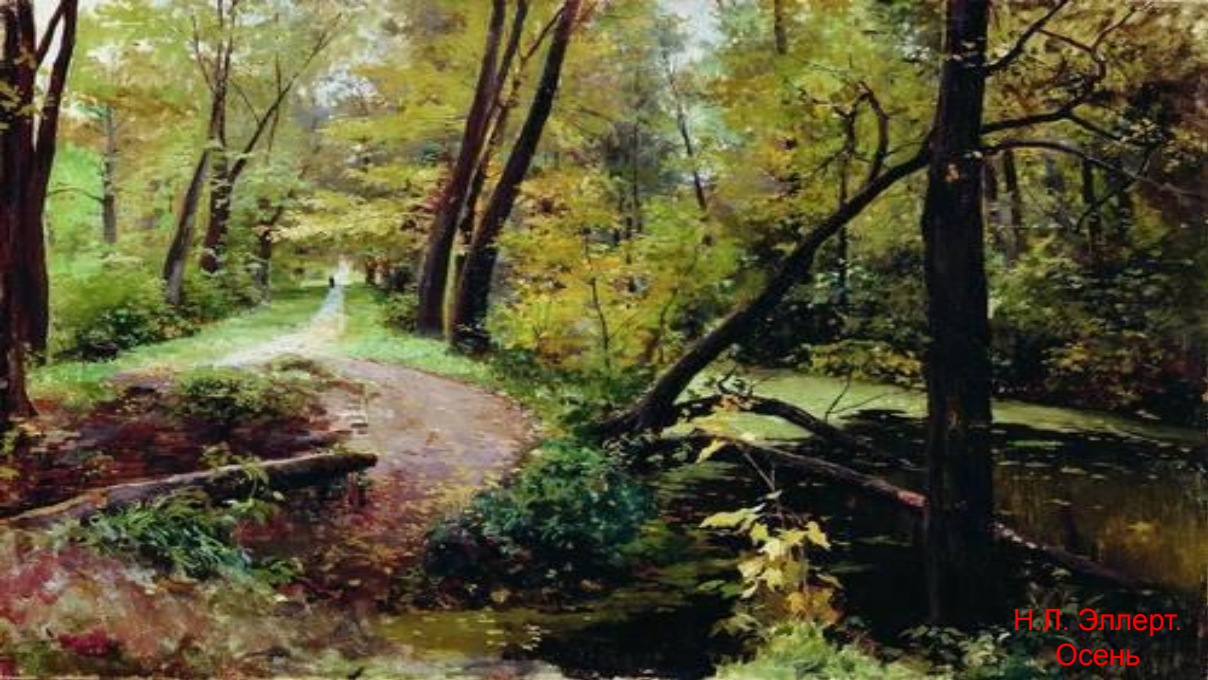
Н. Л. Эллерт. Осень