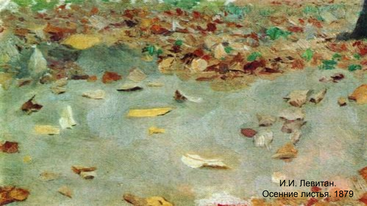
И.И. Левитан. Осенние листья. 1879