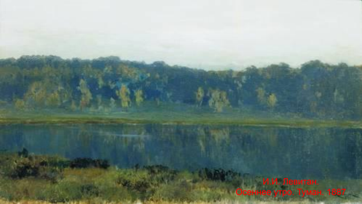
И. И. Левитан. Осеннее утро. Туман. 1887