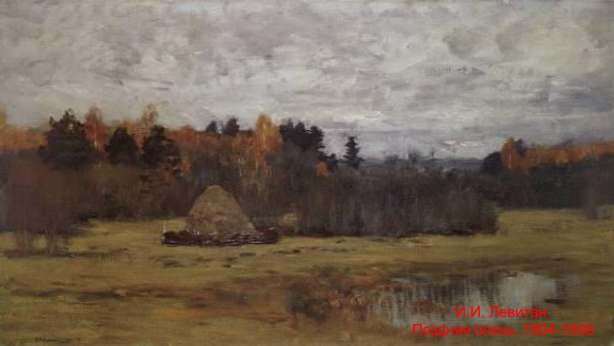
И.И. Левитан. Поздняя осень. 1894-1898