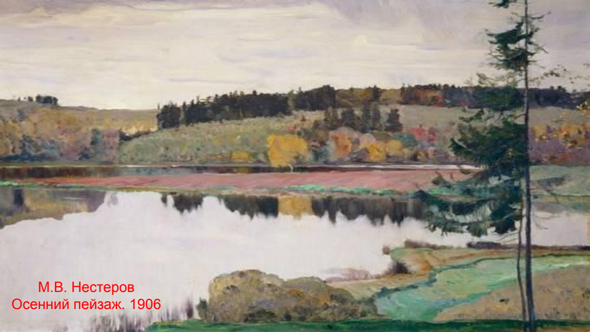
М.В. Нестеров Осенний пейзаж. 1906