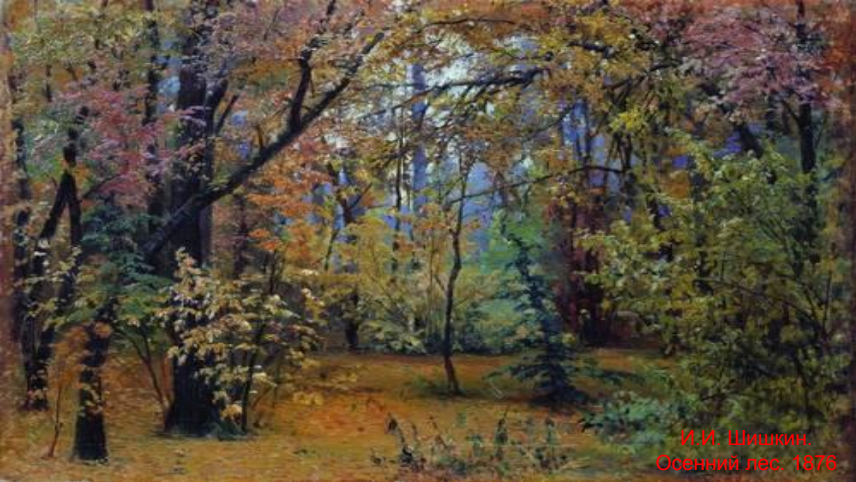
И.И. Шишкин. Осенний лес. 1876