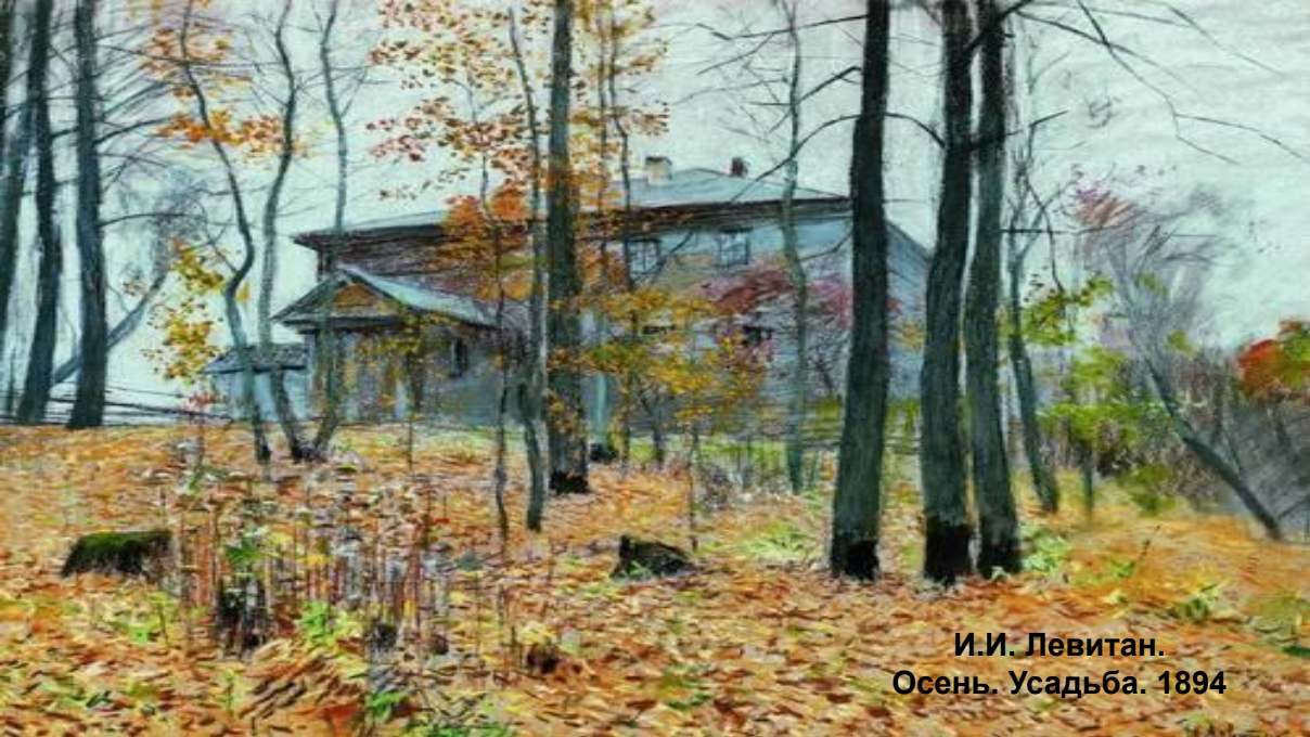
И.И. Левитан. Осень. Усадьба. 1894