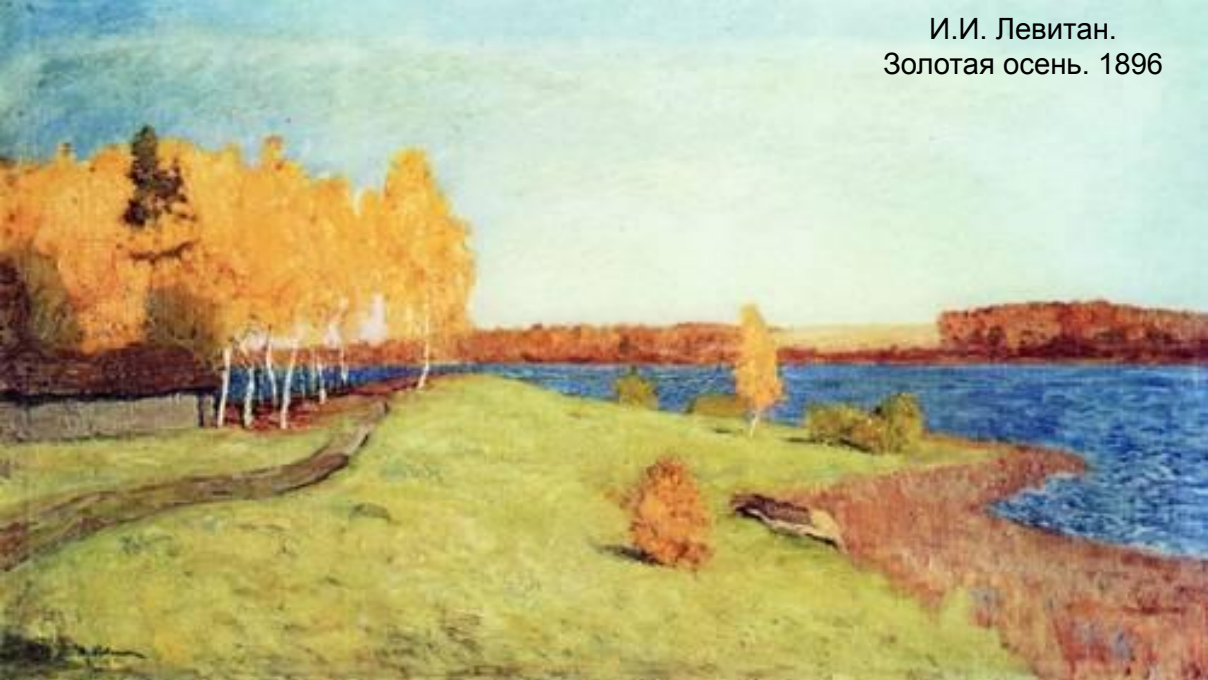
И.И. Левитан. Золотая осень. 1896