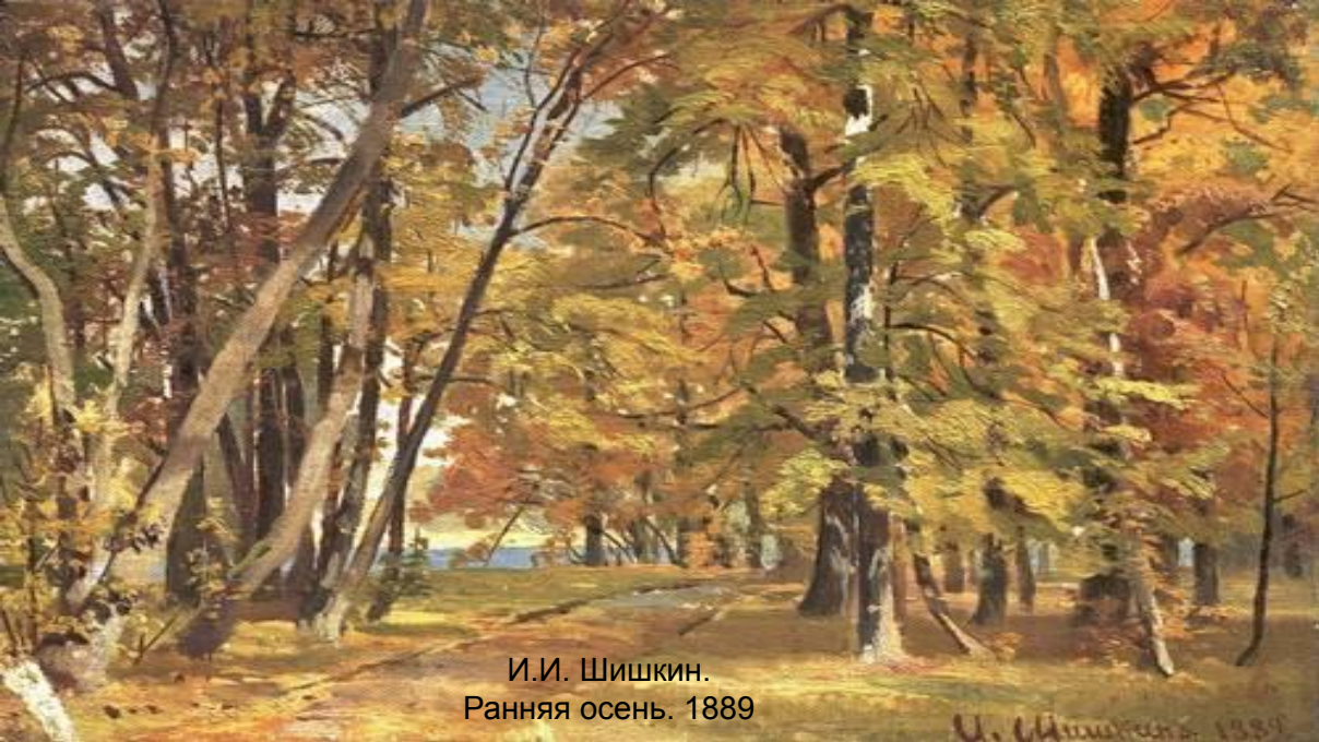
И.И. Шишкин. Ранняя осень. 1889