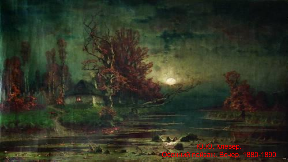
Ю.Ю. Клевер. Осенний пейзаж. Вечер. 1880-1890