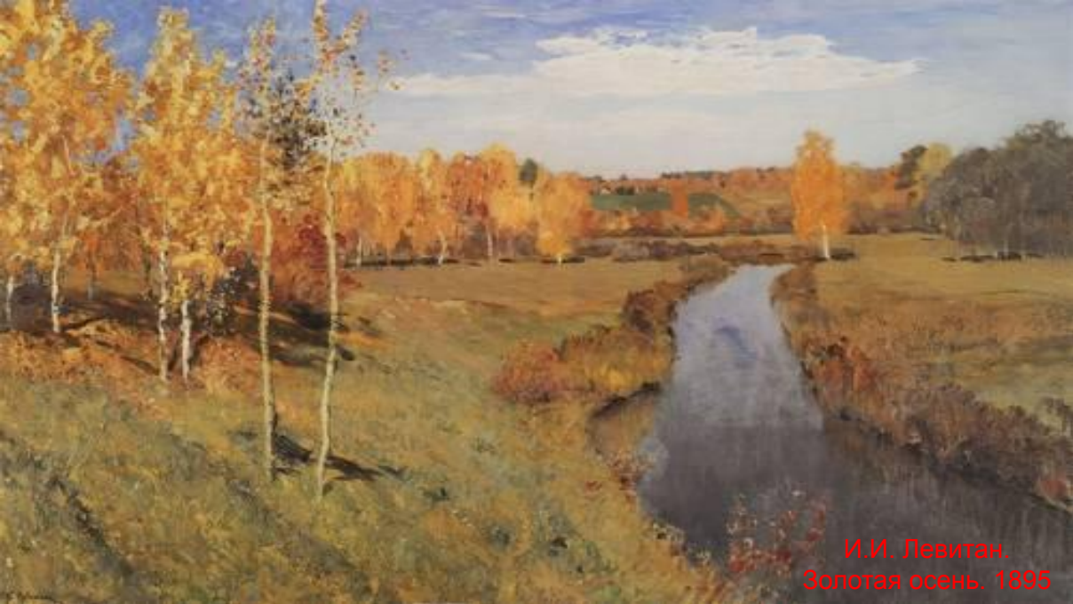
И.И. Левитан. Золотая осень. 1895