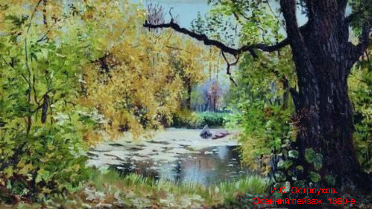
И.С. Остроухов. Осенний пейзаж. 1890-е