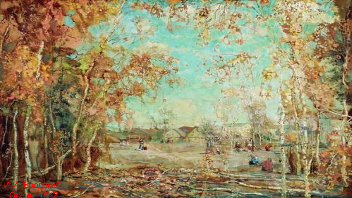
И.И. Бродский. Осень, 1912