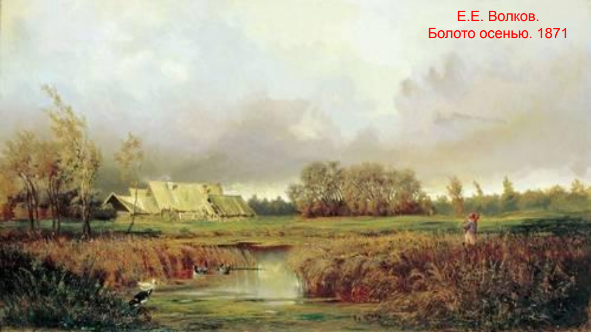
Е.Е. Волков. Болото осенью. 1871