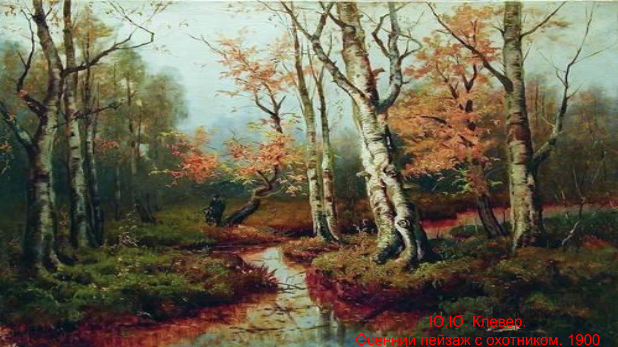
Ю.Ю. Клевер. Осенний пейзаж с охотником. 1900