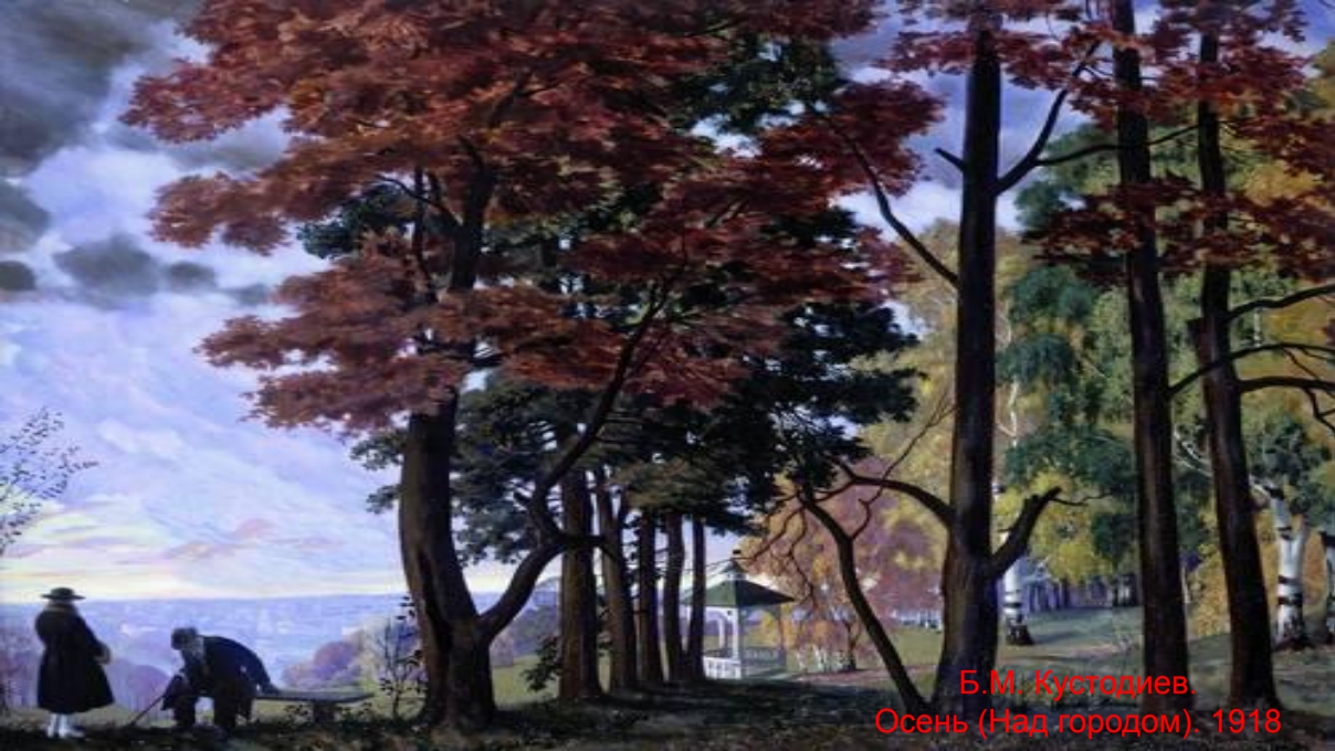
Б.М. Кустодиев. Осень (Над городом). 1918