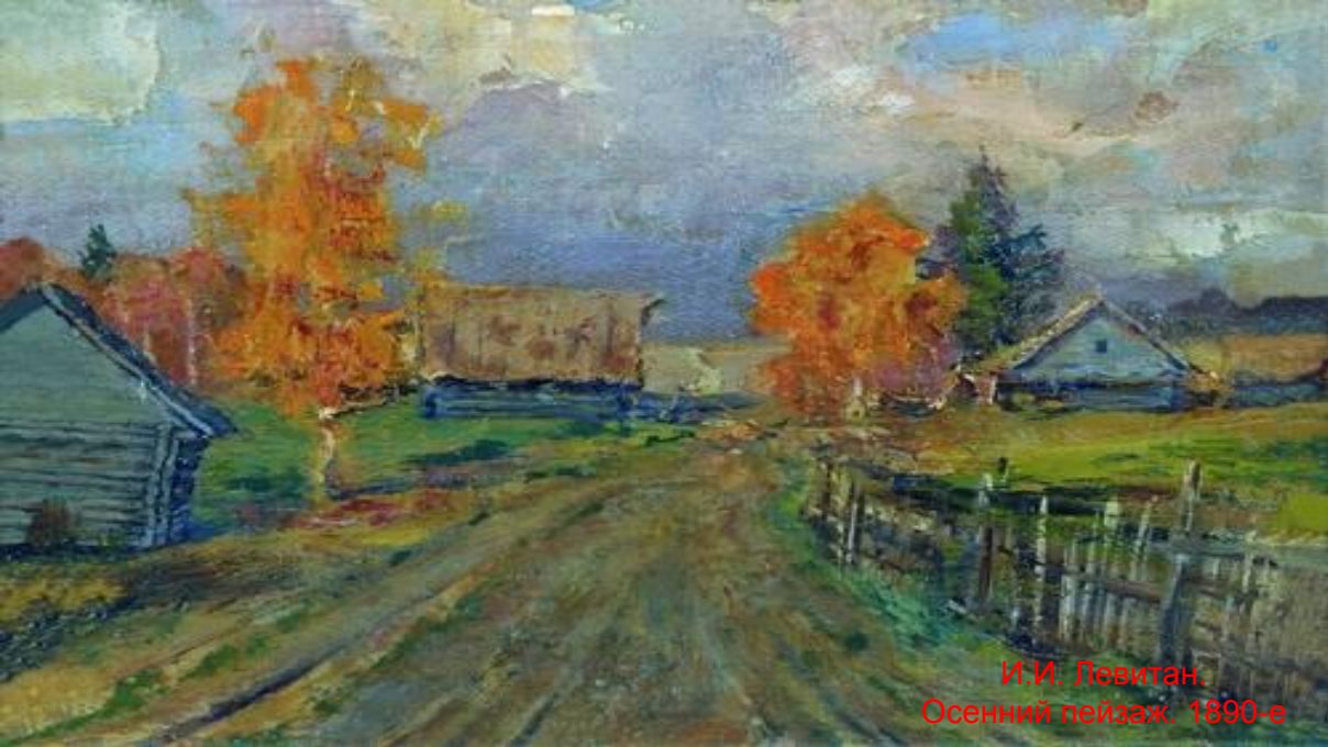
И.И. Левитан. Осенний пейзаж. 1890-е