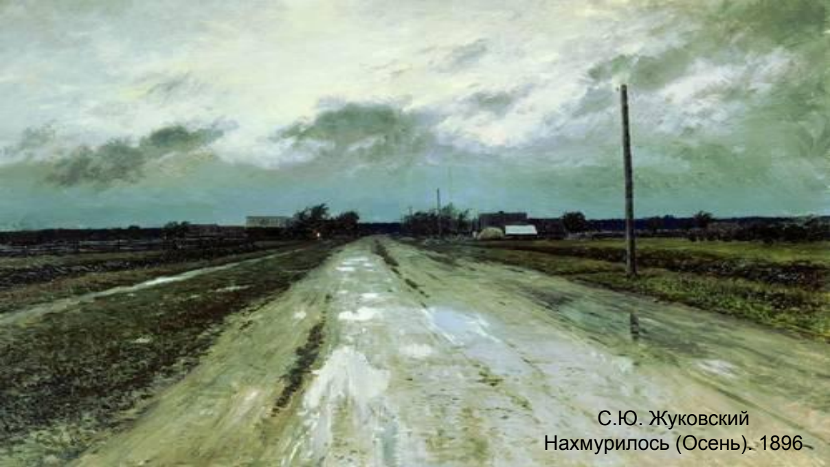
С.Ю. Жуковский Нахмурилось (Осень), 1896